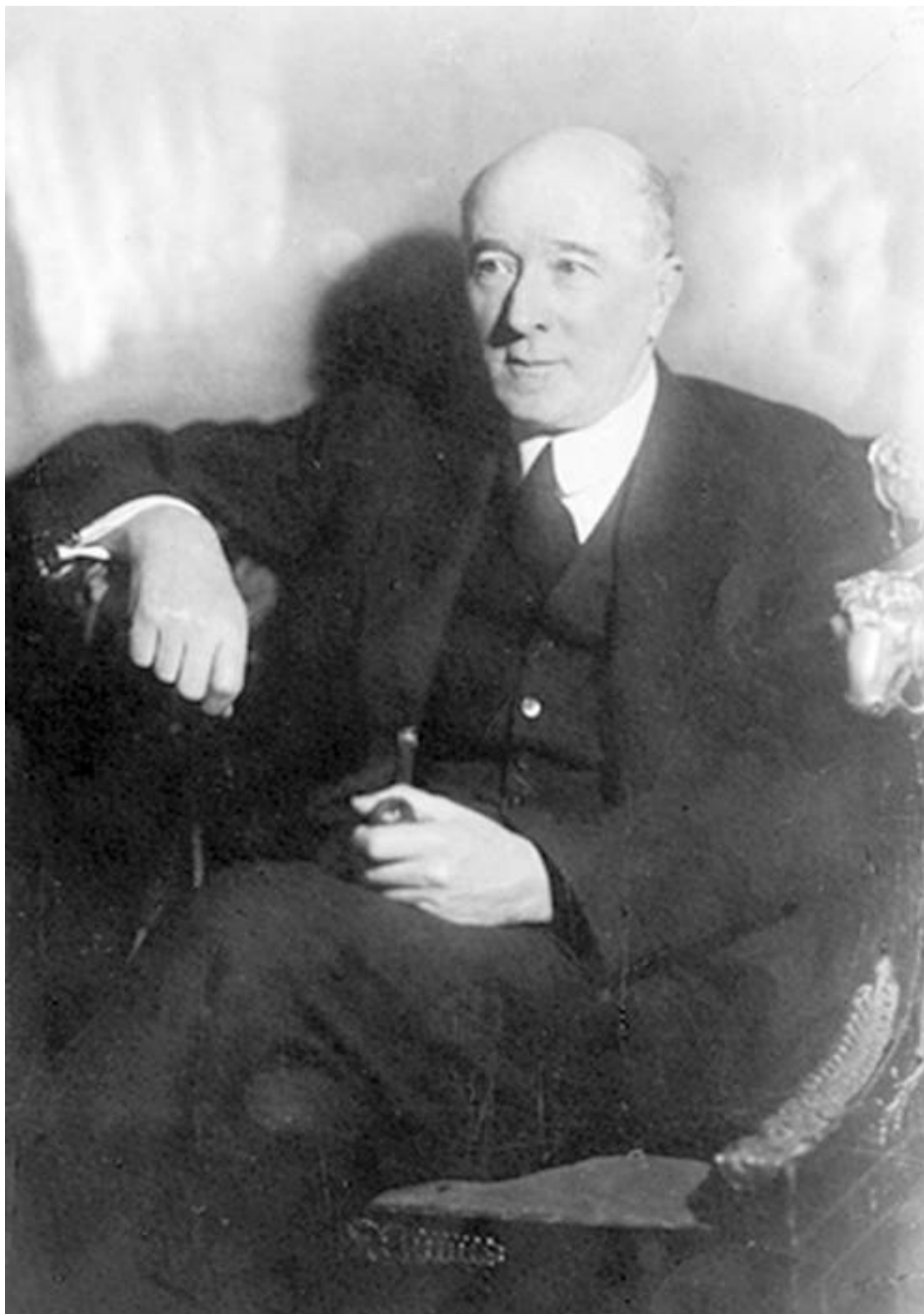
Иван Владиславович Жолтовский

Вначале он собирался уехать на работу в Иркутск, но получил приглашение преподавать в Строгановском училище и остался в Москве. Именно в этом кекушевском доме с эркерами родился его проект гостиницы «Метрополь», который он представил на конкурс. Но в кон-