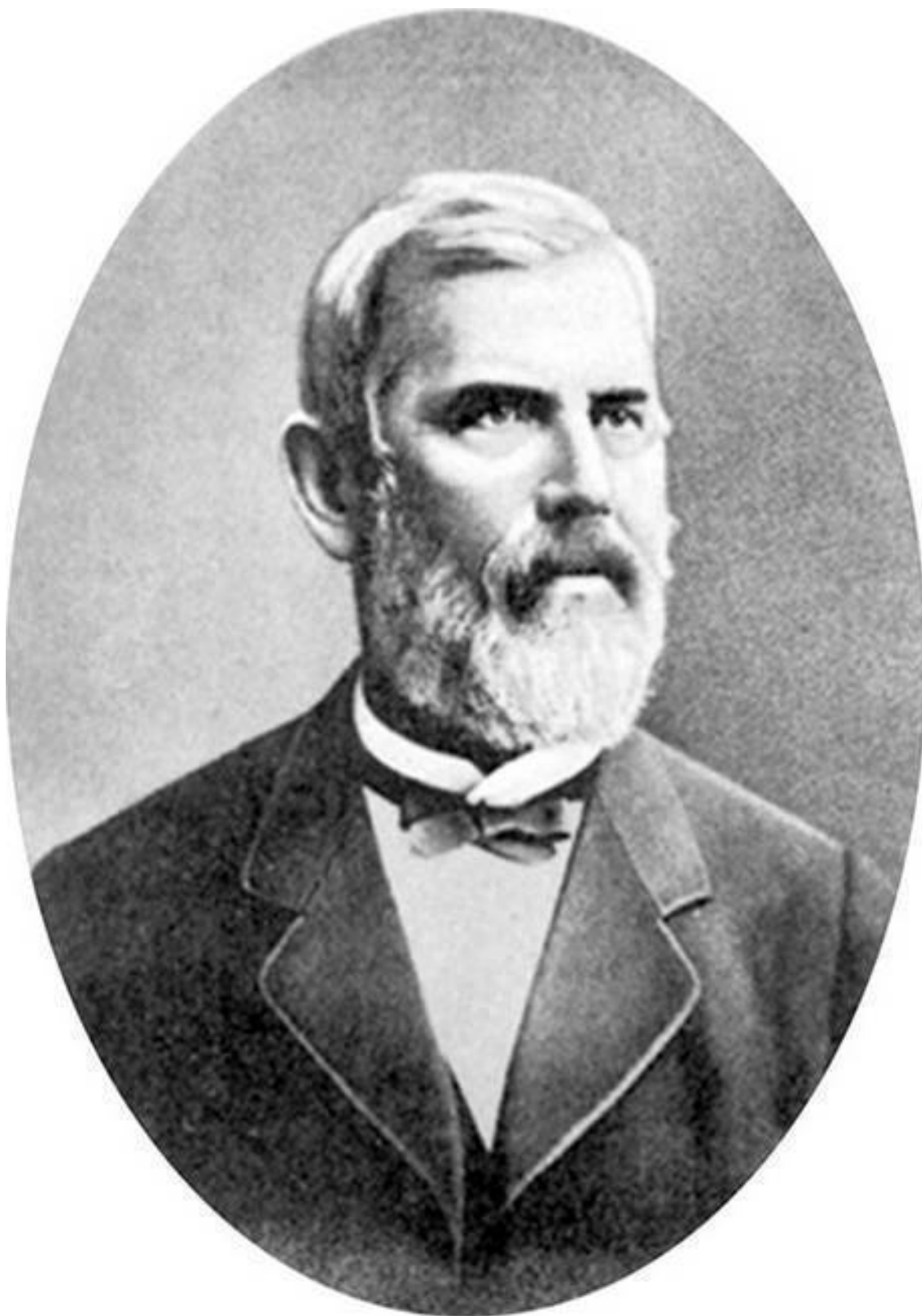
Герасим Иванович Хлудов (1822–1885)

В связи с этим нас интересует один из самых щедрых дарителей из Хлудовых – Герасим Иванович.