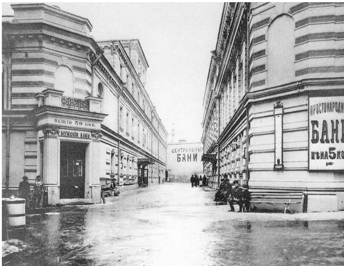
Китайские бани Хлудовых