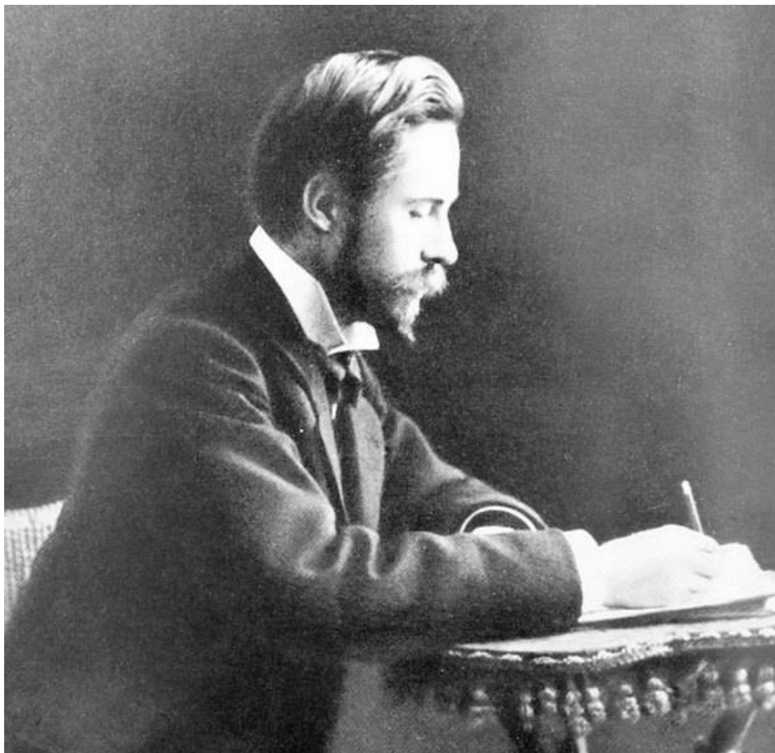
Александр Николаевич Скрябин

твердый характер и полностью посвятил себя музыке. Его судьба, кстати, яркий пример того, что в выборе профессии (при наличии таланта, естественно) надо слушать себя.