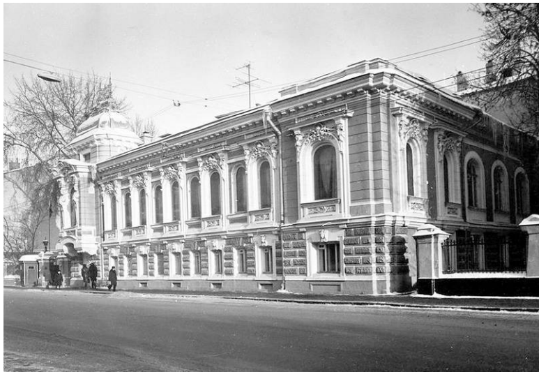
Особняк Коробковой на Пятницкой улице, № 33 (1894–1899)