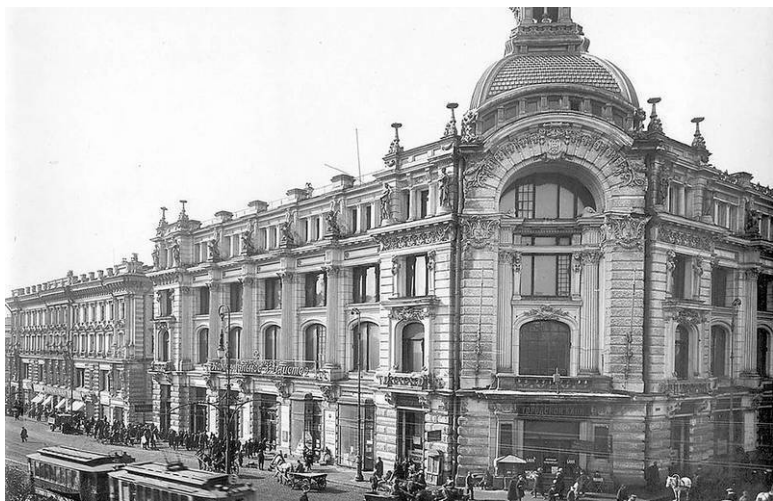
Дом наследниц Хлудовых в Театральном проезде, № 3 (1894–1896)

В 1934 году здание было капитально перестроено по проекту С.Е. Чернышева. А перестройка всегда означает, что от первоначального вида мало что остается. Кроме того – вот уж повезло, так повезло! – была еще одна перестройка по проекту М.М. Посохина в 2001 году. Так что нам остается ностальгический вздох, глядя на старые фотографии и сравнивая их с тем, что стало с домом сегодня.