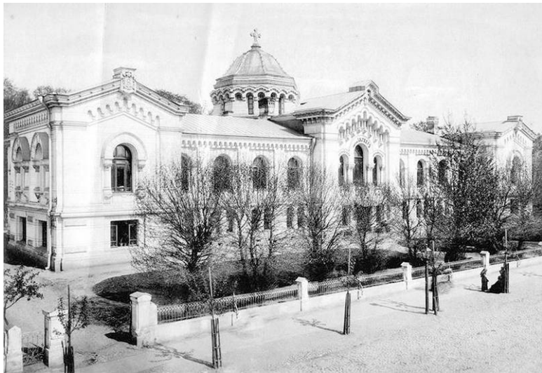
Богательня имени Геера на Верхней Красносельской улице, № 15 (1894–1899)

«Не забудем, что при богательне имелся хороший парк, где призреваемые проводили немало времени.