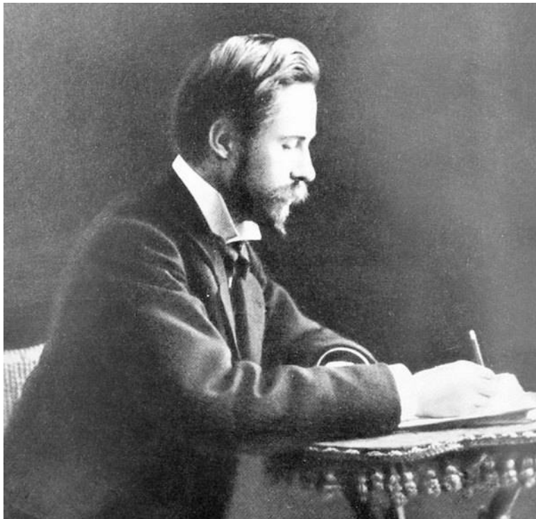
Александр Николаевич Скрябин

По окончании Московской консерватории Скрябин вначале был концертирующим пианистом, но в 1894 году «переиграл» правую руку и в течение некоторого времени не мог выступать. Благодаря этому неприятному и болезнен-