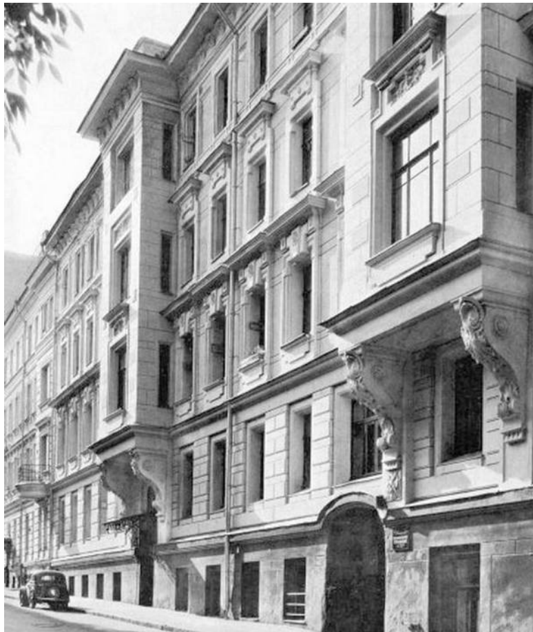
Доходный дом в Варсофьевском переулке, № 6 (1890–1893)