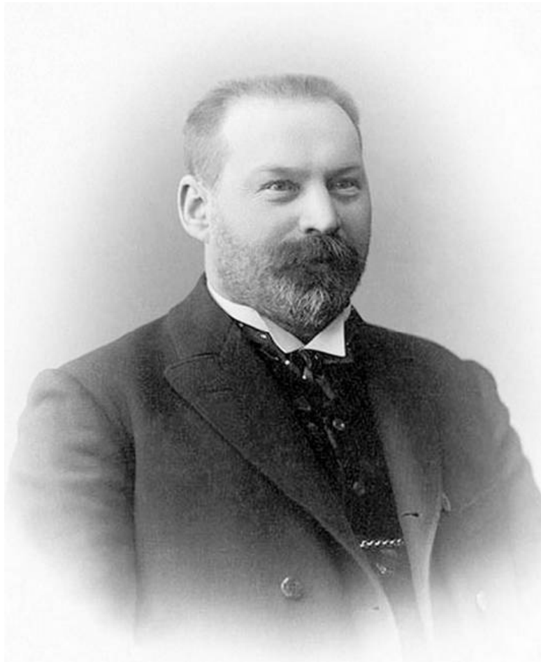
Лев Николаевич Кекушев