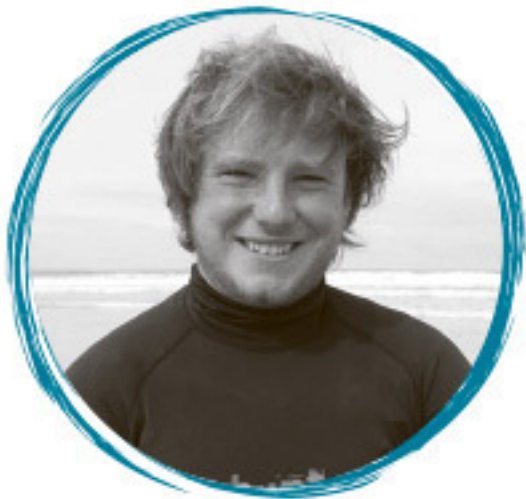
ПЭРРИ 21 ГОД, ДЕВОН, АНГЛИЯ

«Несправедливо, что дети будут расти на грязных пляжах и опасаться того, что может плавать в воде».