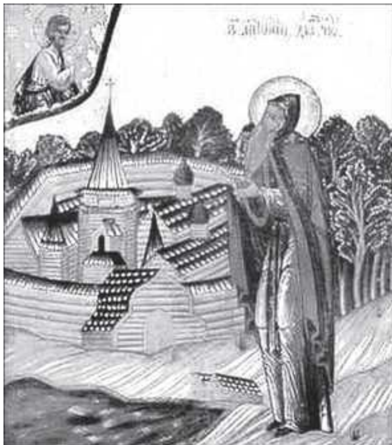
Прп. Антоний Дымский

В 1578 году шведы разорили Валаамский монастырь и валаамские монахи переселились в «монастырь у Онтонья Великого на Дымех». Они установили здесь строгие валаамские монастырские общежительные традиции. Есть публикация описи монастыря 1583 года, а также грамоты новгородского митрополита Варлаама от 23 мая 1592 года в Дымский монастырь валаамским старцам: «...и вы б, и соборные старцы, и вся братья и слуги, жили в том монастыре у Онтонья Великого на Дымех, по чину монастырскому, во всем монастырском житье благочинно, смирно и безмятежно, по преданию отеческому и по закону прежних своих Валаамских начальников Сергия и Германа, общежительством, каков закон и начало их положено было изстари в Валаамском монастыре; а нынеча по тому ж бы есте, в том монастыре на Дымех, закон не разорили, но исполнили по всякому благочинью, и жили б есте в согласие вся братья и слуги, вкупе, единомышленно и меж себя в послушание, и монастырское содевали по совету с собору всей братьи, а без брацкого совету некоторой бы у вас старец, ни слуга, в монастыре не действовали, община б у вас была по прежнему, и платеную одежду и обувь братье и слугам, вся кому человеку монастырскому, давали по старине из монастырские казны...».