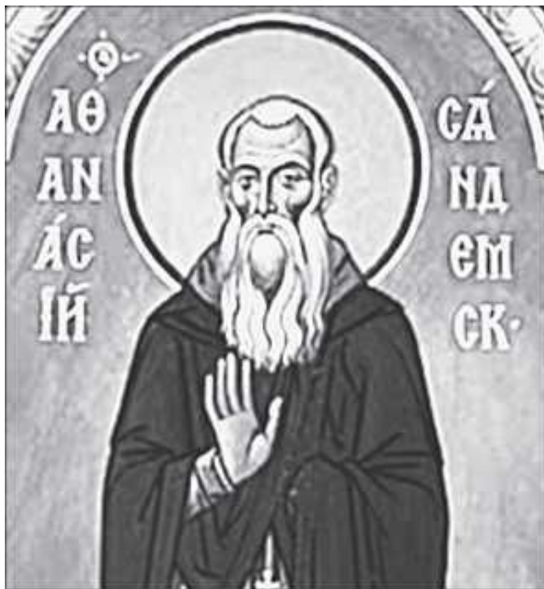
Прп. Афанасий Сянжемский

Преподобный Афанасий начал свои иноческие подвиги на Валааме, а затем в Свирском монастыре. После кончины своего наставника святой ушел для пустынножительства в дремучие леса Карелии, где на озере Сяндеме основал обитель. Вследствие клеветы на него местных жителей преподобный Афанасий переселился обратно в Свирский монастырь, где был избран игуменом, но впоследствии снова вернулся на озеро Сяндем.