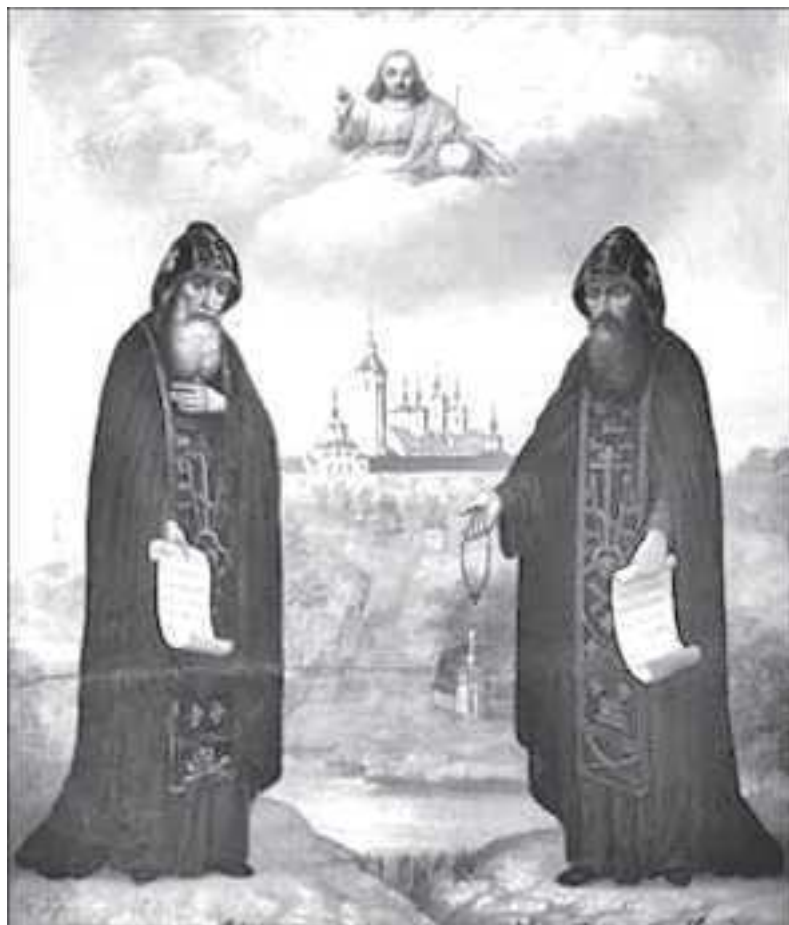
Прпп. Сергей и Герман, чудотворцы Валаамские

Когда же земли карел были захвачены шведами, начались гонения на православных. Летописи сообщают, что подвалы и застенки шведских крепостей и, в частности, Выборг забиты карелами, не желавшими изменить православной вере и принять католичество.