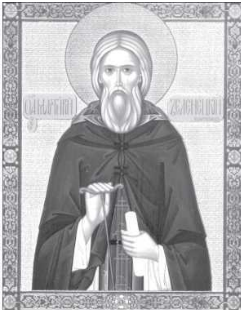
Прп. Мартирий Зеленецкий

почившей на обители преподобного Мартирия, инок Гурий сподобился видеть над церковным крестом сиявший на небе Крест.