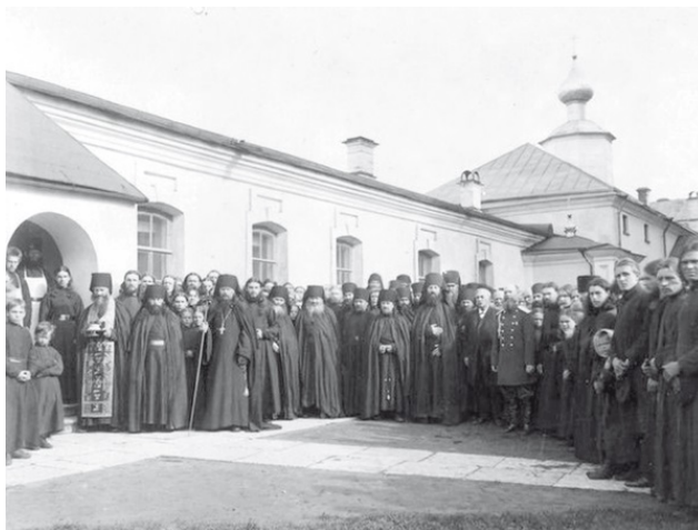
Валаамский монастырь. Братия у трапезной. 1900-е гг.

Во время советско-финляндской войны монастырь попал в зону боевых действий, и монахи, принявшие к тому времени финское подданство, в начале февраля 1940 года покинули острова, увезя с собою все самое ценное (включая подлинник иконы Валаамской Божией Матери, другие святыни и колокола).