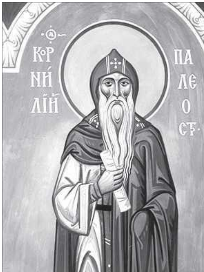
Прп. Корнилий Палеостровский

Родился в Пскове, был основателем иноческого жития на острове Палий Онежского озера в конце XIV века. Несмотря на уединенность острова, к нему вскоре собрались братья, для которых он построил церковь в честь Рождества Пресвятой Богородицы. Последние годы жизни преподобный проводил в пещере, в полуверсте от обители, пребывая в постоянной молитве.