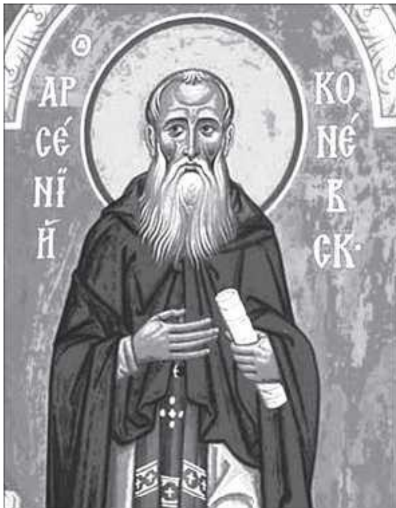
Прп. Арсений Коневский

На острове находилось древнее языческое капище. В центре его помещался огромный валун, именовавшийся Конь-камень (отсюда и название острова Коневец), где приносились жертвы.