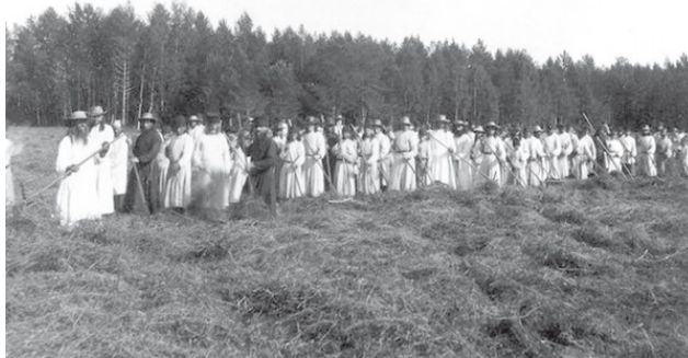
Валаамский монастырь. Братия на сенокосе. 1900-е гг.

Только с 1960-х годов на остров стали приходить первые теплоходы с туристами. В 1979 году на территории организован музей-заповедник, и позже началась реставрация памятников.