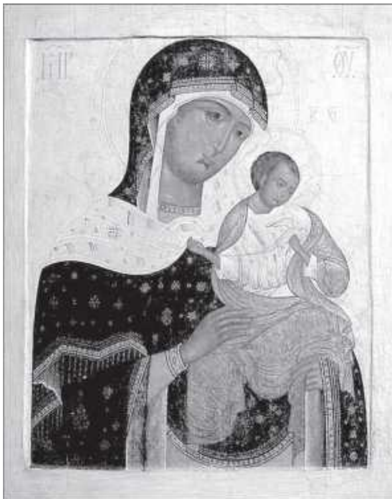
Конеvская икона Божией Матери