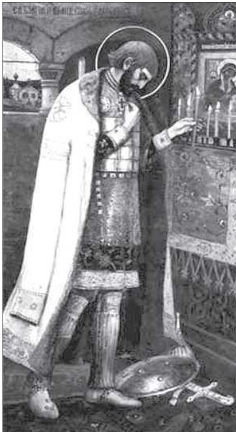
Блгв. вел. кн. Александр Невский

В условиях страшных испытаний, обрушившихся на русские земли, Александр Невский сумел найти силы для противостояния западным завоевателям, снискав славу великого русского полководца, а также заложил основы взаимоотношений с Золотой Ордой.