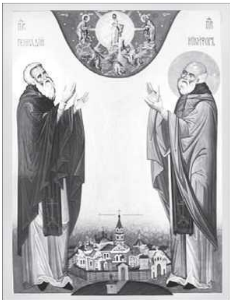
Прп. Никифор и Геннадий Важеозерские

По возвращении оттуда, с благословения преподобного Александра, он поселился на Важеозере там, где раньше подвизался преподобный Геннадий Важеозерский. Святой Никифор построил храм Преображения Господня и монастырь, в котором ввел общежитие. Тут и подвизался он до самой своей кончины. Скончался прп. Никифор 9 февраля 1557 года.