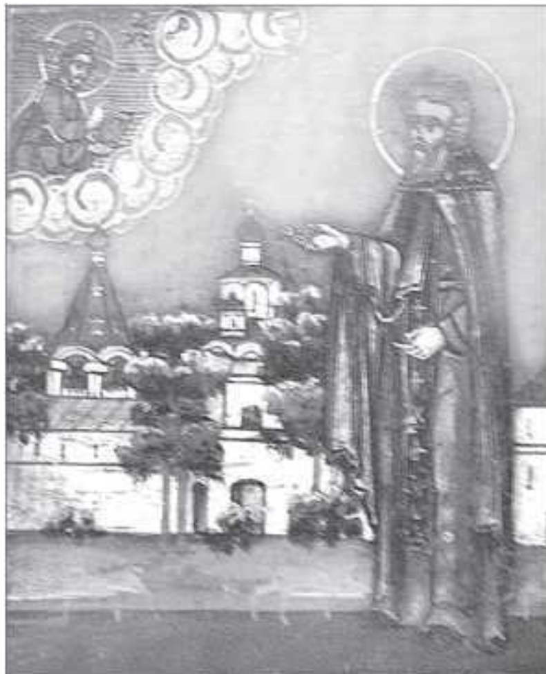
Прп. Макарий Оредежский

Был учеником преподобного Александра Свирского. Он подвизался на реке Оредеже у Ладожского озера, где основал монастырь. Скончался в 1532 году.