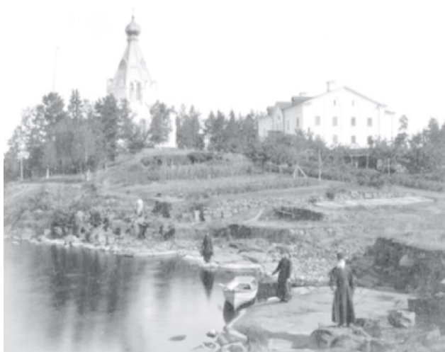
Валаамский монастырь. Скит Св. Николая Чудотворца. 1900-е гг.

После Октябрьской революции Валаам вошел в состав вновь образованной Финляндии, благодаря чему сохранился, но обитель оказалась церковью нацменьшинства (основная религия Финляндии – лютеранство). Начиная с 1925 года стали проводиться службы на финском языке, а сами острова основательно были укреплены в военно-инженерном отношении.