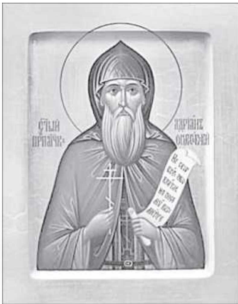
Прп. Адриан Ондрусовский