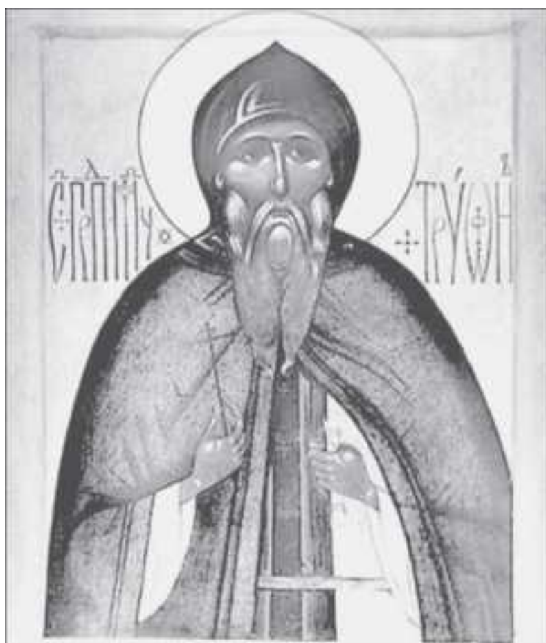
Прмч. Трифон Городецкий

Когда литовцы появились у Городца, он совершал в монастырском храме Литургию. Братия, испугавшись иноземцев, разбежалась по окрестным лесам.