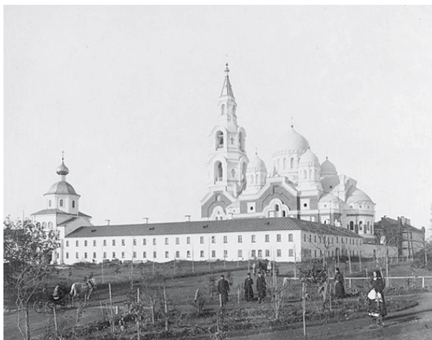
Валаамский монастырь. Спасо-Преображенский собор. 1900-е гг.

Отец Дамаскин установил для братии суровый режим: обязательное попечение старцев о послушниках и молодых монахах, неукоснительное посещение церковных служб, многочасовые трудовые послушания. После смерти игумена Дамаскина монастырем управлял его преемник Ионафан II, который смог осуществить наиболее масштабное начинание игумена Дамаскина – строительство нового величественного Спасо-Преображенского собора, рассчитанного более чем на 3000 человек.