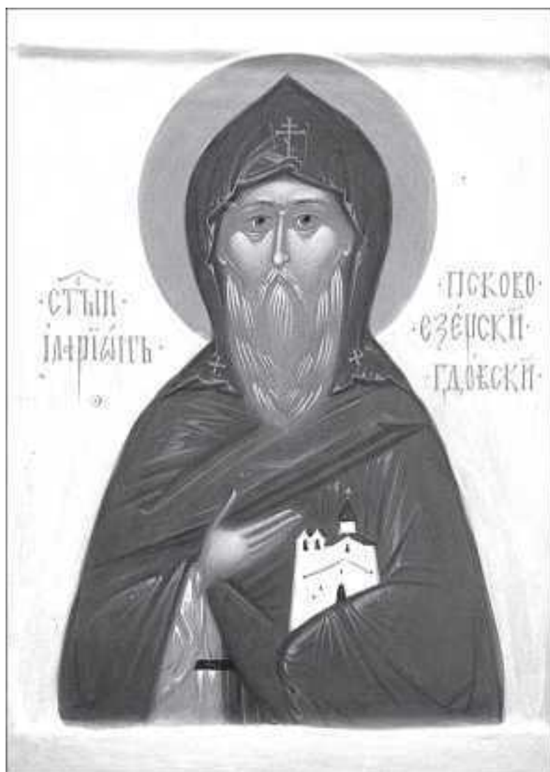
Прп. Иларион Псковоезерский

Обитель находилась на границе с Ливонским орденом, поэтому иноки постоянно претерпевали нападения воинственного ордена. Несмотря на трудные условия и недостаток средств, преподобный Иларион утвердил в монастыре высокое благочестие. Вместе с тем велись большие работы по укреплению и благоустройству обители. Преподобный и сам не оставлял аскетизмы, неся подвиг столпничества, – он молился в дупле сосны близ своей обители, работал вместе с братией. Сохранилось предание, что святой уже в земной жизни мог прозревать кто, с чем пришел и кто какой страстью одержим.