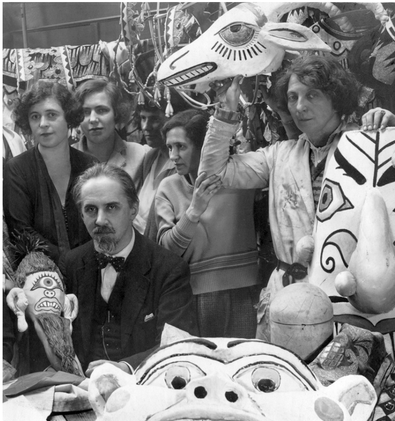
Русский Париж, 1930-е годы