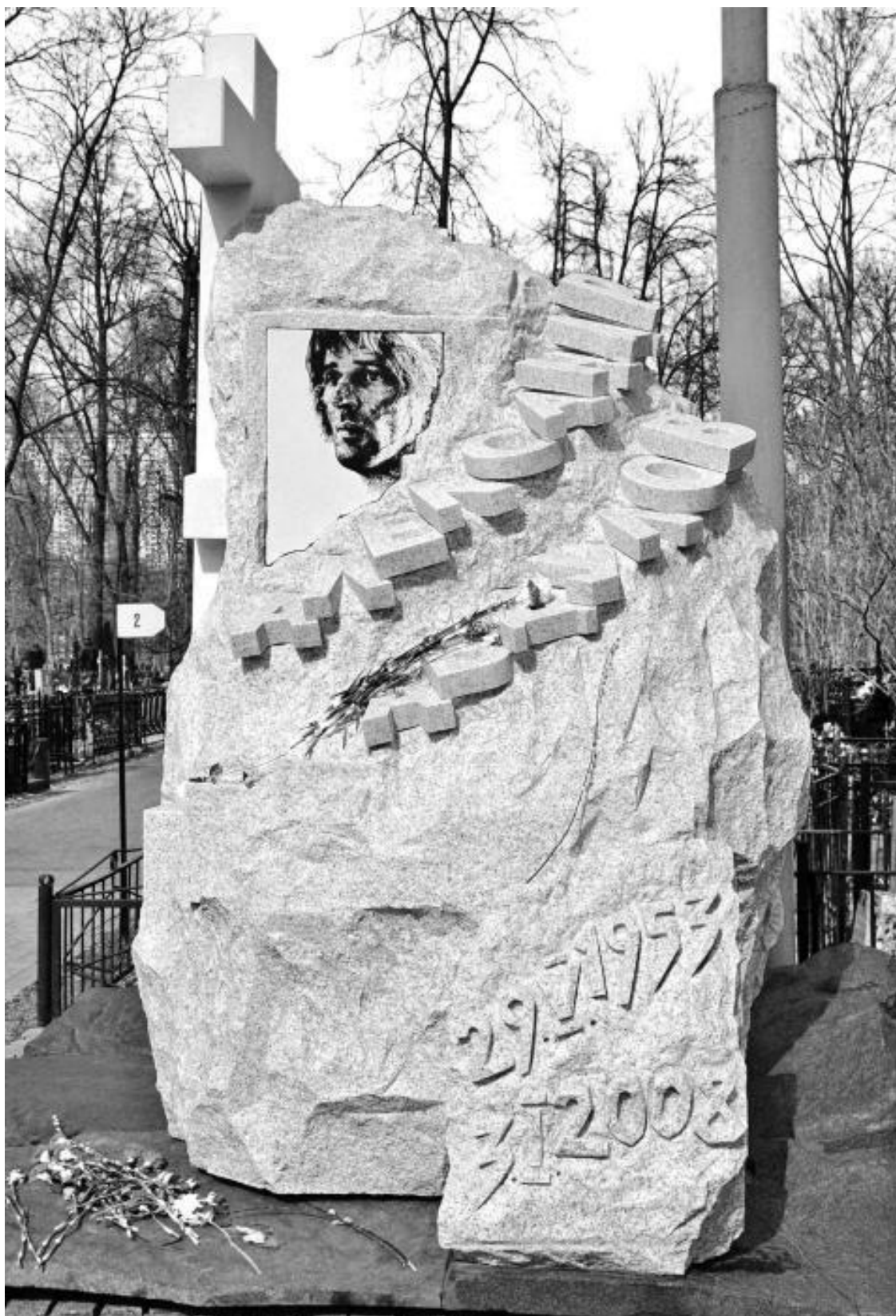
Могила А. Абдулова на Ваганьковском кладбище

Но и это еще не все. По мнению врачей, природа рака, от которого умер Александр Абдулов, до конца не изучена: от чего появляется эта страшная болезнь и что ее вызывает – неизвестно. Некоторые онкологи уверены: все дело в психике. По словам специалистов, спровоци-