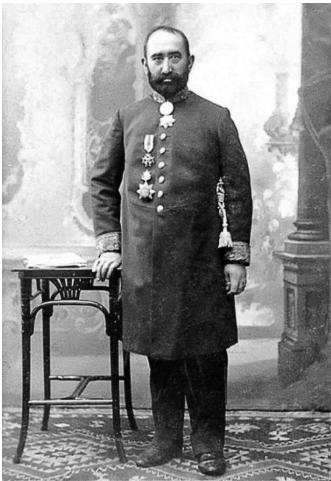
Нефтяной олигарх Муса Нагиев

Дилера Нагиева: «Но Ага Муса не знал, кем он похищен. Он думал, что это опять губернатор и кому-то деньги понадобились. Вдруг открывается дверь и заходит Сталин, то есть Коба. Под этим псевдонимом он тогда и был известен. Заходит, а дед ему и говорит: «Сталин, да как тебе не стыдно? Тебе деньги нужны были? Ты меня сюда зачем привез?»»