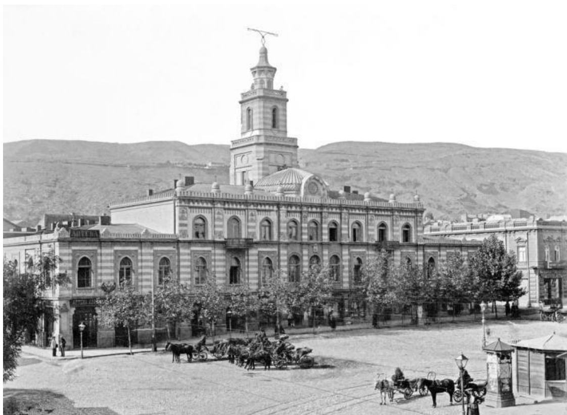
Площадь, на которой прошла тифлисская экспроприация

С самого начала все пошло не так. В 11 часов утра инкассаторский фаэтон под усиленной охраной выехал на центральную площадь. И в этот момент из переулка к нему наперерез выскочил армейский экипаж, в котором находились знакомые нам налетчики, переодетые уже в военную форму. Однако охрана, наученная горьким опытом, открыла предупредительный огонь. Тогда грабители, понимая, что врасплох заставить охрану не удалось, пошли на крайнюю меру. Тер-Петросян, он же Камо, в форме пехотного капитана, с криком «Не стрелять!» выскочил из экипажа и в следующее мгновение бросил гранаты с двух рук.