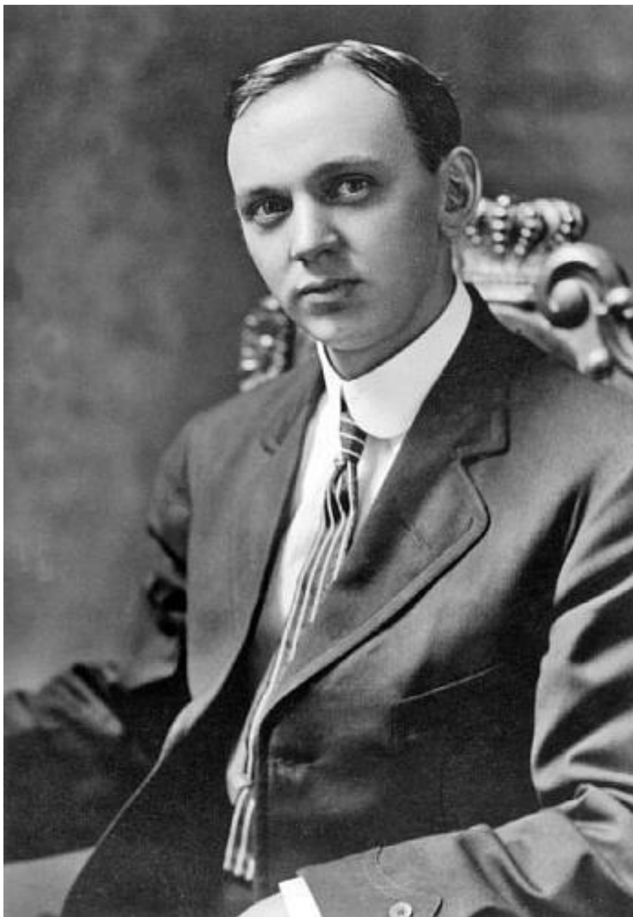
Эдгар Кейси считал, что возрождение цивилизации произойдет в Сибири

Американские газеты начала XX века пестрели рассказами об Эдгаре Кейси. У его клиники выстраивалась многодневная очередь больных. Очень скоро он стал настолько знаменитым, что, когда был в других городах и жил в гостиницах, мальчишки-коридорные брали по пять долларов с желающих хотя бы посмотреть на него.