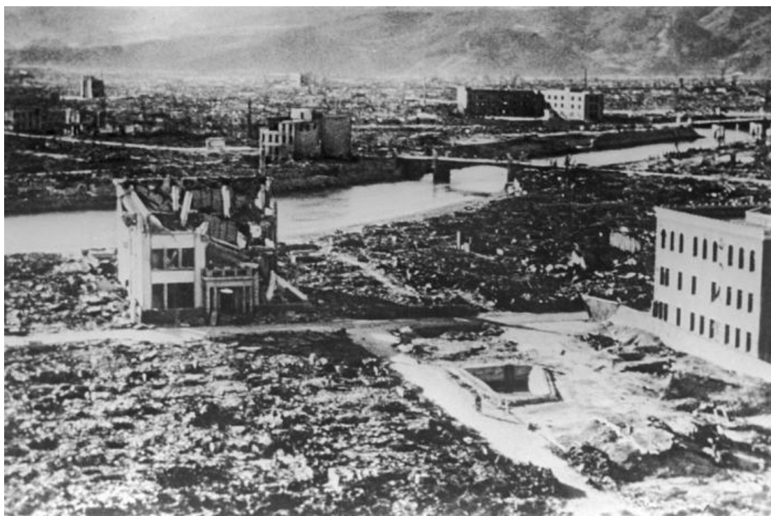
Хиросима после американской атомной бомбардировки

Эти слова станут для Александра Абдулова пророческими: его действительно похоронят на Ваганьковском... Спустя всего год.