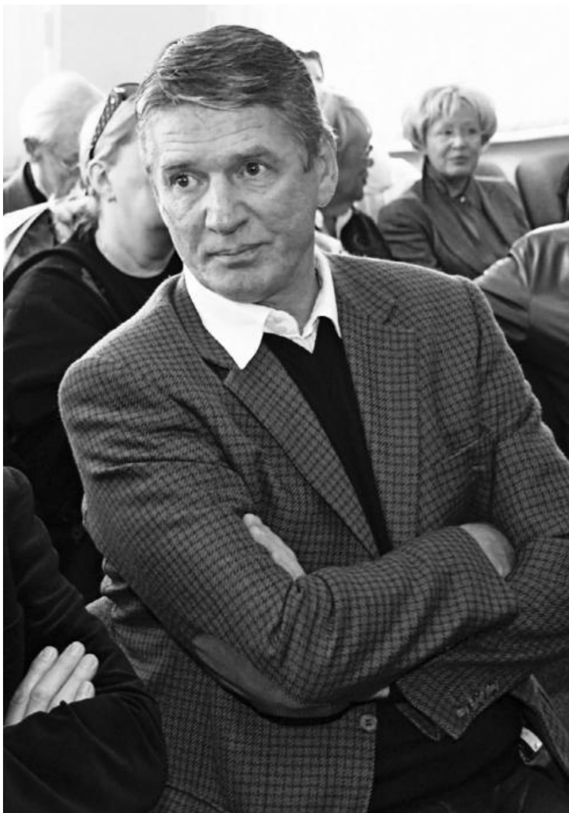
Заслуженный артист РСФСР – Александр Абдулов

«Ну, что окостенели? Кто тут, в конце концов, помер: вы или я? Ну что, ребята, я с вами. Наливаем, выпиваем, закусываем – как обычно, чтобы между первой и второй пуля не пролетела. Все путем, путем. Я так хочу, чтобы вы сегодня как следует напились... Я даже благодарен этой проклятой болячке: узнал, чего вы стоите. Не-не! Я глупость сейчас сказал: