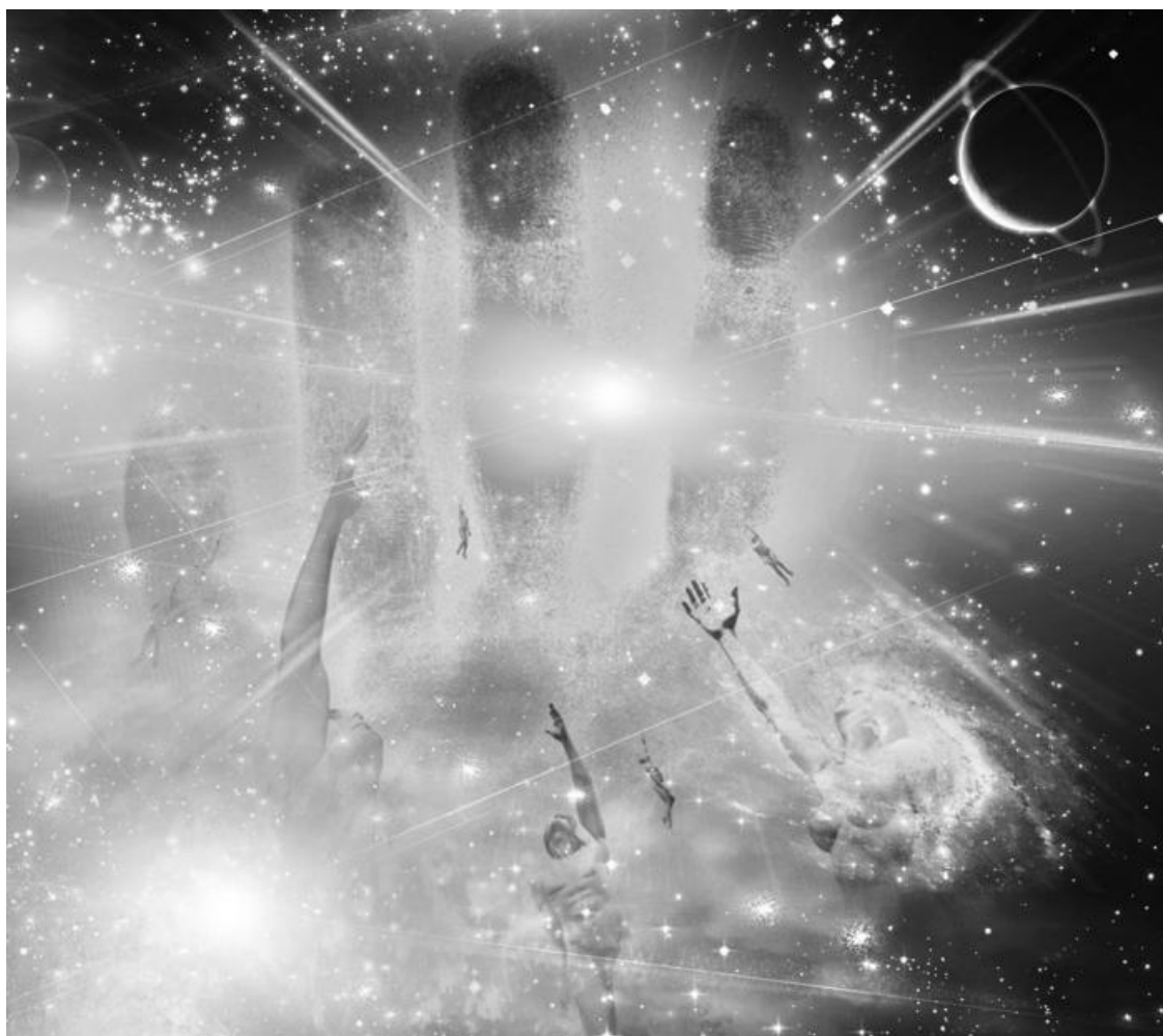
Вселенная – информационное поле

Но тогда почему доступ к этому полю имеют только избранные люди? Чем они отличаются от всех остальных? И самое главное – у кого открывается этот дар? Почему обычный сантехник или даже политик не может предсказать будущее человечества или хотя бы собственную дальнейшую жизнь? Некоторые исследователи уверены, что способностью видеть будущее могут обладать только те люди, которые умеют «настраивать» свой мозг и мышление на одну частоту с информационным полем нашей Вселенной.