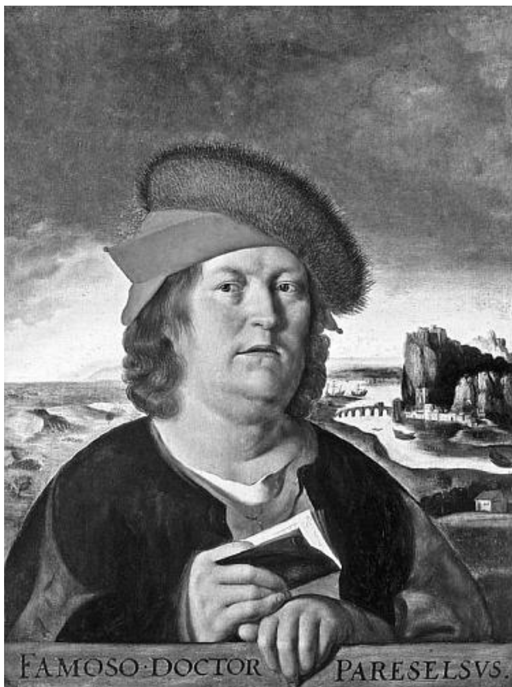
Парацельс кисти художника Квентина Массейса