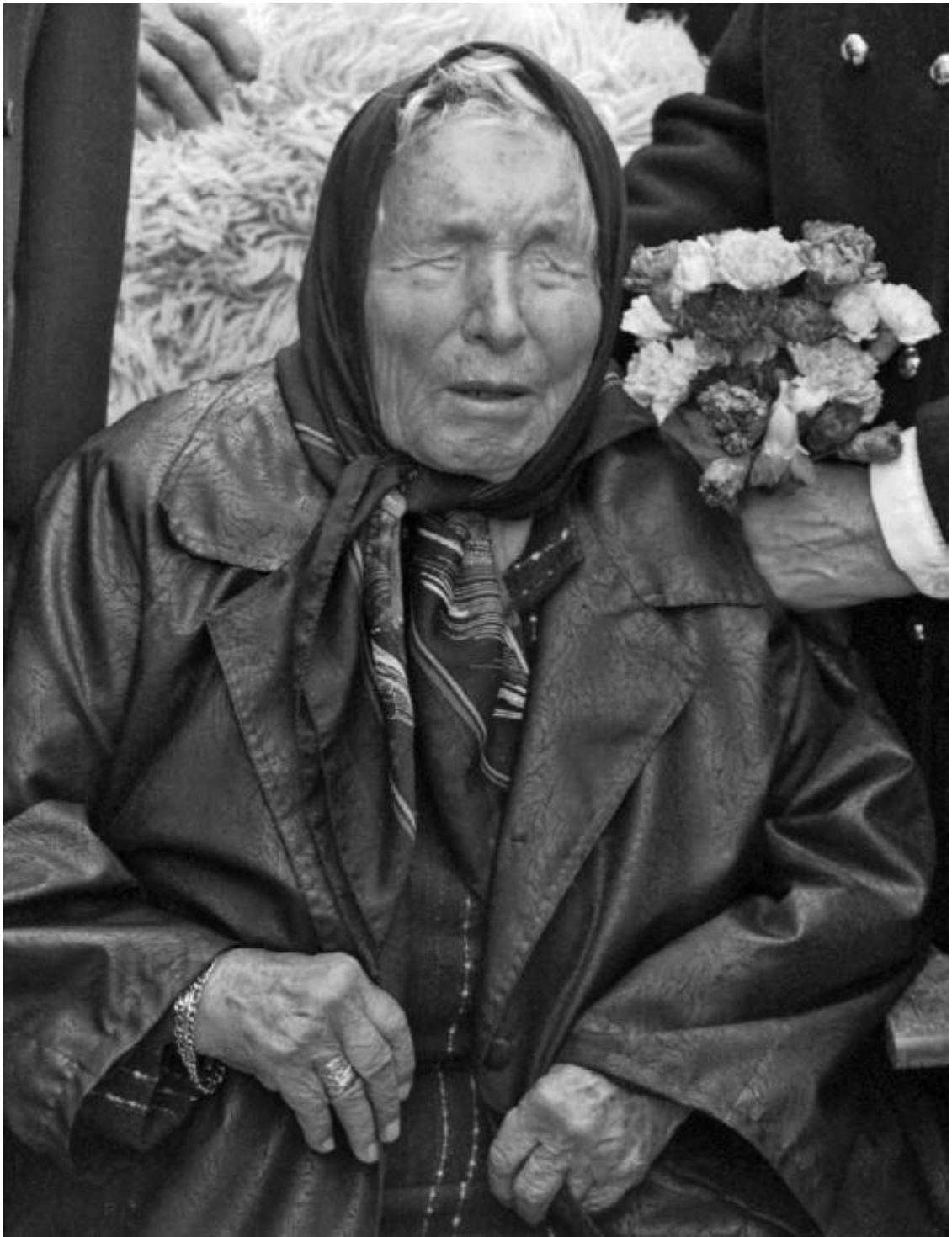
Болгарская предсказательница Ванга

А вот болгарская ясновидящая Ванга утверждала, что человечество погибнет не от землетрясений, а от всемирного потопа. По ее прогнозам, случится это примерно в 2378 году: «Все живое с лица земли смоев вода, и огромная звезда Солнце 3 года будет мертва» .