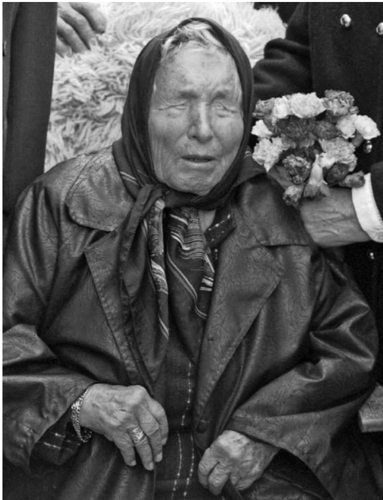
Болгарская предсказательница Ванга