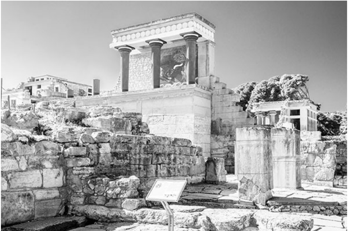
Старые стены Кносса возле Ираклиона