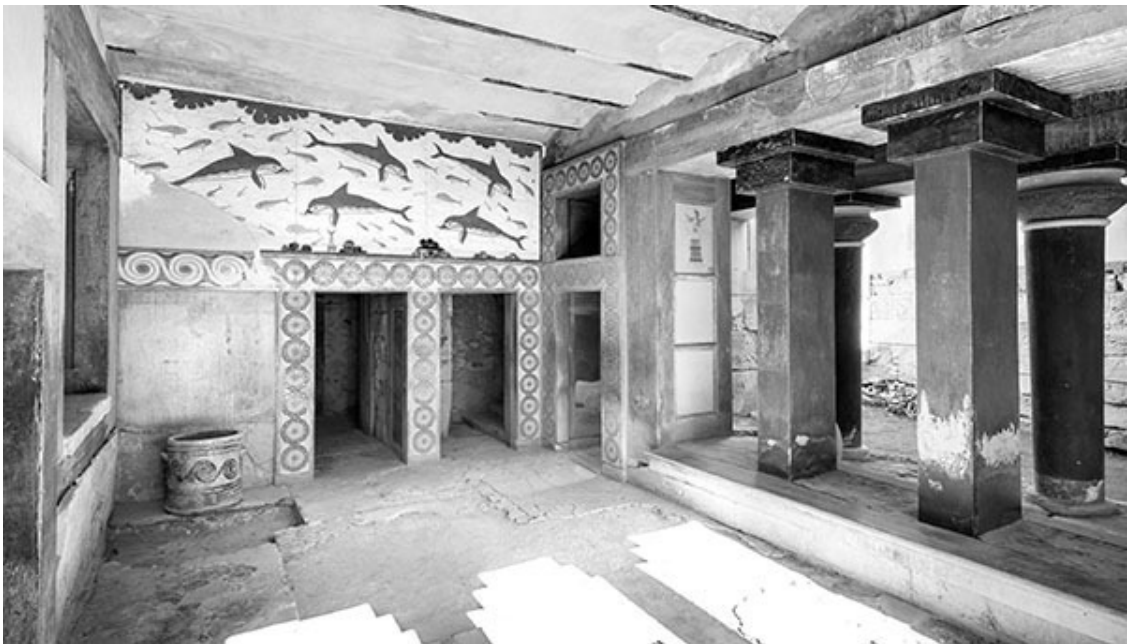
Реконструкция фресок кносского дворца.

Страшный Минотавр, согласно легенде, был убит Тесеем, сыном царевны Эфры от двух отцов – земного (царя Афин Эгея) и божественного (морского бога Посейдона). Этот герой, явившись на Крит в числе очередных четырнадцати жертв, убил Минотавра ударами кулака (по другим сведениям – мечом) и при помощи Ариадны (единоутробной сестры Минотавра – дочери Миноса и Пасифаи), давшей ему клубок ниток, благополучно вышел из Лабиринта.