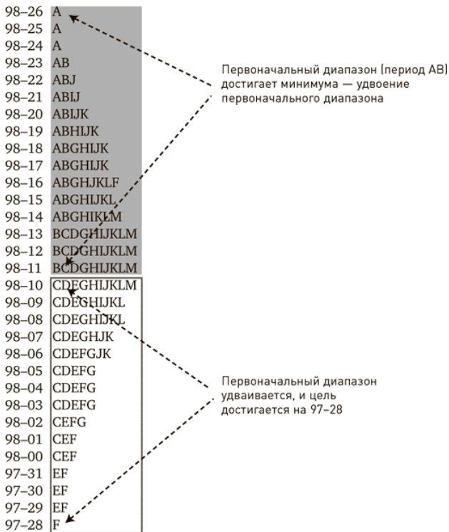
Рис. В. 2. Расчет расширения диапазона

Благодаря правилам, я начал становиться трейдером, открывающим сделку потому, что на то есть причина , а не трейдером, торгующим просто потому, что цена движется вверх или вниз. Я также узнал, что если у меня есть причина