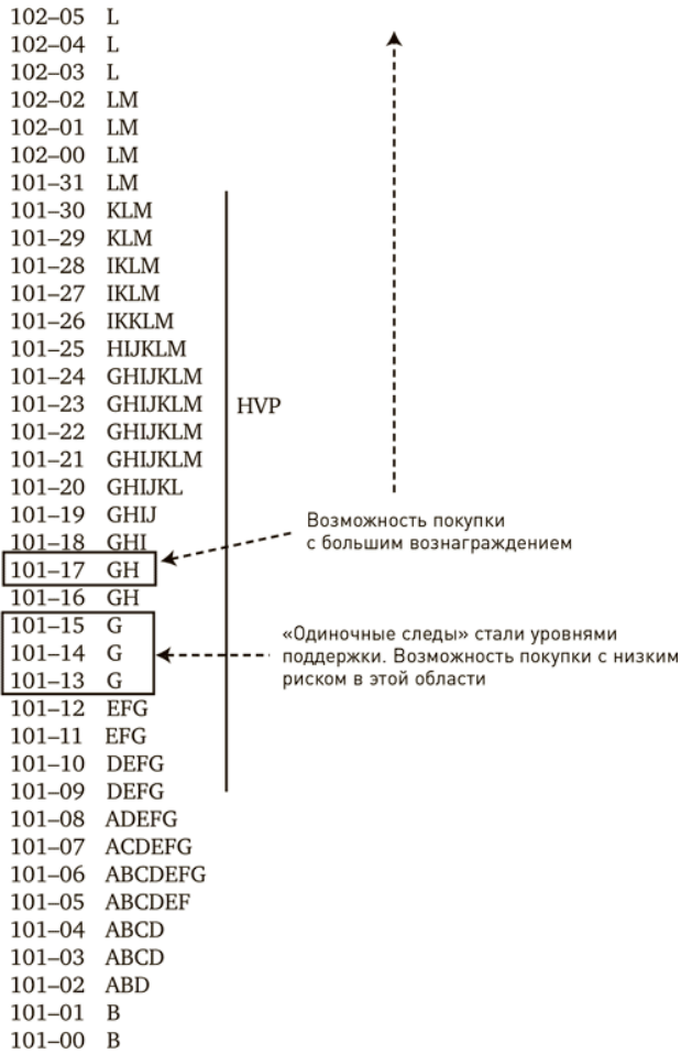
Рис. В. 4. День с двойным распределением