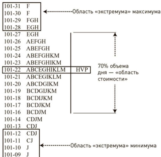
Рис. В. 1. День с нормальным распределением

Типы трейдеров. Во время торговых дней с нормальным распределением средний трейдер торгует в основном примерно в середине области стоимости, немного выигрывая и немного проигрывая – как правило, работая в ноль. Мой наставник как-то назвал таковых трейдерами «из дядюшкиной фирмы». Он объяснил это тем, что их нельзя уволить из-за кровного родства. Однако это же родство является причиной, по которой они не могут расти в должности внутри фирмы.