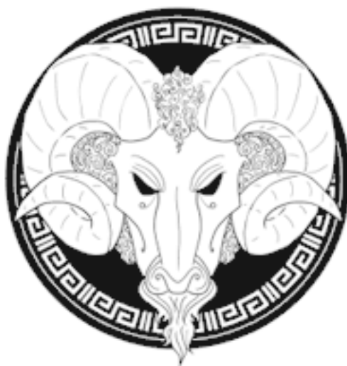
ДОМ ЯСОНА Эмблема: баран