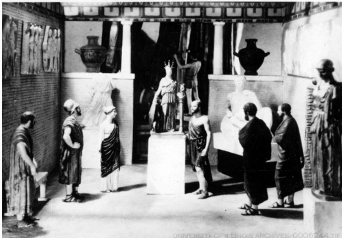
Фидий демонстрирует модель своей величественной статуи Афины 4

Они спрашивали о пропорциях различных статуй, о том, в каком порядке нужно было разместить скульптуры, о мраморе для фронтонов и о множестве других мелочей. Пантарк слушал разговоры о ходе работ, и со временем Парфенон начал будоражить его воображение почти так же сильно, как сам он все еще будоражил воображение Фидия. Пантарк понял, что должен своими глазами увидеть это грандиозное здание и величественную статую Афины, из-за которой его учитель едва не погиб. Его мучило любопытство: какими вышли все те многочисленные мелочи, о которых он столько слышал?