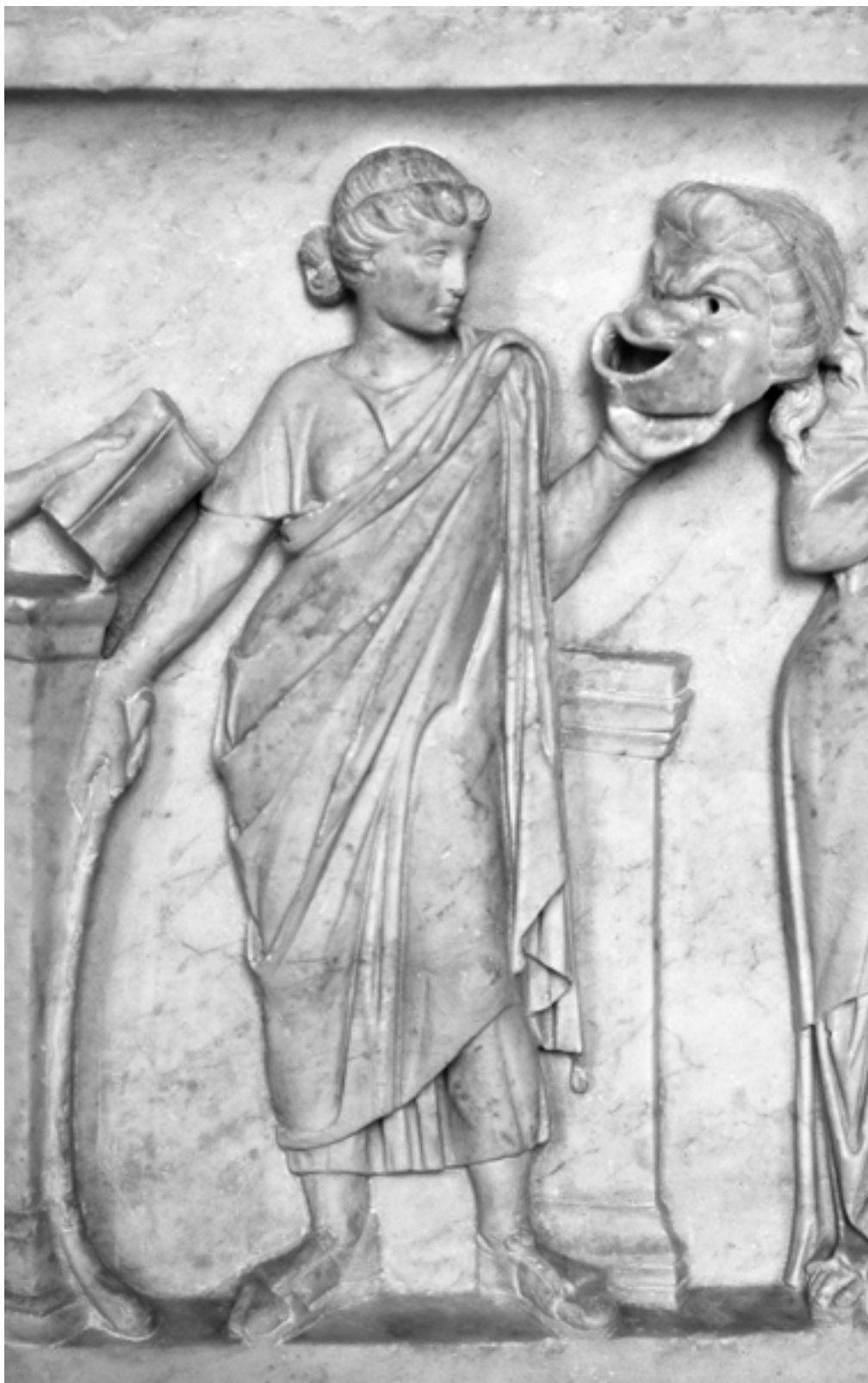
Талия, муза комедии, держит комическую маску 11