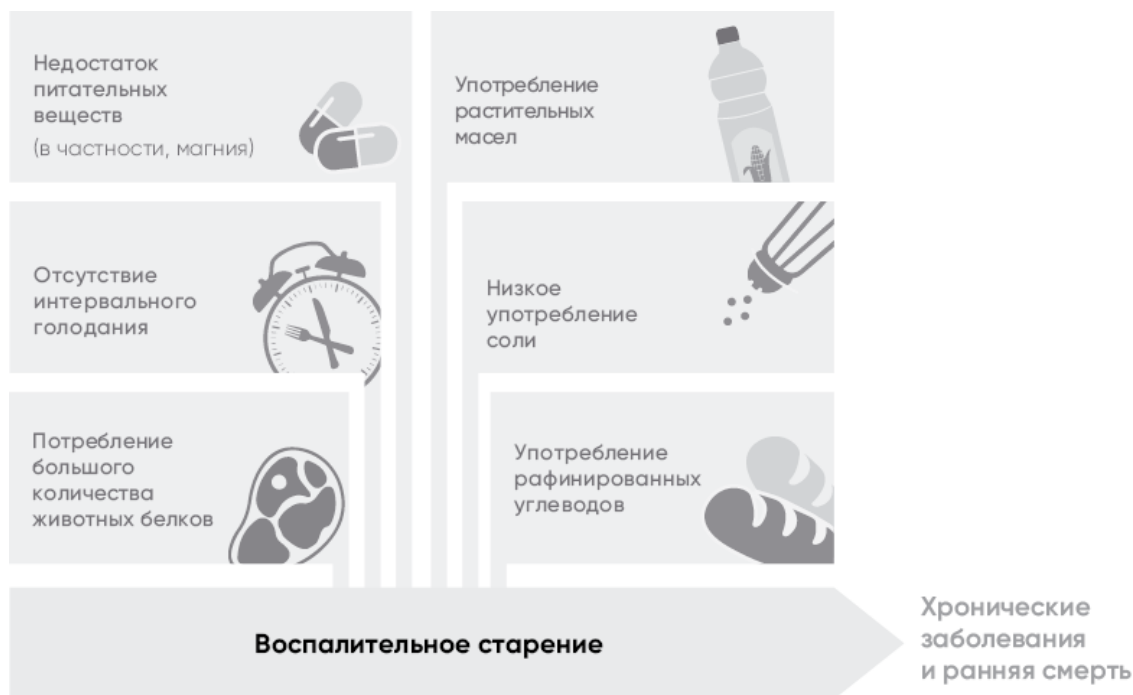
Рис. 1.1. Причины воспалительного старения

Старение – это медленное накопление клеточных повреждений, которое вызвано снижающейся способностью к восстановлению. Результатом становится низкий уровень воспаления, который настолько характерен для старения, что в английском языке придумали даже специальный термин inflammaging («воспалительное старение»). Окислительный стресс, состояние, при котором свободные радикалы (высокореактивные молекулы с неспаренным электроном) заглушают внутреннюю антиоксидантную защиту организма, увеличивается с возрастом. Однако вы можете изменить образ жизни, повысив вероятность здорового старения. Вы увеличите не просто продолжительность жизни, но и продолжительность здоровой жизни. Никто не хочет провести последние годы слабым и больным, в доме престарелых. Профилактика старения даст вам больше лет здоровой жизни, свободы от болезней и других проблем пожилого возраста, здоровья, энергичности и радости жизни. Настоящее долголетие – это продление молодости, а не старости.