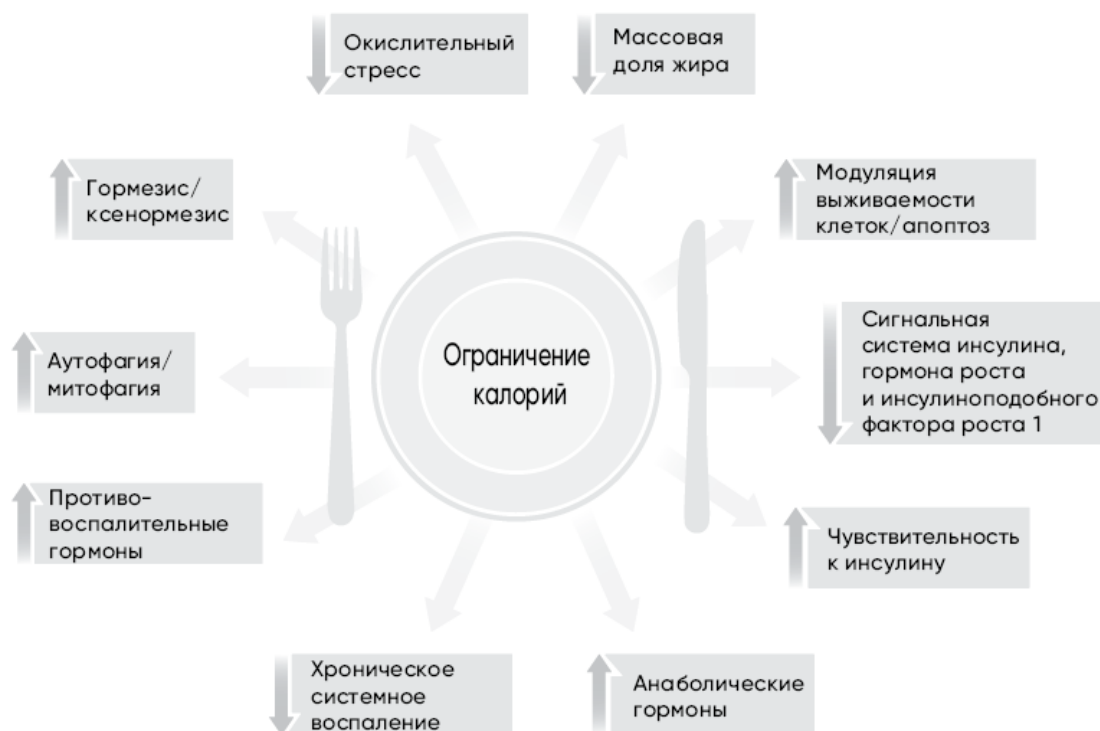
Рис. 2.1. Эффект от ограничения калорий

Перенося эту идею на людей, Росс в 1959 г. писал, что коронарная недостаточность не наблюдается в обществах, страдающих от недоедания [6]. Иными словами, люди, которые едят мало калорий, меньше страдают болезнями сердца. Кроме того, ученые в тот период нашли более слабый эффект от ограничения белковой пищи: высокое содержание в рационе крыс казеина (одного из пищевых белков) уменьшает продолжительность жизни [7].