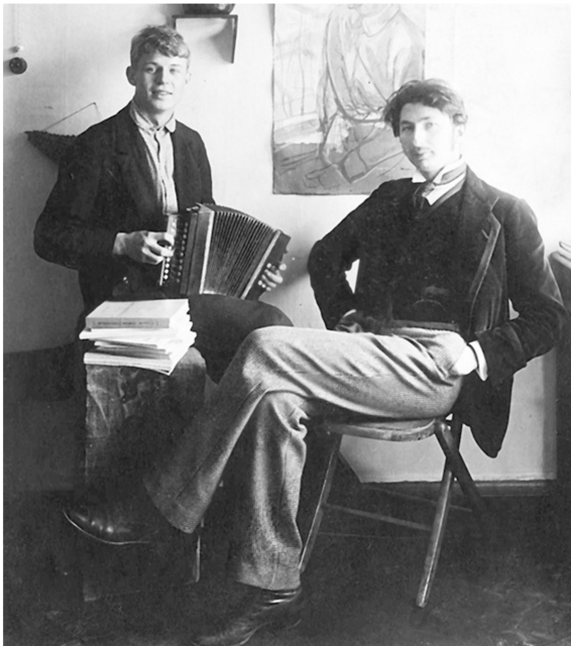
С. Есенин и С. Городецкий