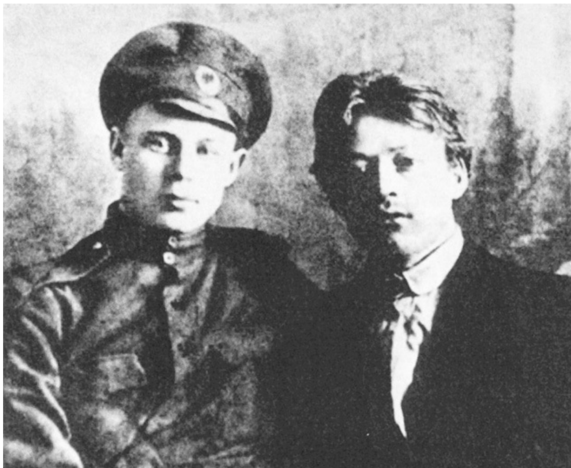
С. Есенин и А. Ганин

Сначала я думал, они пьяны, но после первых же слов убедился, что возбуждение это носит иной характер. Первым ко мне подошёл Орешин. Лицо его было тёмным и злобным. Я его никогда таким не видел.