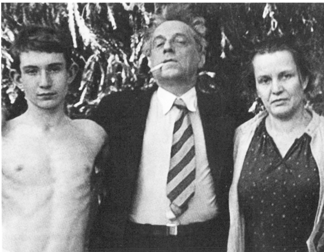
Вс. Мейерхольд с Костей Есениным и матерью З. Райх

Хотя и кривы, и темны были тогда московские переулки, но тайну великого режиссёра и его ученицы сохранить не смогли. Есенин буквально взбеленился. Но что он мог сделать? Сам написал заявление на развод. Сам захотел свободы, хотя имел её пудами. Недовольство собой и Зиной выразил в довольно вульгарных частушках: