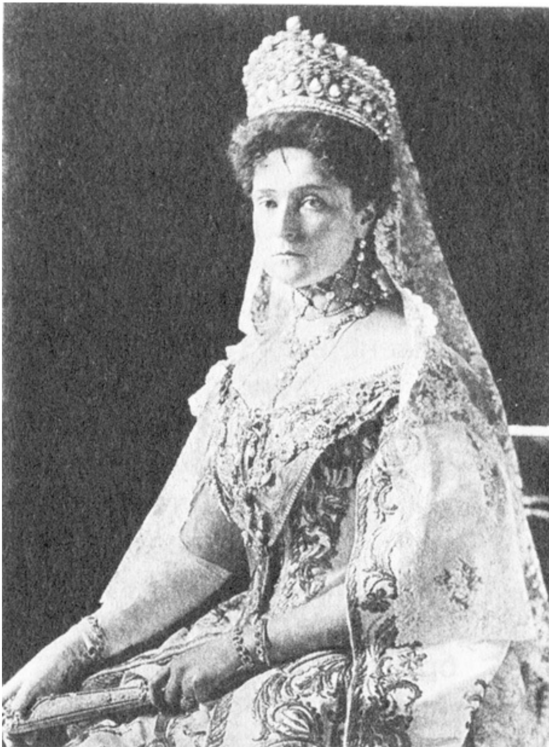
Императрица Александра Фёдоровна

хают: «Ах, это всё о народе, о великом нашем мученике-страдалце». И платочек из сумочки вынимают. Такое меня зло взяло. Думаю – что вы в этом народе понимаете!