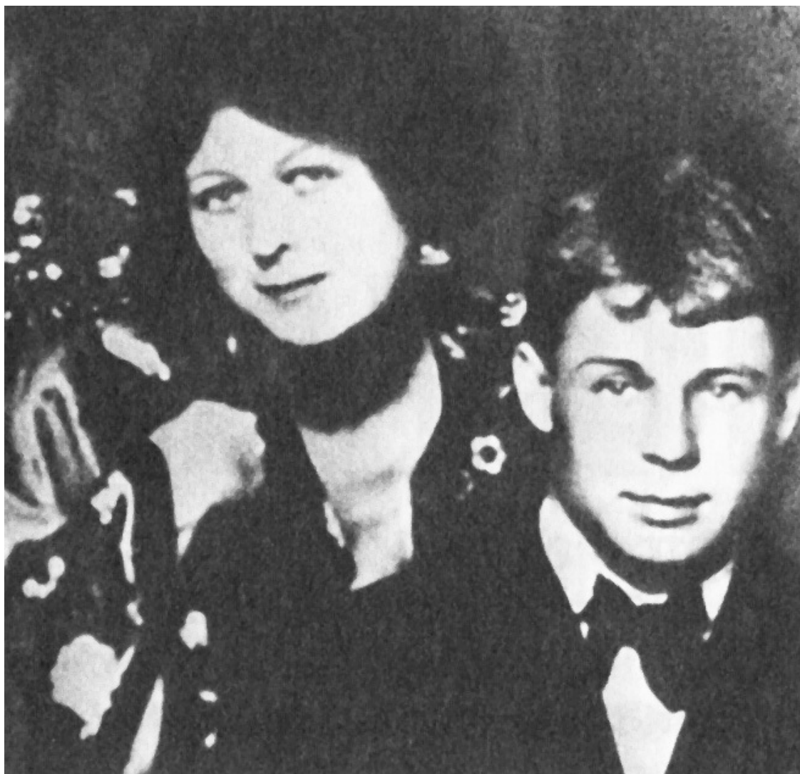
С. Есенин и З. Райх, июль 1917 г.

Мысль автора статьи подтверждалась стихотворением Есенина «Плясунья»: ...Для этого переломного времени (рубеж 1917–1918 годов) характерно стремление Есенина сблизиться, войти в контакт с людьми, близкими к власти, узнать от них что-то о новых вершителях судеб народов. П.А. Кузько рассказывал о них Сергею Александровичу, и тот с жадностью ловил каждое его слово.