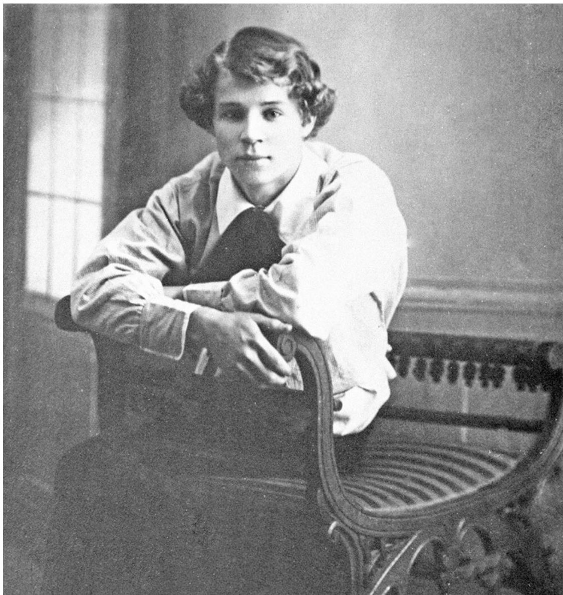
С. Есенин, 1914 г.