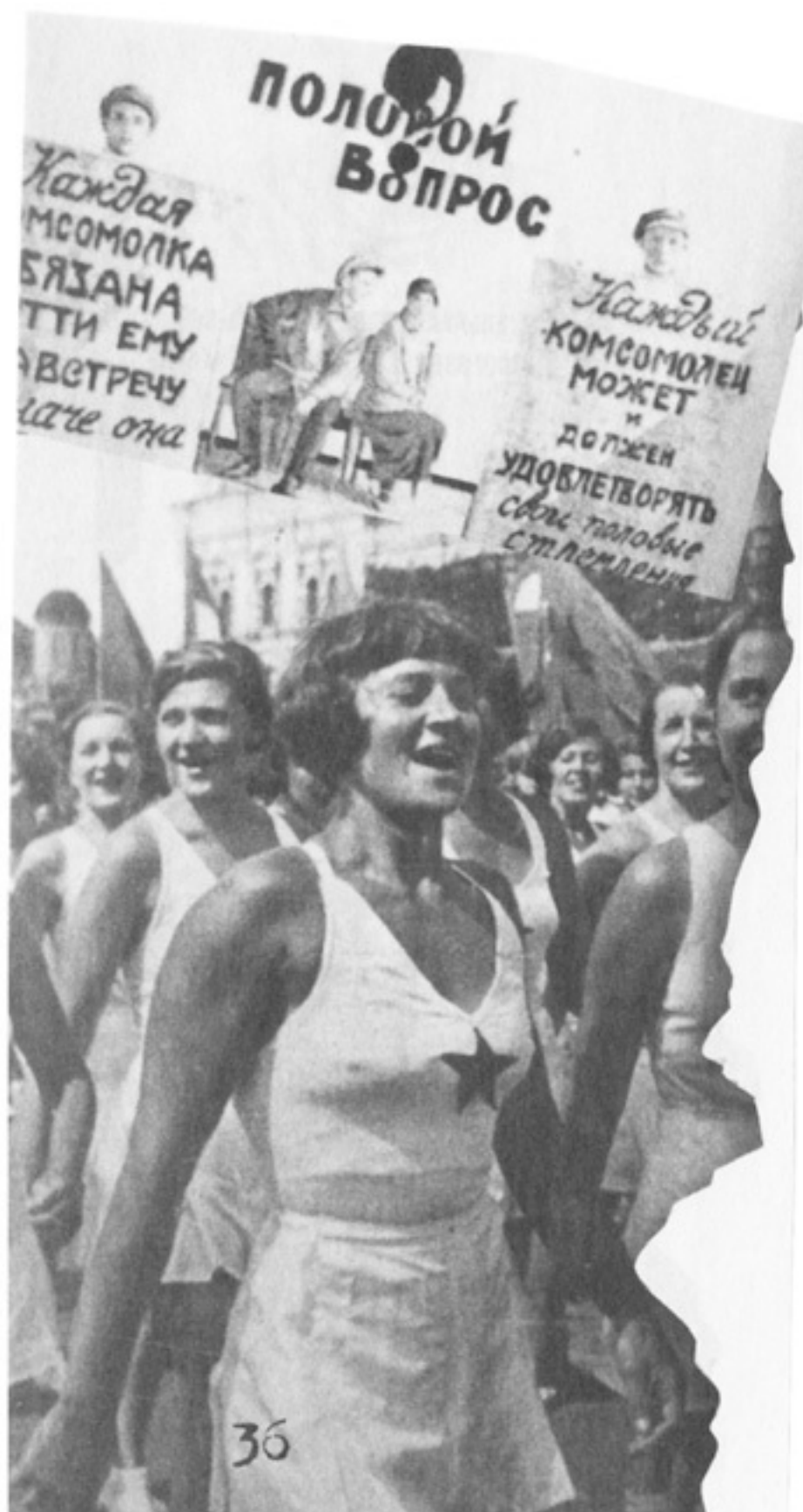
Афиша 1918 года