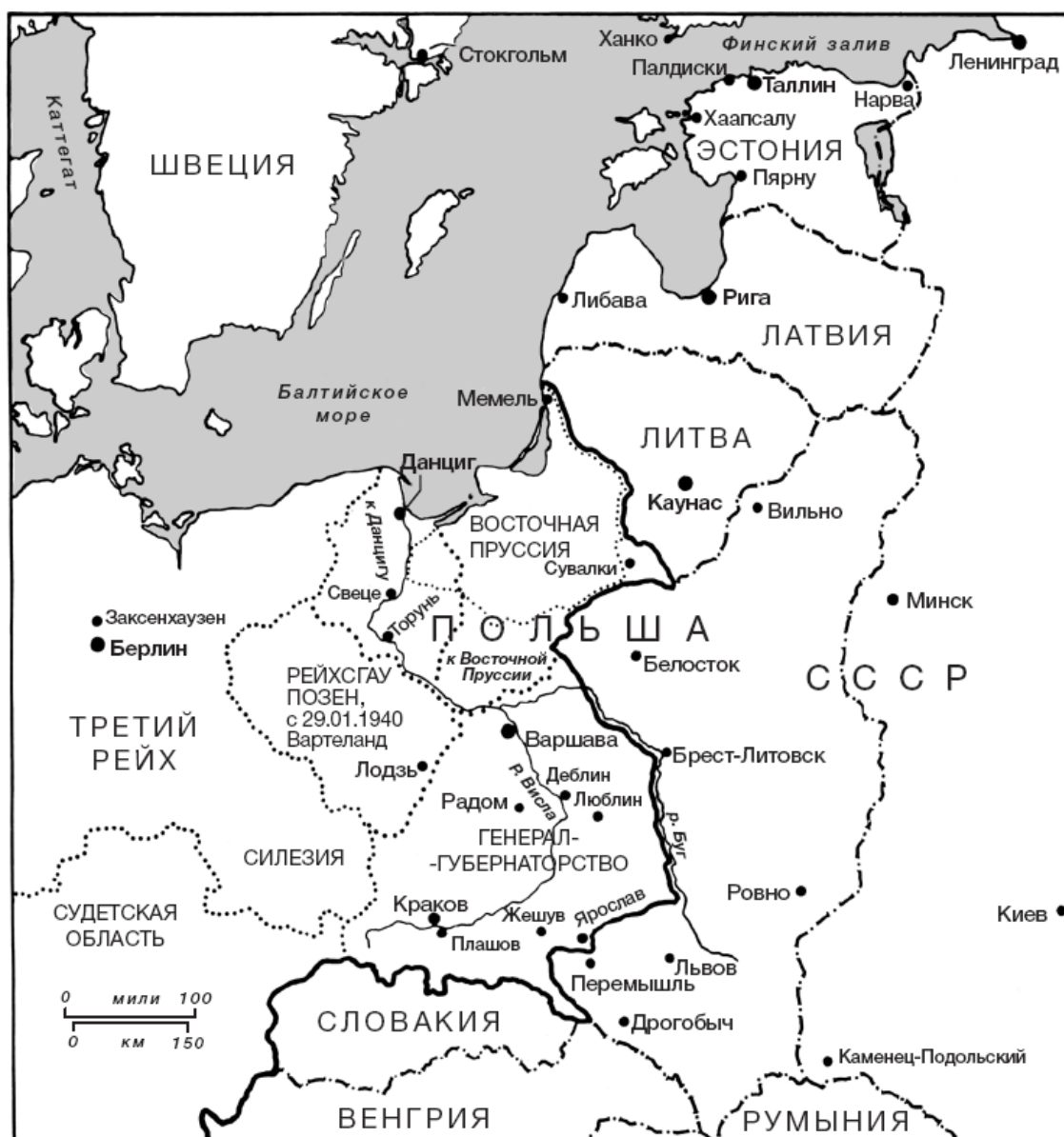
Раздел Польши, октябрь 1939 г.

Та же директива от 30 сентября увеличивала и масштабы немецкой активности на Западе. «Войну на море», приказал Гитлер, надлежало проводить «против Франции в той же мере, что и против Англии». С этого времени транспортные и торговые суда, «несомненно определенные как враждебные», допускалось атаковать без предупреждения. Это положение распространялось и на суда, плывущие без огней в британских территориальных водах. Кроме того, торговые суда, которые использовали радио, будучи остановленными, также следовало топить. Атаки на такие коммерческие суда, заметил Генштаб немецкого флота в тот день, «в журнале боевых действий следует объяснять путаницей с военным кораблем или вспомогательным крейсером».