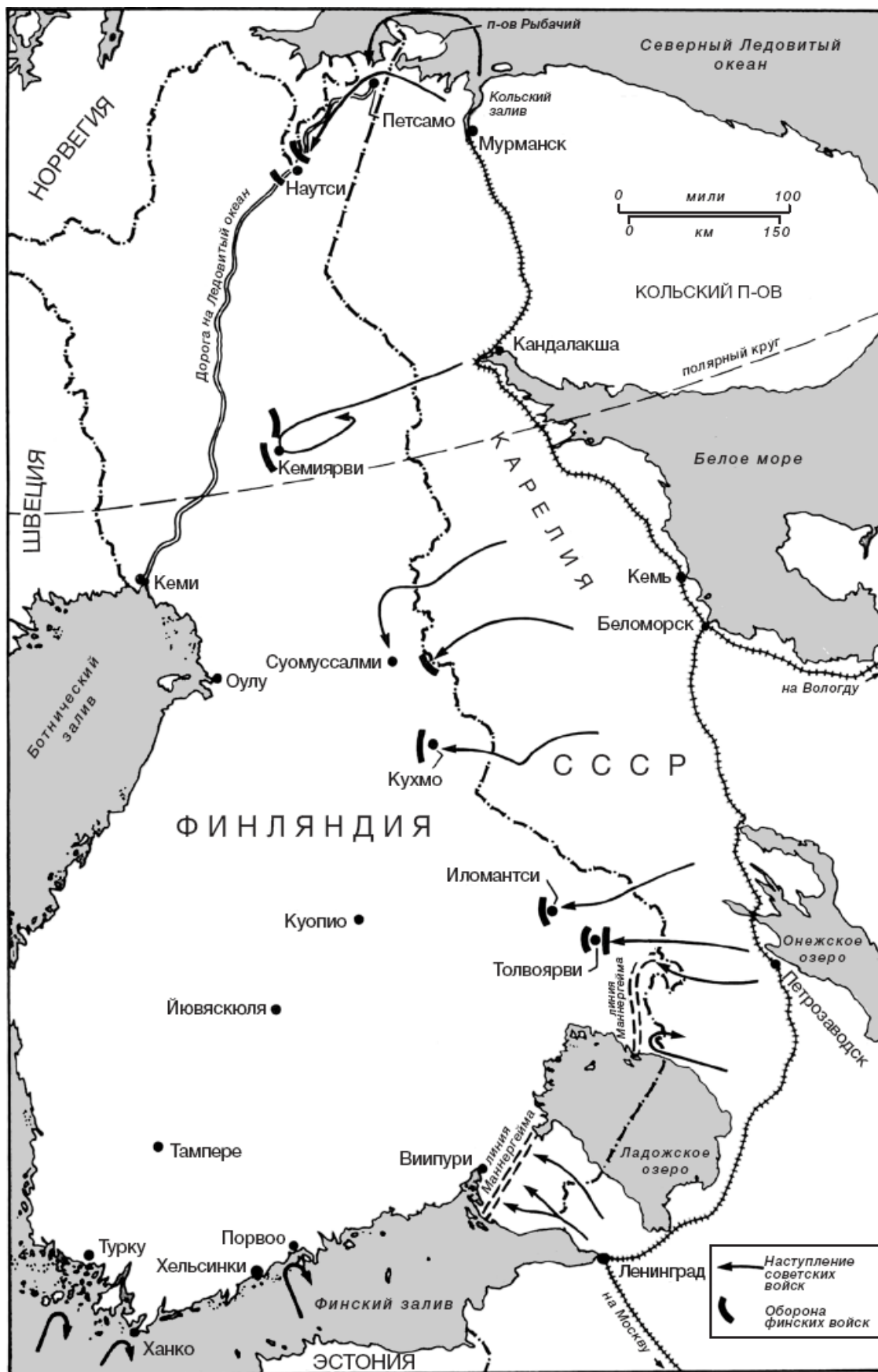
Советско-финская война, 30 ноября 1939 – март 1940 г.