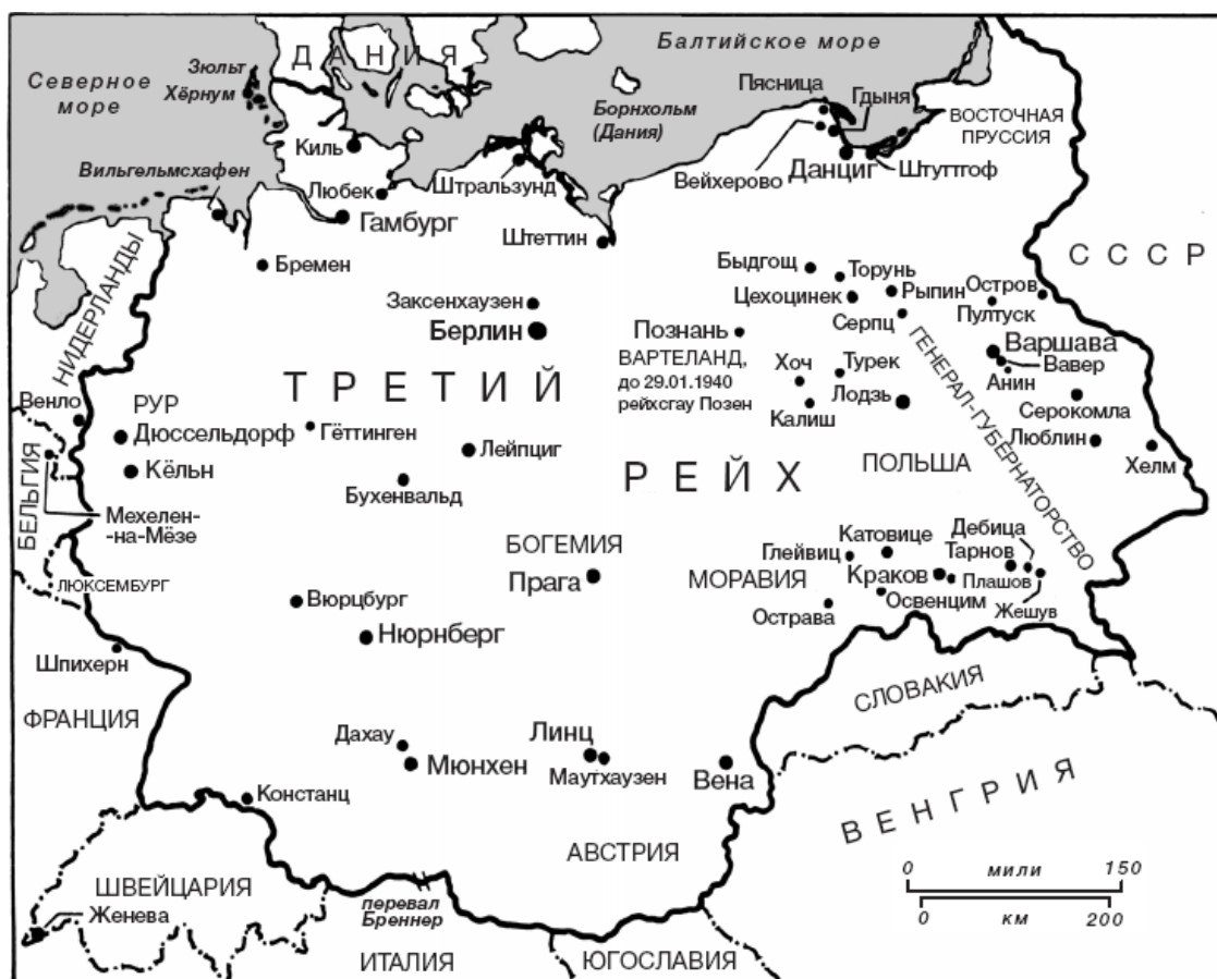
Третий рейх, ноябрь 1939 г.

«Это требует действий», – отозвался Рузвельт. Десять дней спустя в Вашингтоне состоялась первая встреча совещательного комитета по урану. Америка активно искала новую силу. Эйнштейн, которому как еврею пришлось бежать из Германии в 1933 г., указал путь к разработке революционного оружия войны, но на его создание уйдет более пяти лет. Тем временем ощущалась разрушительная сила имевшегося оружия. Вечером 13 октября немецкая субмарина U-47 под командованием Гюнтера Приена проникла через британскую оборону в заливе Скапа-Флоу, а утром 14 октября тремя торпедами потопила боевой корабль «Роял Оук», стоявший на якоре; 833 моряка утонули.