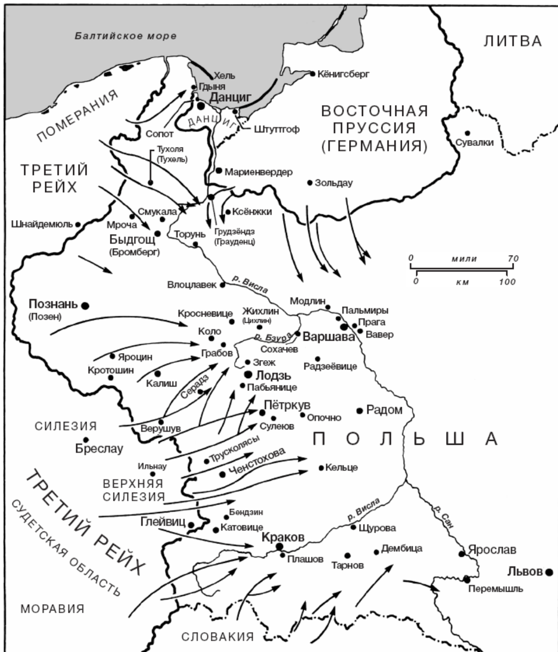
Вторжение Германии в Польшу, сентябрь 1939 г.

Через 24 часа после нападения Германии на Польшу официальное коммюнике польского правительства сообщало, что в воздушных рейдах на Варшаву, Гданьск и несколько других городов погибло 130 поляков. «Были сбиты два немецких бомбардировщика и задержаны четыре удивительным образом спасшихся оккупанта, – сообщало коммюнике, – когда в пятницу вечером над восточной частью Варшавы появился строй из 42 немецких самолетов. Люди наблюдали за захватывающим воздушным боем над центром города. Несколько зданий охватила пожар, был разбомблен и рухнул госпиталь для умственно отсталых еврейских детей».