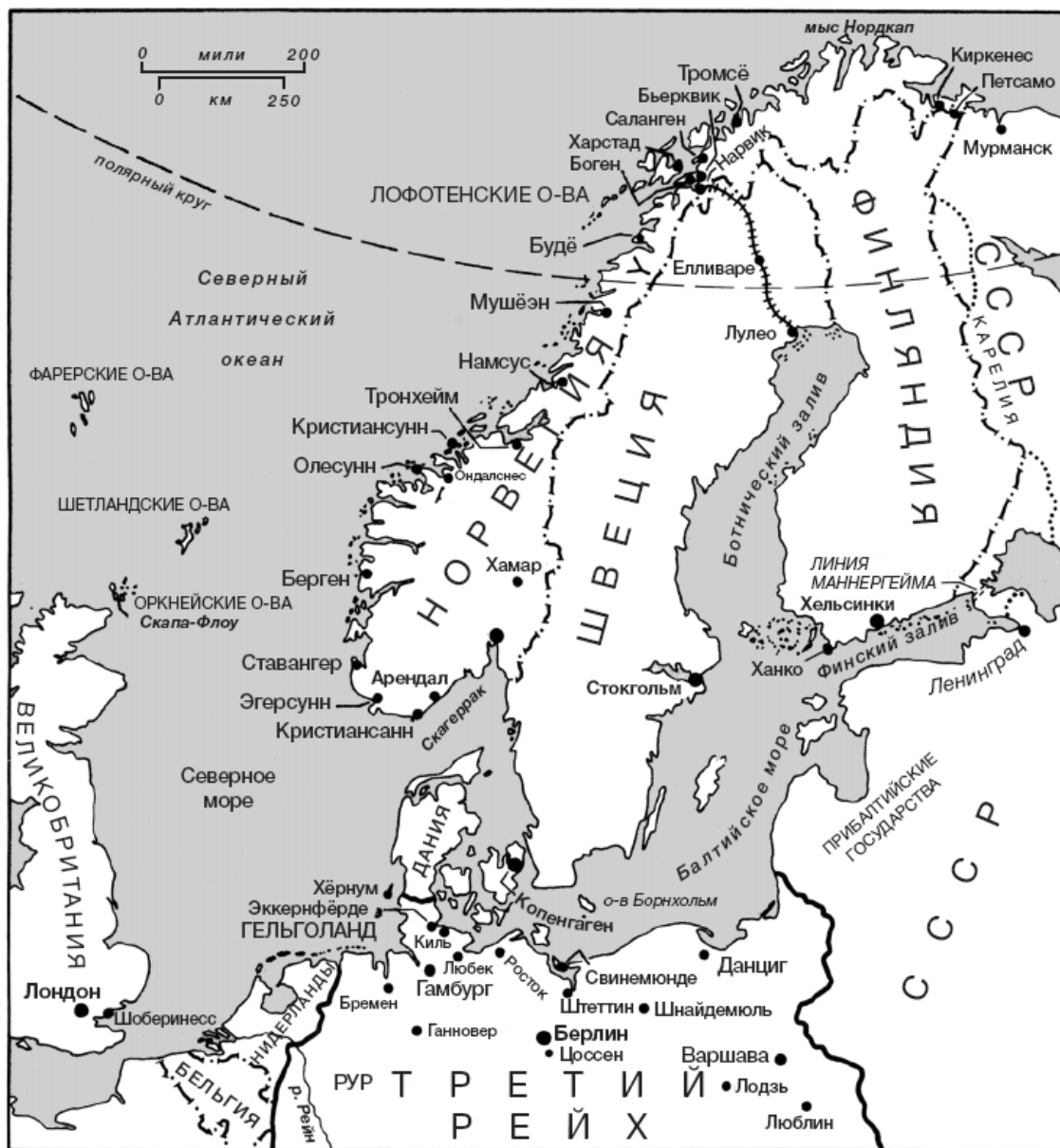
Скандинавия в 1940 г.