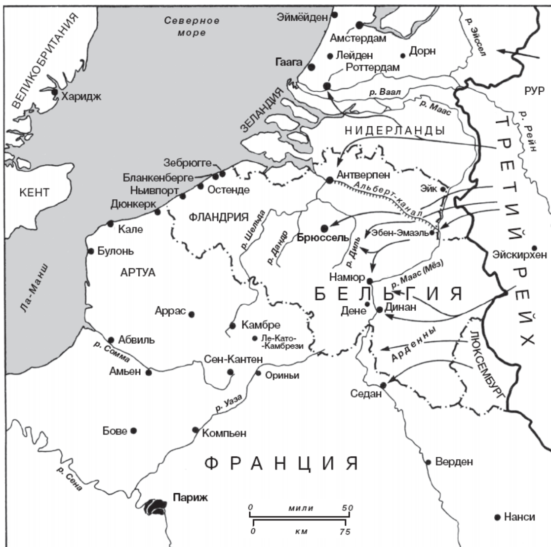
Германское вторжение в Западной Европе в мае 1940 г.

13 мая войска Роммеля, наступавшие в Бельгии, пересекли Маас у Динана. В тот же день южнее войска генерала Гудериана пробились через Арденнский лес и пересекли Маас у Седана: впервые серьезные силы немцев пересекли французскую границу. Тем утром короля Георга VI разбудил в Букингемском дворце в пять часов утра полицейский сержант, который сообщил, что с ним хочет поговорить нидерландская королева Вильгельмина. «Я ему не поверил, — записал король в дневнике, — но подошел к телефону, и это была она. Она умоляла меня отправить самолеты на защиту Голландии. Я передал это сообщение всем соответствующим лицам и вернулся в кровать». Король заметил: «Нечасто кто-то звонит в такой час, особенно королева. Но в эти дни может случиться что угодно, и бывают вещи куда хуже».