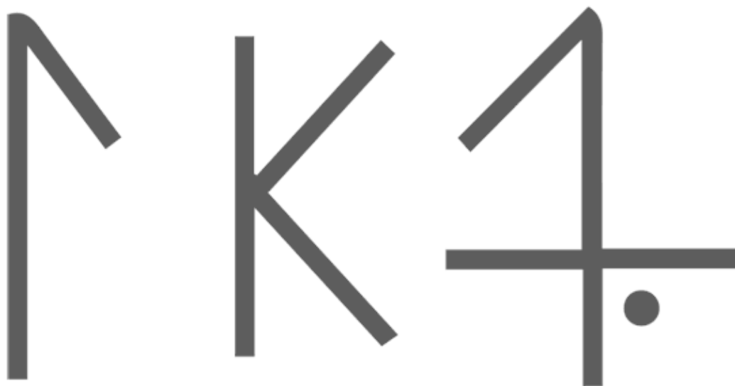
Рис. 3. Став «Лунная вода»

Стангинн Тир – символизирует излечение, восстановление эфирного поля, физического и психологического состояния.