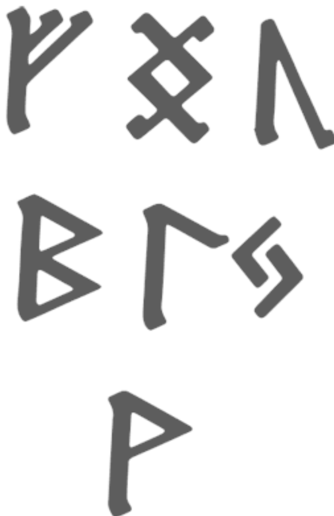
Рис. 4. Став для роста и укрепления волос

Руны рисуем на расческе сверху вниз в три ряда. Постарайтесь найти расческу или гребешок из дерева – это будет самое то. Отличный вариант, если деревом окажется ива. Такие вещицы сейчас можно найти на рынках или ярмарках мастеров. Но если не получится, используйте обычную расческу и любой способ нанесения: маркер, лак и т. д.