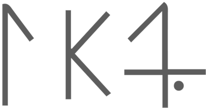
Рис. 3. Став «Лунная вода»

Третье полнолуние, март – грозовая луна. Это время также подходит для очищения, расслабления, отдыха и восстановления сил и энергии. Соответственно, рекомендуется проводить и ритуалы, связанные с энергией, силой, здоровьем, на исцеление, восстановление после болезней, обновление энергии. Займитесь гаданиями и изучением неизведанных мантических систем. Этот период можно использовать для активации достижений, для начала работы над различными целями и проектами, изучения новых практик и эзотерических направлений.