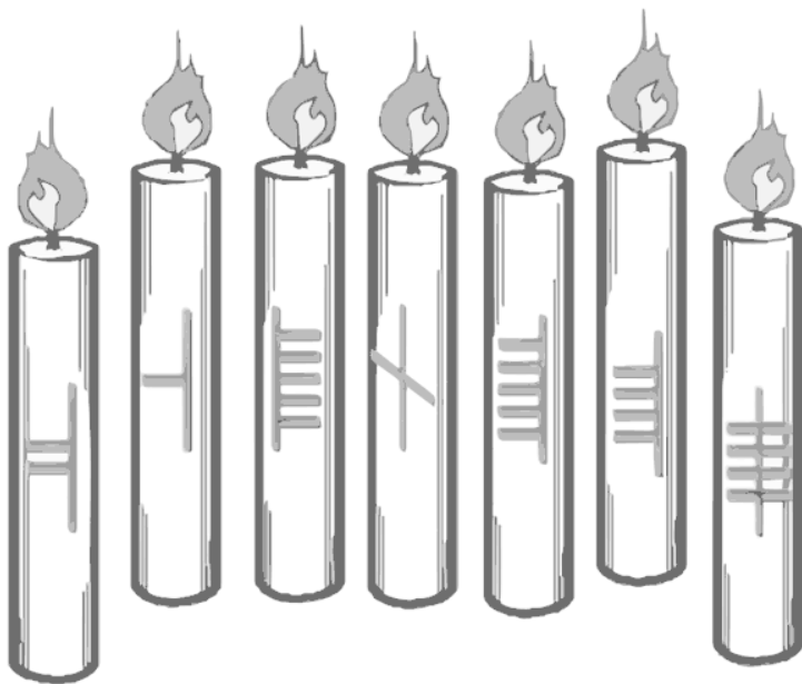
Рис. 2. Феды к ритуалу гармонизации энергетики со свечами и огамом