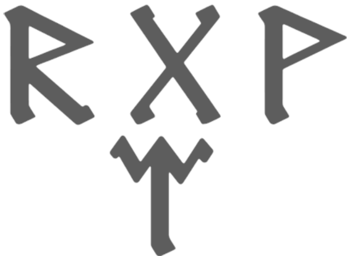
Рис. 5. Став «Исчезни с пользой для себя»

Это время для гадания, медитаций, действий со снами. Работайте над проектами, требующими завершения, и стройте планы на будущее. В этот месяц проводятся ритуалы для общения с духами местности, предками, умершими и сущностями из тонкого мира. Вы можете наладить связь со своим духом-проводником или тотемным животным. Это подходящее время и для того, чтобы отдать дань уважения предкам и попросить их о помощи.