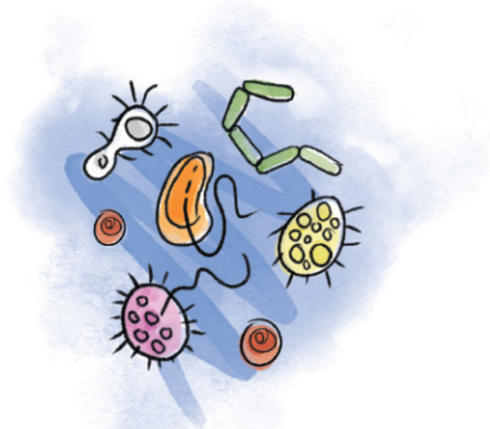
Бактерии и вирусы