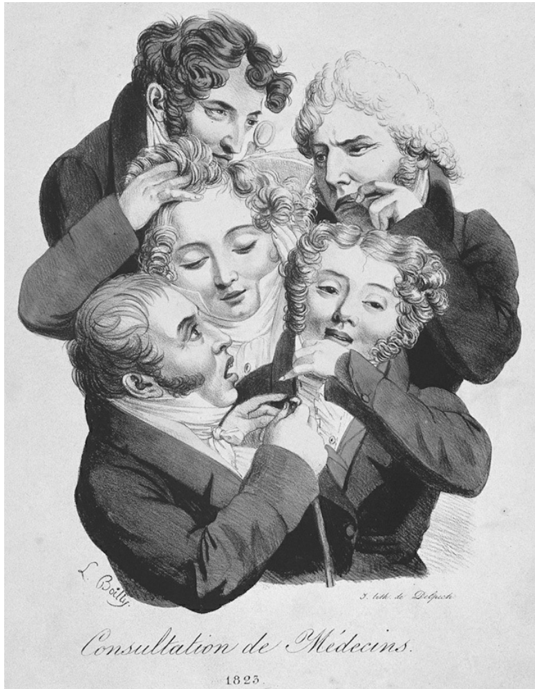
2.1. Группа молодых модных врачей. Литография Ф.-С.