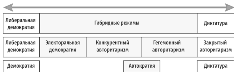
Схема 1: Ось демократия-диктатура с двумя полюсами и серой зоной между ними