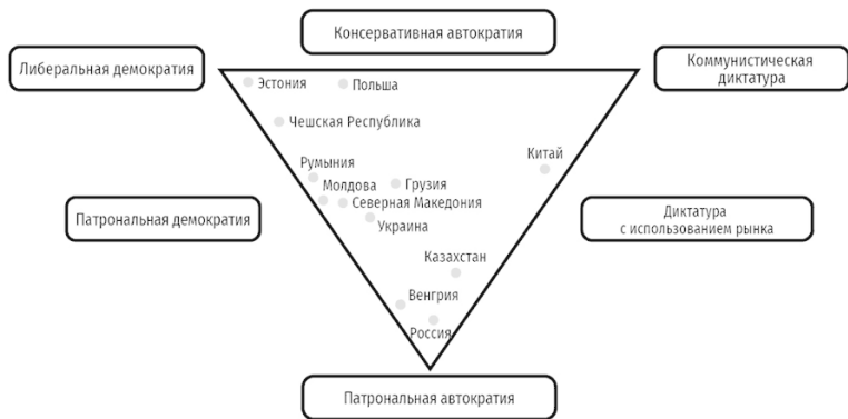
Схема 3: Треугольное концептуальное пространство режимов с 6 идеальными типами и 12 примерами посткоммунистических стран (по состоянию на 2019 год)

Итак, у нас есть шесть идеальных типов, в то же время восемь из двенадцати стран на Схеме 3 находятся либо в кла-