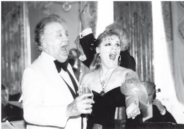
Николай Гедда и я – «Застольная» из «Травиаты»

Бывает, однако, по-разному. Есть изданные у нас воспоминания многих замечательных певцов. Например, Николай Гедда. Или Дитриха Фишера-Дискау – его жена Юлия Варади рассказывала, что на их вилле во Франции он сам тщательно разрабатывал собственное меню и еде уделял, без преувеличения, огромное внимание. Однако Фишер-Дискау был человеком очень своеобразным: он всё время смотрел на себя со стороны. Постоянно! Спрашивая себя: как я это делаю? Как я в этот момент выгляжу? Фишер-Дискау был настоящий педант в профессии. Человек, который знал только