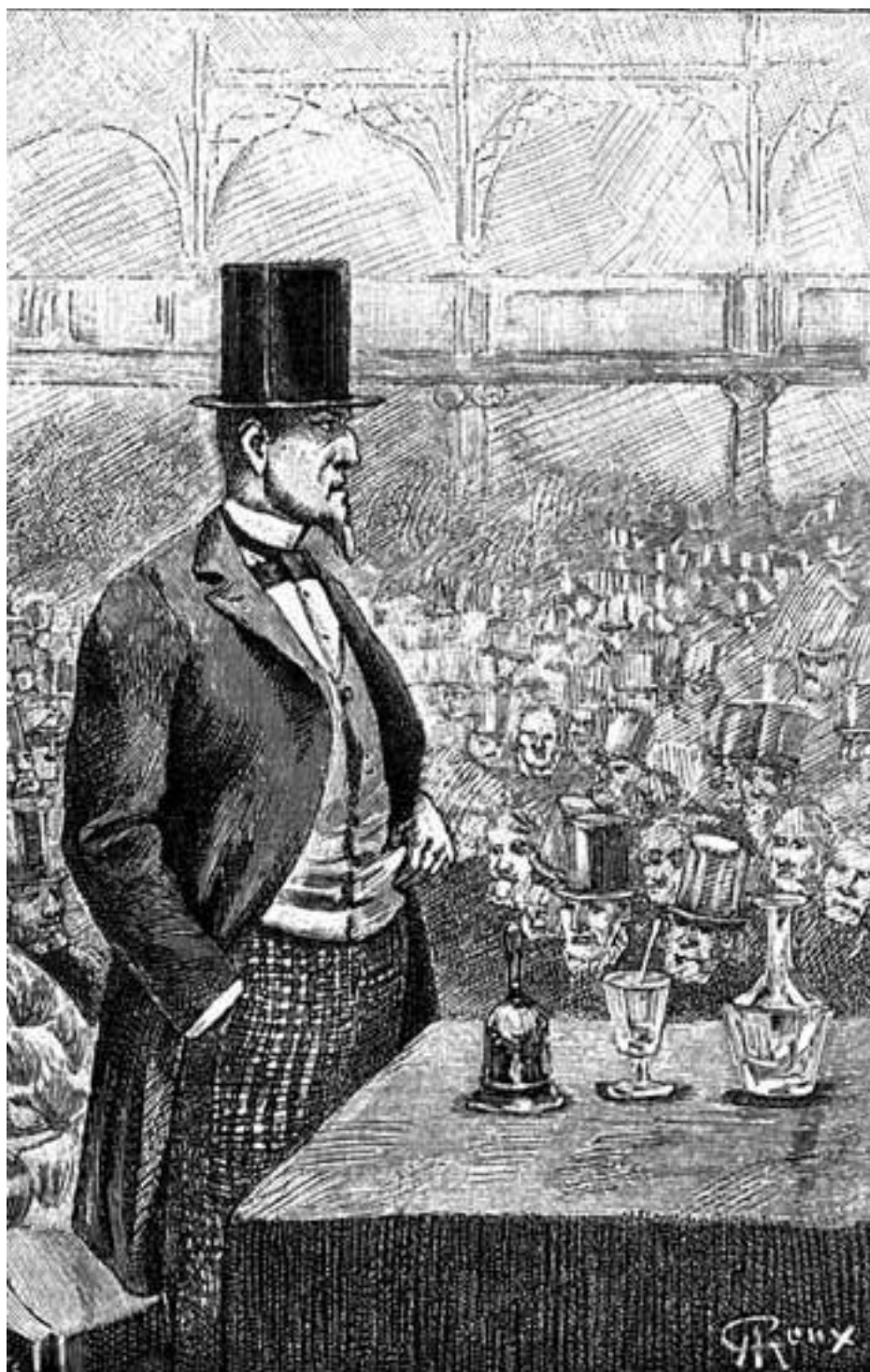
Президент Пушечного клуба Барбикен.

Ах, эти коэффициенты, показатели степени, радикалы и другие знаки алгебраического языка! С какой легкостью они выпархивали из-под его пера или, вернее, из-под мелка, укрепленного в его железном крючке, так как он предпочитал работать на черной доске. Здесь, на пространстве десяти квадратных метров – меньше ему бы не хватило – он с жаром предавался алгебраическим вычислениям. На его доске не было обыкновенных мелких цифр: это были цифры огромные, фантастические, начертанные рукою пылкого гения. Цифры 2 и 3 выступали важно, как бумажные петушки; цифра 7 возвышалась, как виселица, не хватало только пове-