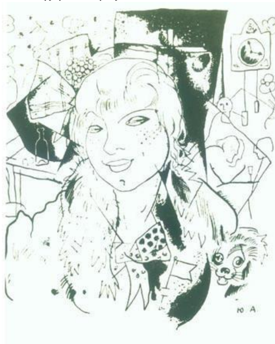
Ю. Анненков. Катька из иллюстрации к «Двенадцати» А. Блока

«Спасибо тебе буржуй за лампу хорошо нам светлила».