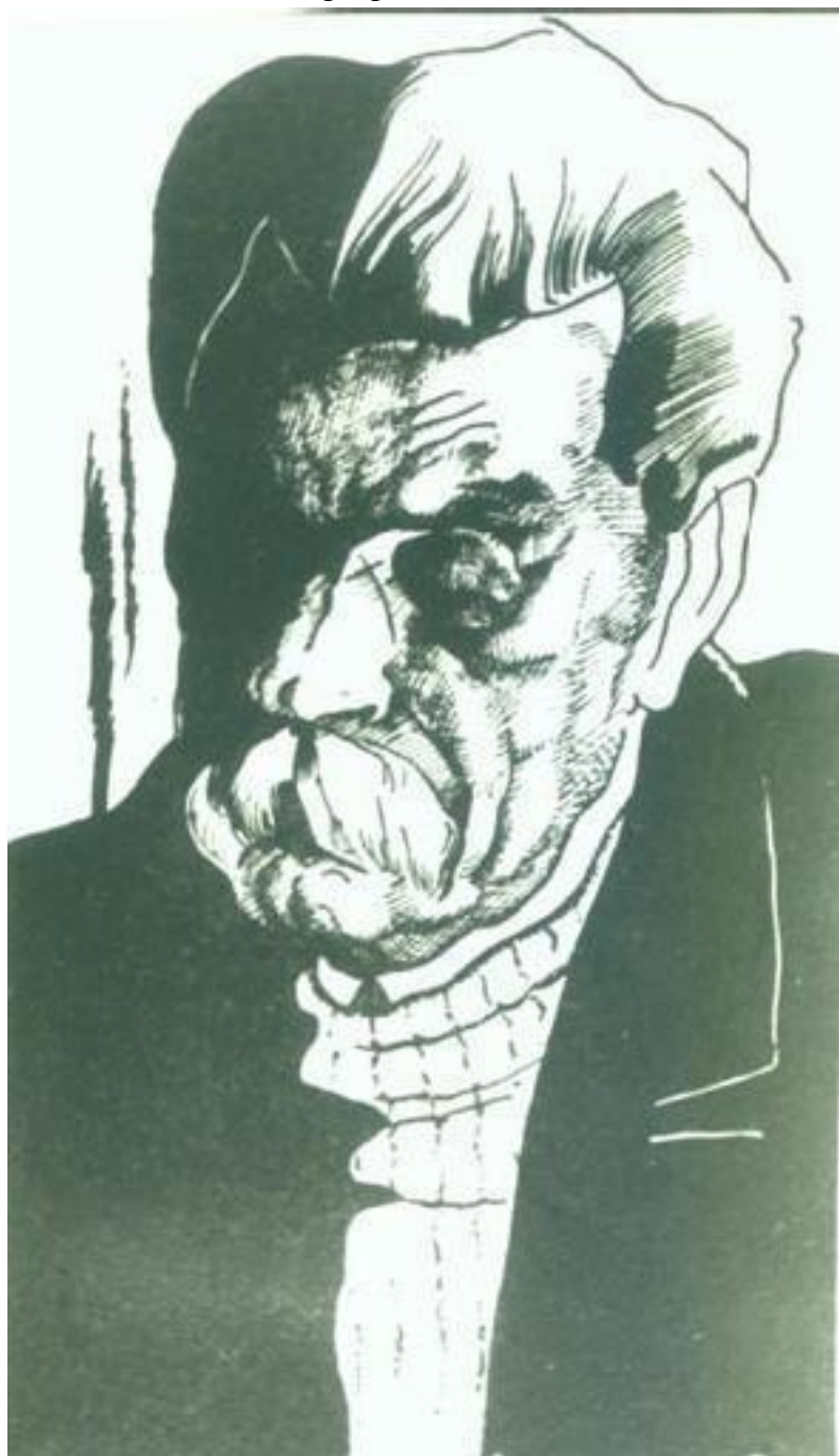
Ю. Анненков. Портрет М. Горького

«Впрочем, работая над портретом Ремизова, – комментирует эти слова сам Анненков, – я отнюдь не думал о «карикатуре». Я просто старался, как во всех других моих портретах, переложить видимое в графические (или в иных случаях – живописные) формы. Это, конечно, нельзя назвать «воспроизведением натуры». Это только ее графическая (или живописная) квинтэссенция. В искусстве форма завладевает видимым и ощущаемым, завладевает содержанием, сюжетом, и, завладев ими, сама превращается в них».