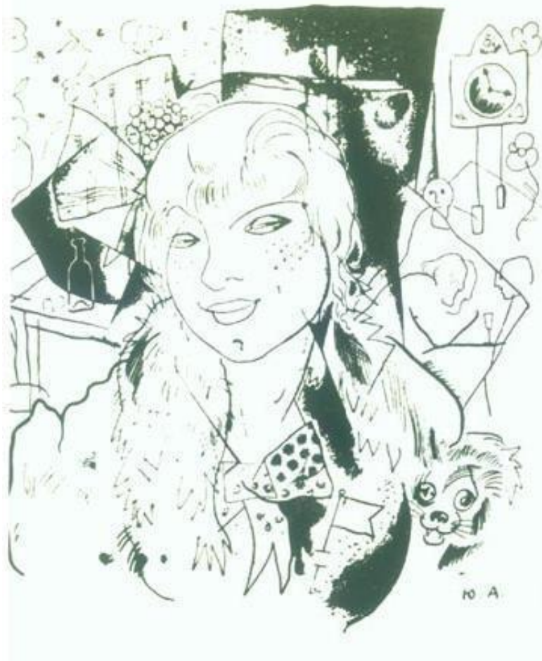
Ю. Анненков. Катька из иллюстрации к «Двенадцати» А. Блока