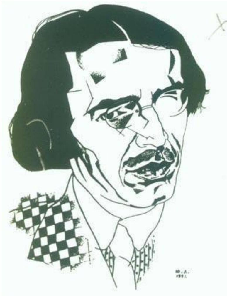
Ю. Анненков. Портрет В. Ходасевича