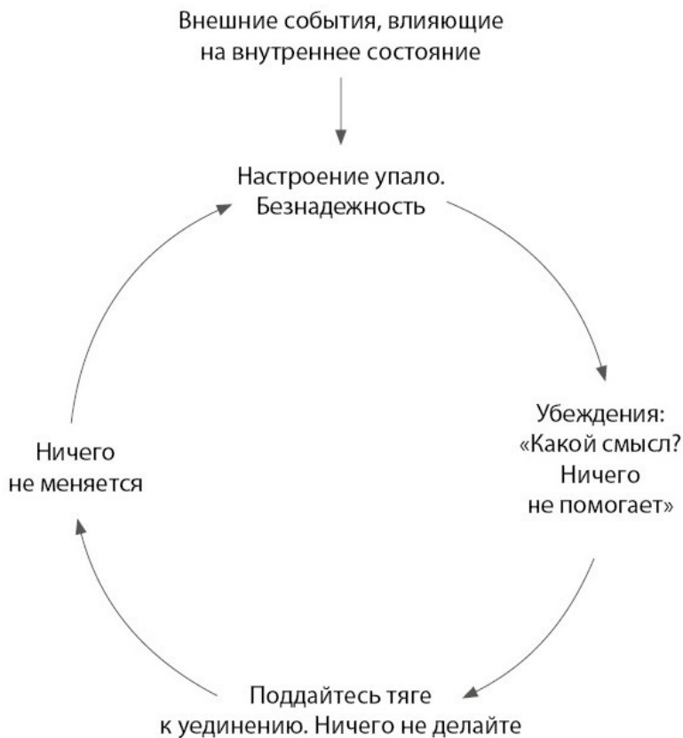
Рис. 1. Нисходящая спираль плохого настроения. Как

ше вероятность плохого настроения. В свою очередь, плохое настроение навевает грустные мысли. Так мы попадаем в цикл уныния. Но из него есть выход.