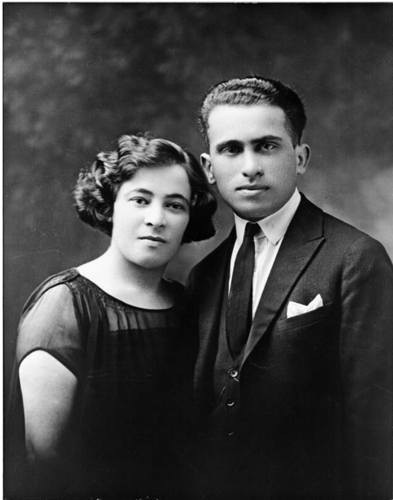
Отец и мать автора, ок. 1930 г.