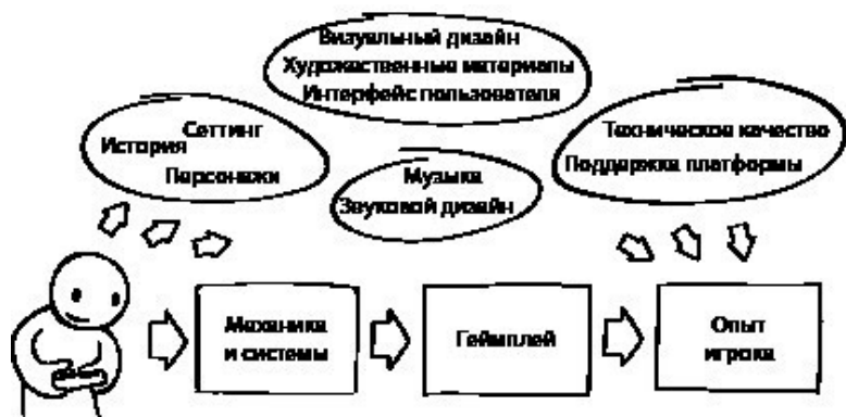
Иллюстрация 1.6. Примеры элементов вне геймплея, влияющих на опыт игрока

щий опыт игрока от любой конкретной игры – явление многогранное, для которого геймплей не единственный фактор, часто даже не главный.