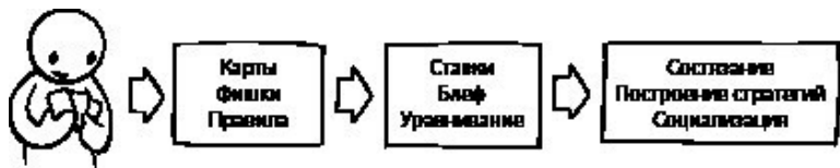
Иллюстрация 1.1. Пример покера