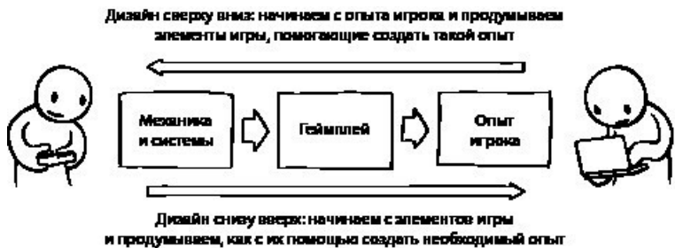
Иллюстрация 1.4. Два подхода к дизайну: сверху вниз и снизу вверх

Решение заключается в том, чтобы прибегнуть к гибриднему, итеративному подходу, работать с двух концов, разрабатывать планы сверху вниз, экспериментировать снизу вверх и, главное, создавать прототипы с самых ранних этапов, регулярно тестируя дизайнерские идеи и стараясь создать на их основе нечто цельное и связное. Такой гибридный, итеративный процесс делает гейм-дизайн похожим на некоторые другие его виды (Brooks, 2010).