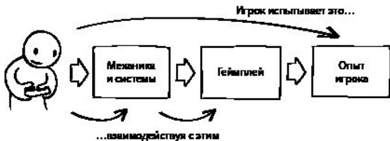
Иллюстрация 1.5. Игровой опыт складывается из взаимодействия игрока с игрой

Геймплей является итогом взаимодействия между игроком и дизайнером. В него вносят свой вклад как специалист, так и игрок. Дизайнер задает рамки опыта, а игрок действует так, как ему захочется – согласно ожиданиям специалиста или вопреки им. Иногда такое взаимодействие оказывается успешным, и дизайнеру удастся реализовать задуманный опыт. В других же случаях игроки находят свои способы расшатать конструкцию дизайнера и превратить ее в нечто другое, соответствующее их пожеланиям. А порой тщательно продуманная конструкция просто рушится, а весь опыт разваливается на куски. Такое взаимодействие – диалог, требующий определенной степени сотрудничества с обеих сторон, равно как и понимания того, что не существует единственного «правильного» способа играть в игру.