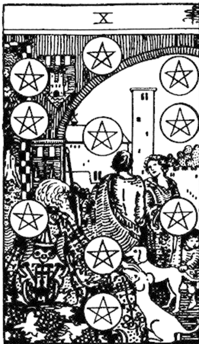
Рис. 1. Десятка пентаклей

После «Золотой зари» ландшафт западного оккультизма навсегда изменился. Более поздние магические общества, такие как орден восточных тамплиеров (Ordo Templi Orientis, О.Т.О.) Алистера Кроули, «Строители Адитона» Пола Фостера Кейса и «Общество внутреннего света» Дион Форчун, были явно каббалистическими. Они работали по системе ступеней посвящения, построенной вокруг древа жизни, и магия, которой они учили, была церемониальной, систематической каббалой. Эта тенденция актуальна и для большинства колод Таро, которые были опубликованы в XX веке: почти все они основаны на каббалистических соответствиях, установленных «Золотой зарей». Некоторые из этих символов довольно легко считываются (как в случае с эзотерическими колодами, такими как Таро Тота). Однако некоторые открываются лишь самым внимательным. Так, например, проницательный наблюдатель увидит, что монеты на десятке Пентаклей в колоде Райдера-Уэйта-Смита расположены в форме древа жизни.