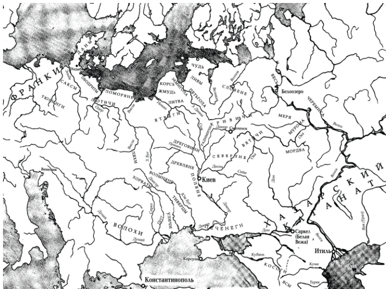
Рис. 1. Карта речных путей и расселения племен

Надеюсь, что вам удалось разглядеть пару-тройку маршрутов, и мы можем сравнить наши результаты. Маршруты начнем от юго-восточного побережья Каспийского моря и далее через Хазарию по Куме, затем Кубани в Черное море, оттуда по Дунаю до империи франков, или по Днестру до Западного Буга, затем в Вислу и Балтику. Другой маршрут – опять через Хазарию, но по Волге до Белоозера и далее в Ладогу и Финский залив. Есть и другой путь из Каспия на Балтику – по Волге до Ржева, далее в Западную Двину