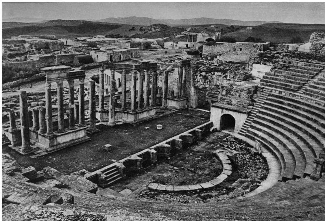
Тимаза. Вид кардо в северном направлении