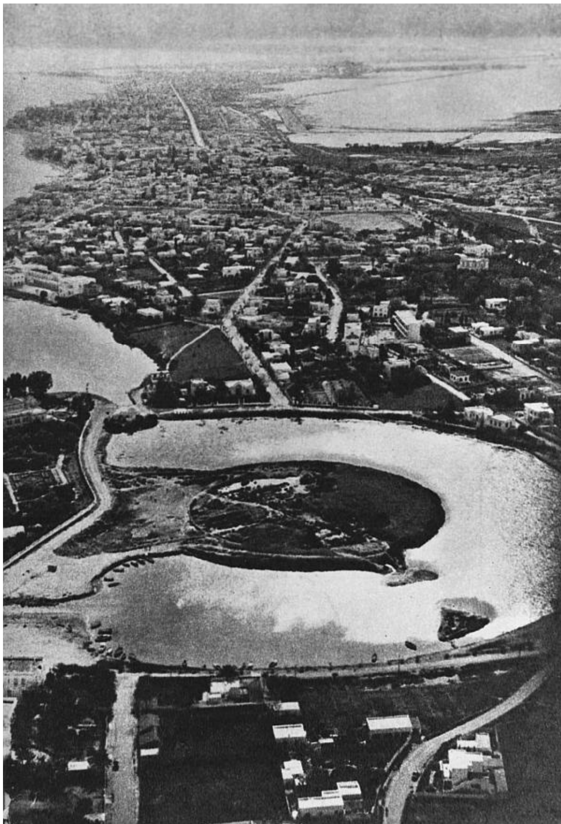
Вид военного порта в Карфагене. Аэрофотосъемка

Во время работ по расчистке этих водоемов в 1954 и 1955 годах удалось обнаружить замощение дна каменными плитами, нижний слой которых, скрепленный свинцом, относился к доримскому времени. Археолог А. Мерлен нашел на острове прямоугольные столбы, разме-