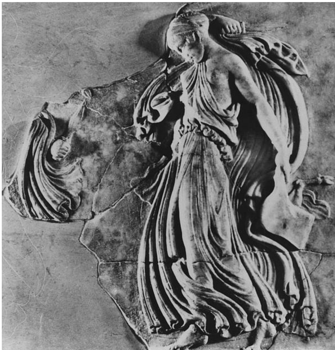
Менада из Тубурбо-Майуса. Фрагмент.

Мраморная копия бронзового рельефа Каллимаха. Тунис, музей Бардо