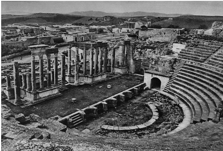
Типаза. Вид кардо в северном направлении