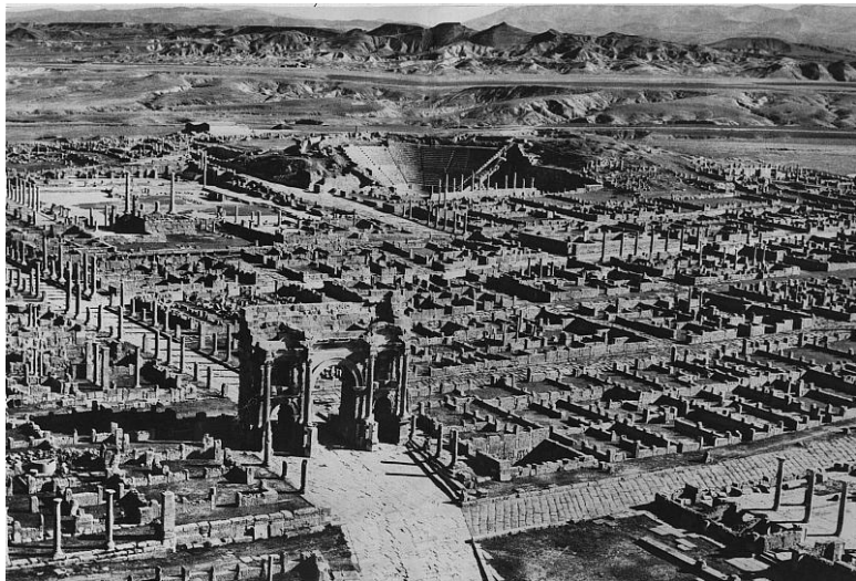
Тунис, музей Бардо.