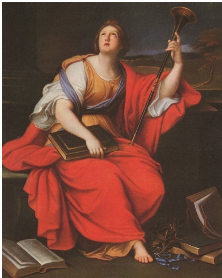
Клио – муза истории. Художник Пьер Миньяр, 1689 г.