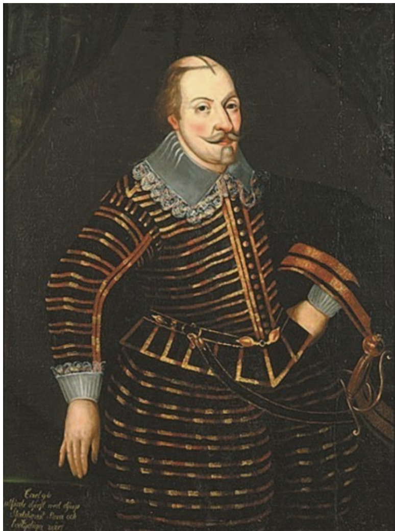
Carl g:ta officer d:ligt med d:rup Södermanl:ns l:sten och L:stg:ldagen 1677