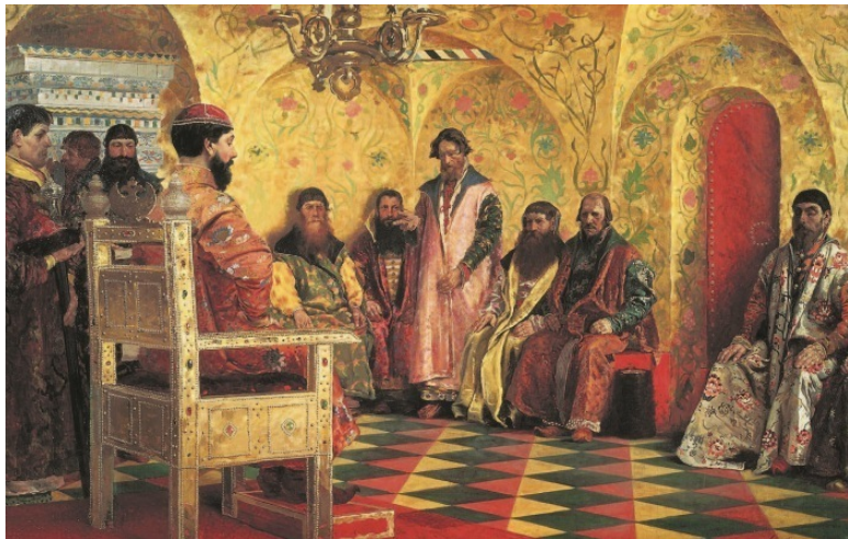
Царь Михаил Фёдорович и бояре. Художник А.П. Рябушкин, 1893 г.