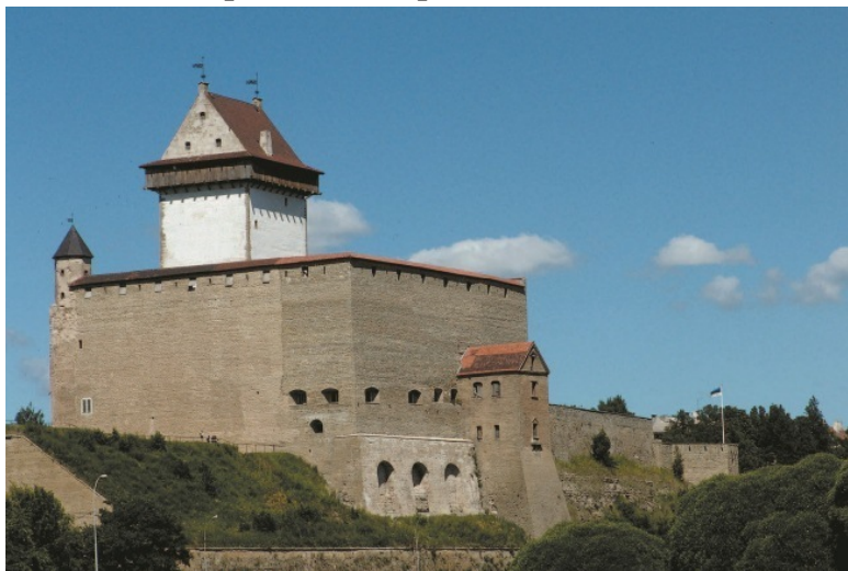
Нарвский замок, 2005 г.

Дипломатические обращения со шведской стороны осуществлялись как из Нарвы и Выборга через воевод Новгорода и Корелы (Приозерска), так и в виде официальных миссий в Москву. В литературе имеются сведения о посольстве С. Леммия в конце 1606 – начале 1607 г. и о посольстве Бернда Ньюмана в сентябре 1607 – апреле 1608 г.