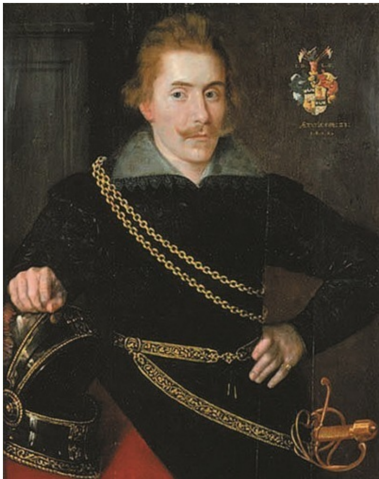
Граф Якоб Делагарди. Портрет из Национального музея Швеции