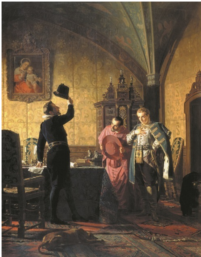
Присяга Лжедмитрия I польскому королю Сигизмунду III.