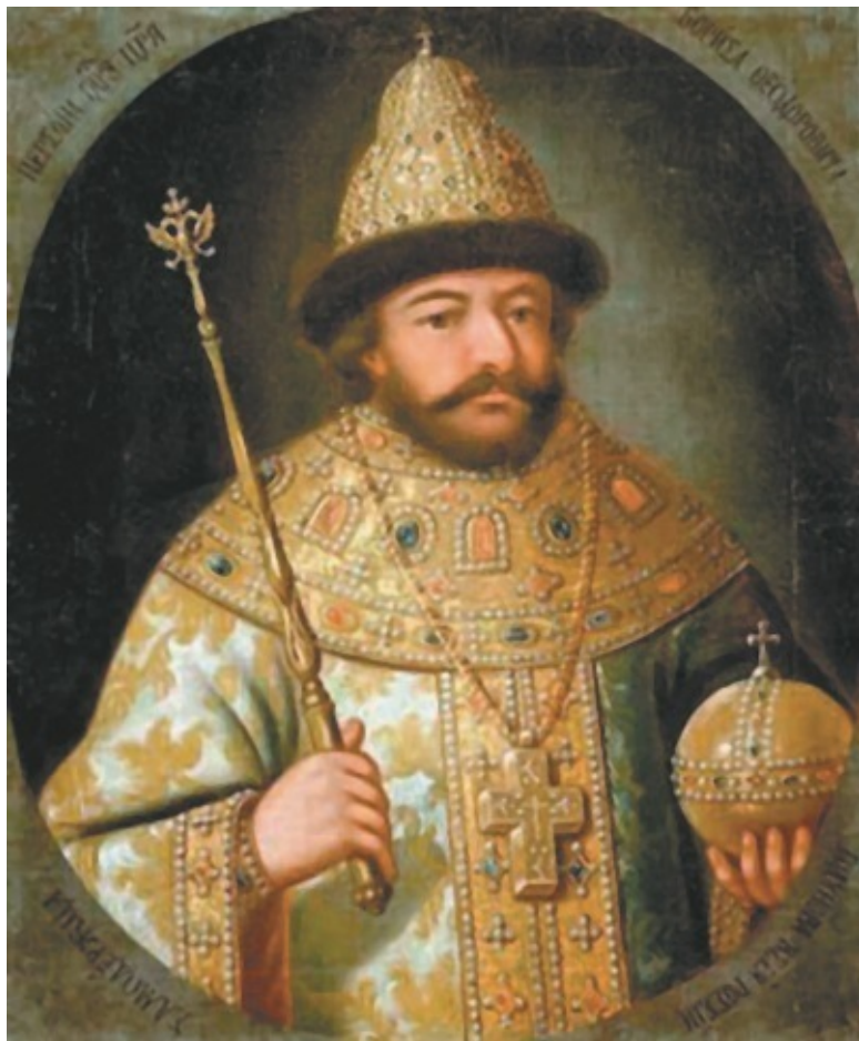
Царь Борис Годунов

В 1602–1603 гг. в пределах Речи Посполитой объявился