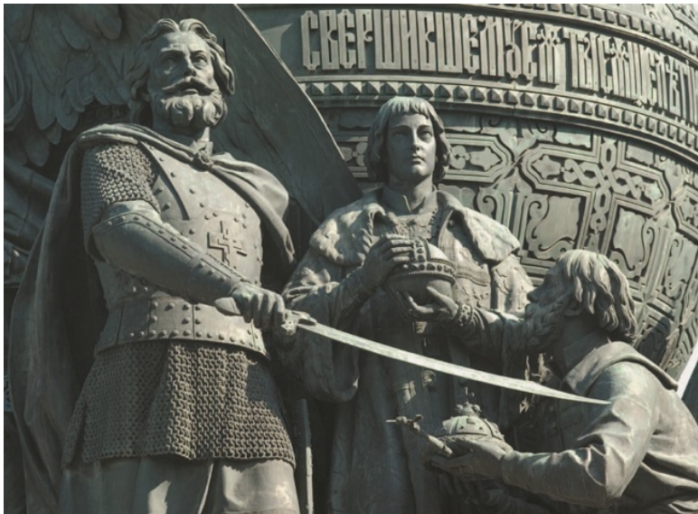
Михаил Романов на памятнике «Тысячелетие России» в Великом Новгороде

А Петрея московские бояре явно надули, отведя ему роль пешки в чужой игре. Думаю, что со временем он разобрался в этом и отсюда его особая озлобленность в описании москвитов как лживого и коварного отродья. Что ж, по-человечески можно понять Петрея: возмечтать о себе как об участнике крупной политической акции, а потом обнаружить, что его просто использовали в политическом блефе, – не слишком приятное открытие.