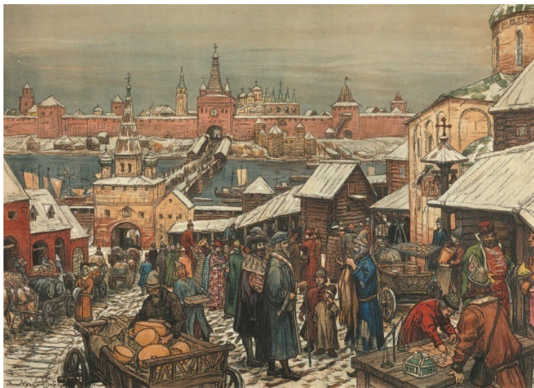
Новгородский торг. Картина Аполлинария Васнецова, 1909 г.

послужившая интерлюдией к завоеванию Карлом IX русских городов. Действия Сигизмунда явно соблазнили и политическую мысль Швеции. Еще связанный союзническими отношениями с царем Василием Шуйским, Карл IX уже, вероятно, начинает увлекаться планом использовать идею Сигизмунда в собственном сценарии. Это было, вероятно, неизвестно в шведских придворных и военных кругах, что и объясняет предприимчивость и дерзость Делагарди в его политической инициативе выступить ходатаем за кандидатуру шведского принца как за нового кандидата «со стороны».