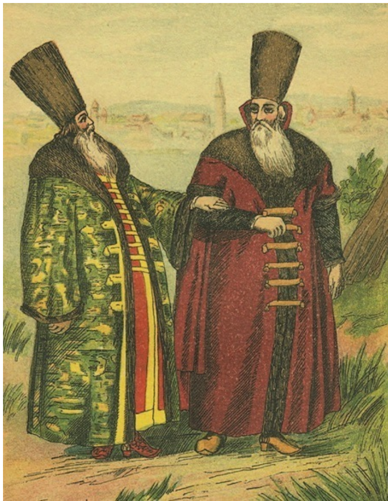
Московские бояре XVII в. Иллюстрация из книги «Описа-