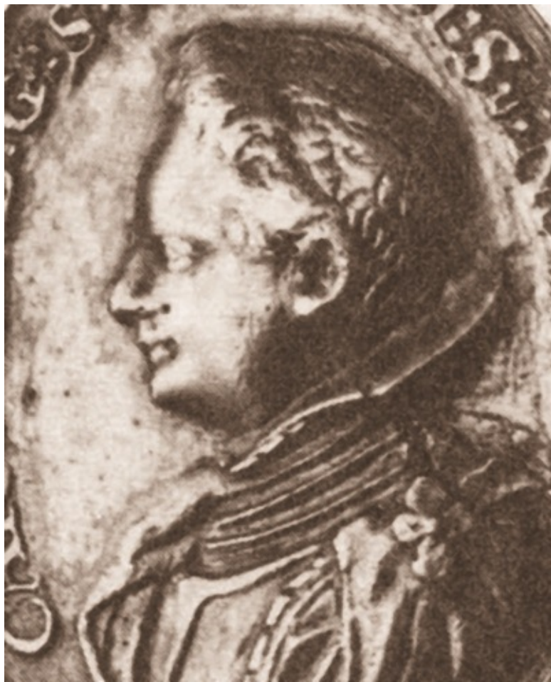
Шведский принц Карл Филипп