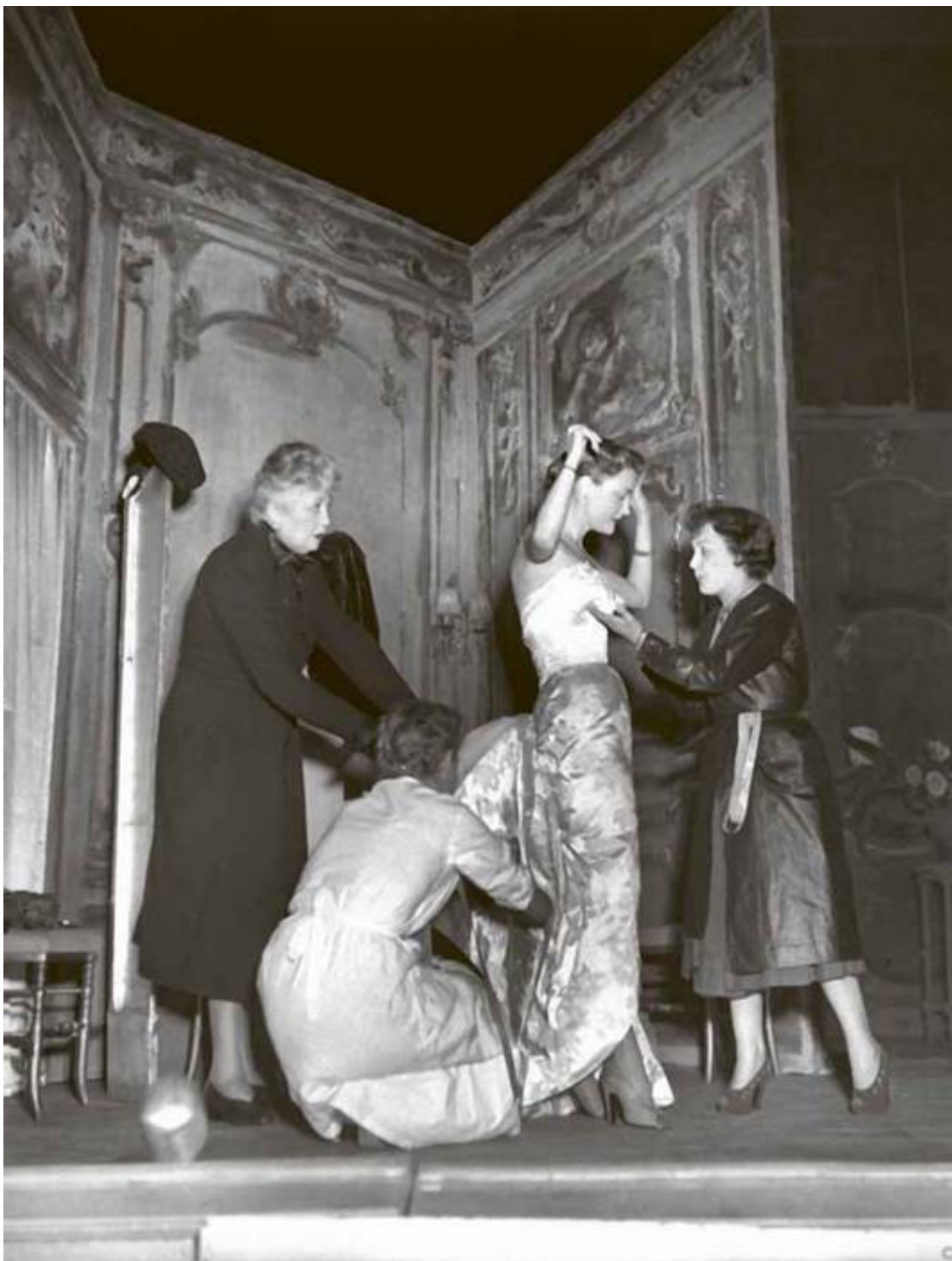
Примерка платья от Бальмена для пьесы Марселя Ашара «Малышка Лили» на музыку Маргерит Монно. Манекенщица Пралин и Эдит Пиаф, театр ABC, Париж, март 1951 г.

талантом! Подобная швея быстро выделяется среди остальных своим вкусом, умелой отделкой работы, неким личным шиком!.. Случается, если повезет, стать первой мастерицей в двадцать пять лет.