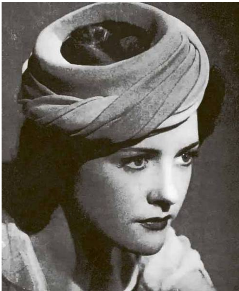
18 лет, у Сапорты