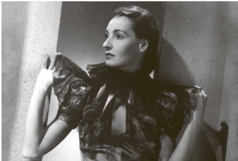
Русская манекенщица Варвара Раппонет в