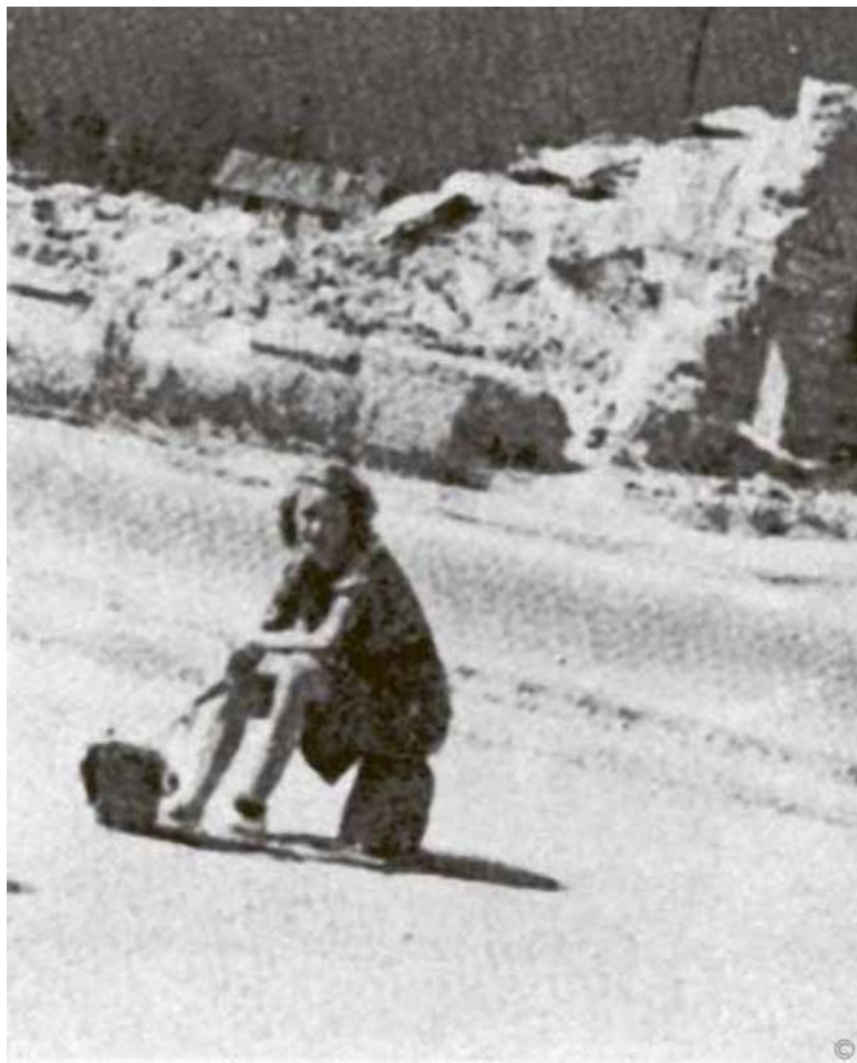
Исход в Коррез