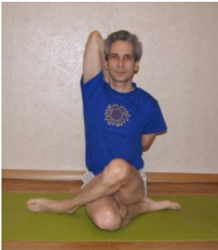
Гомукхасана (поза головы коровы)

Встречал Солнце, делая по утрам комплекс Сурья Намаскар: