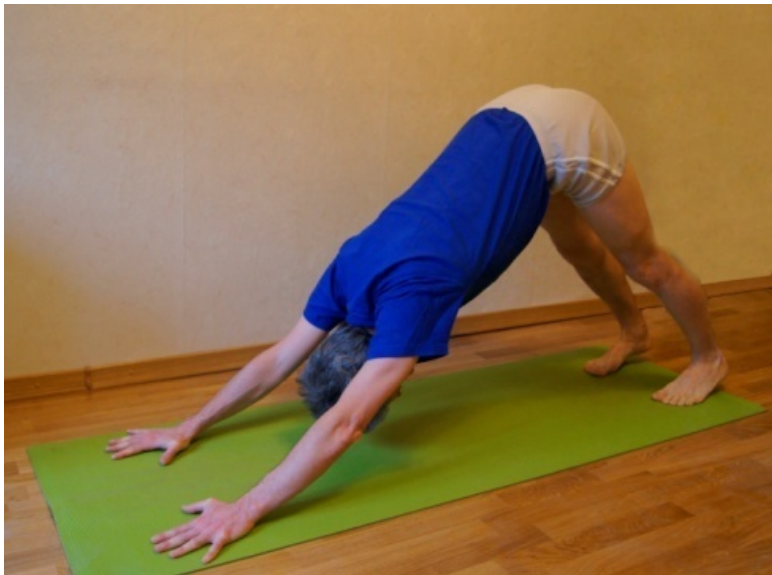
Адхо мукха шванасана