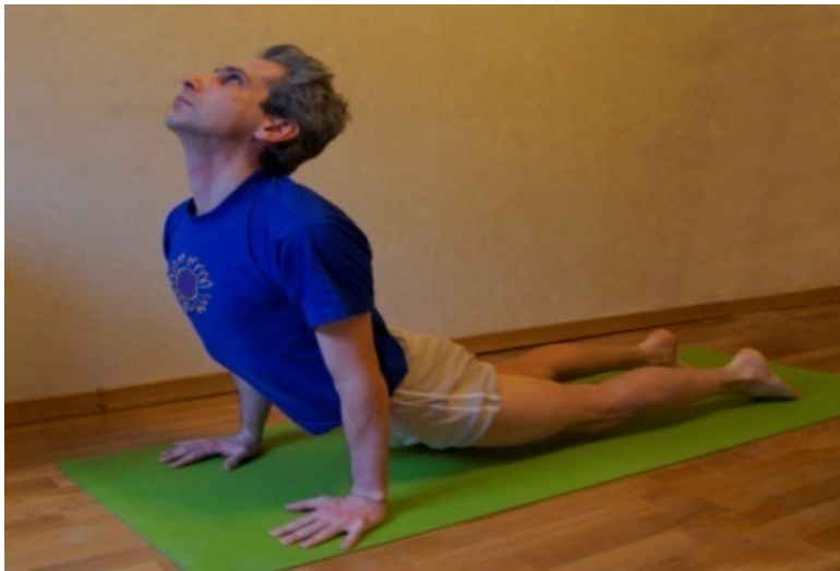
Урдва мукха шванасана