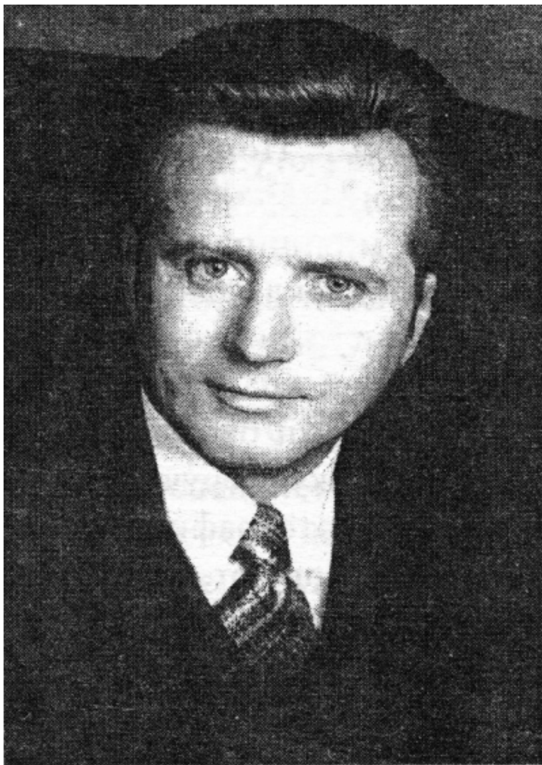
Агитплакат В. Терлецкого, в то время, когда с ним работали мы