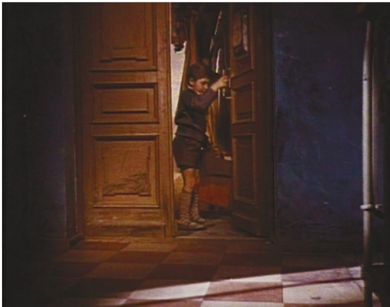
Саша выходит в мир. Кадр из фильма «Каток и скрипка» (1960), режиссер Андрей Тарковский