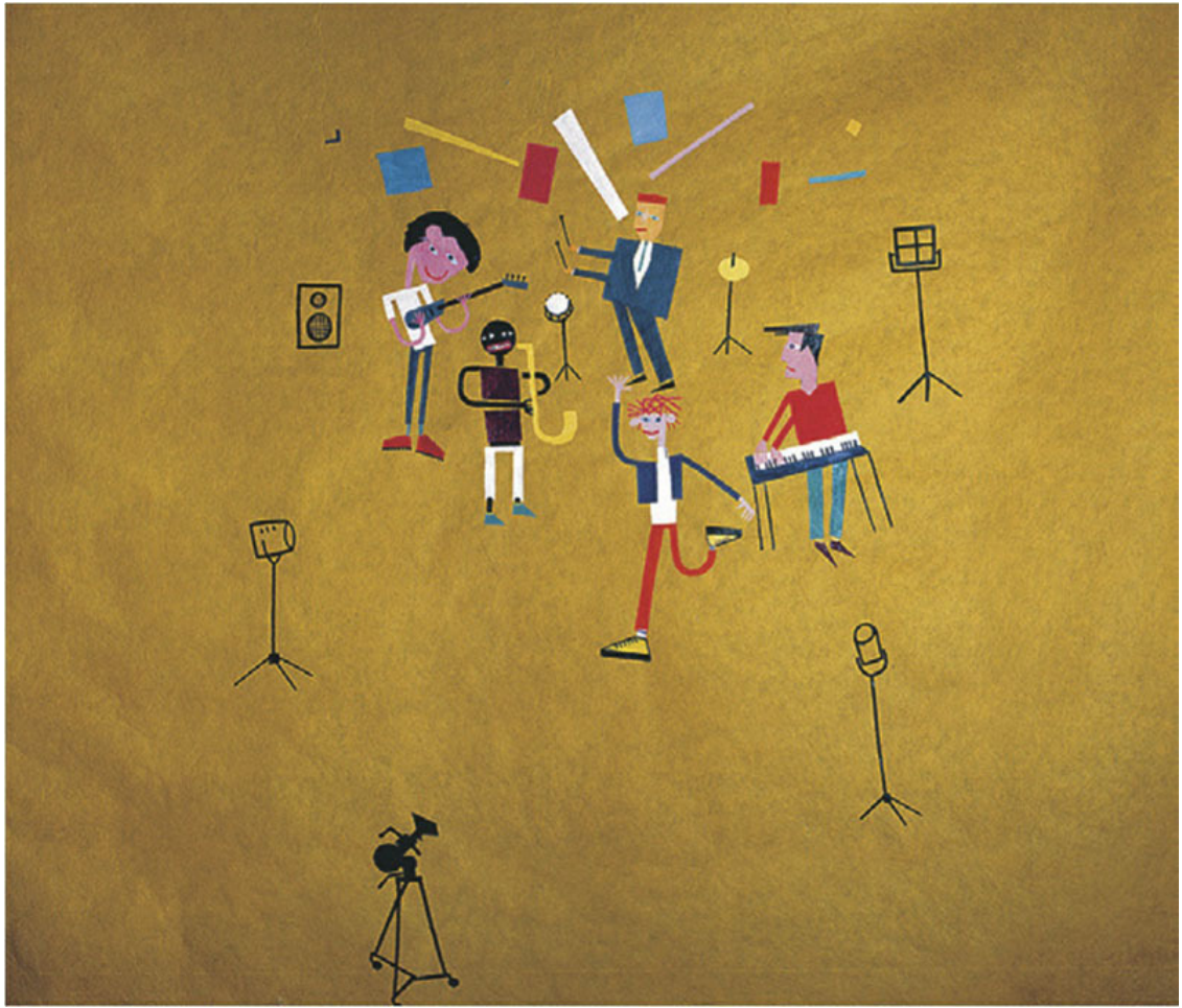
Асса. 1987. Нетканый фон (профессиональный фотографический задник), акрил. Московский музей современного искусства