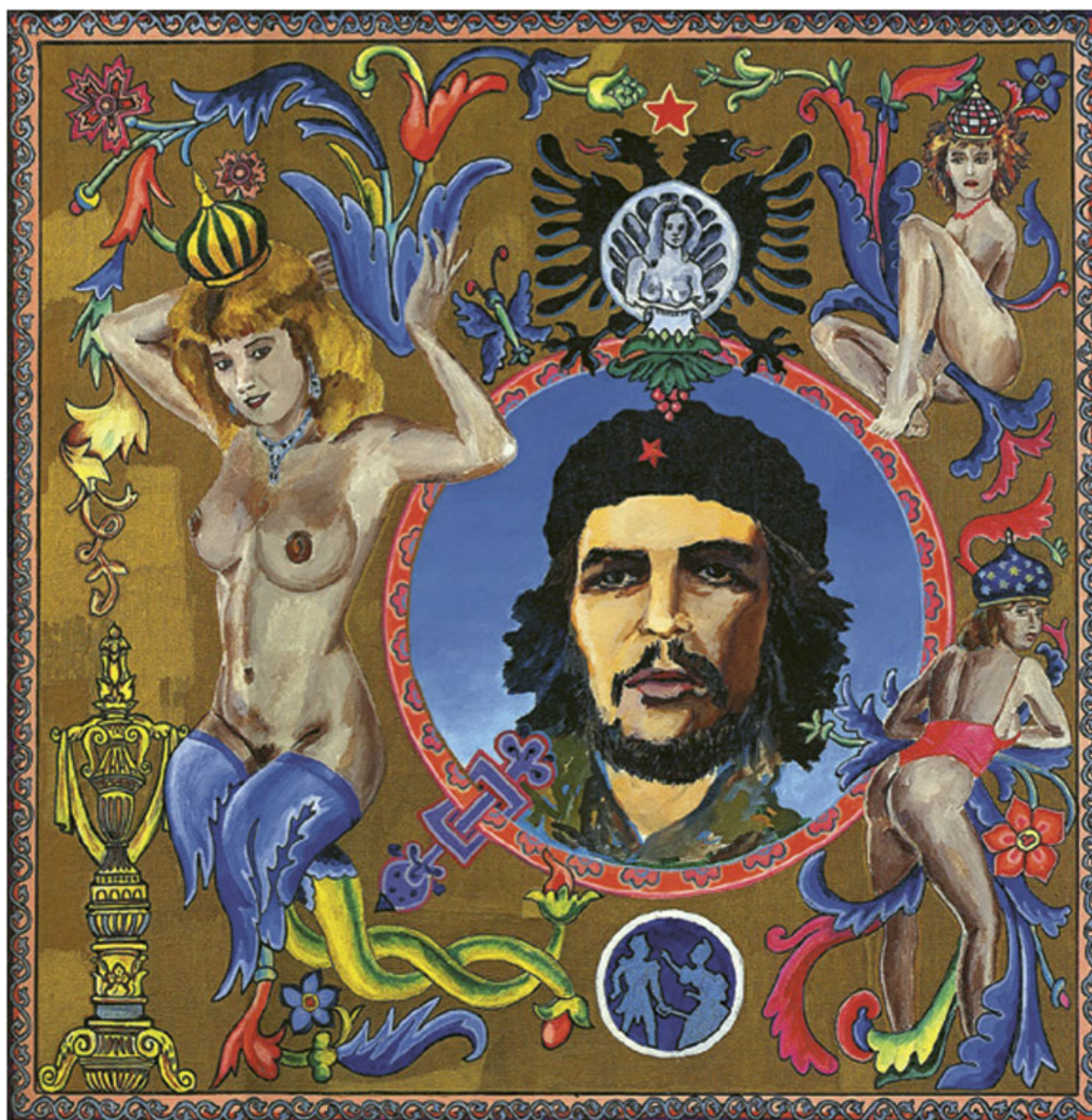
Че Гевара. 1990. Холст, масло. Stella Art Foundation, Москва