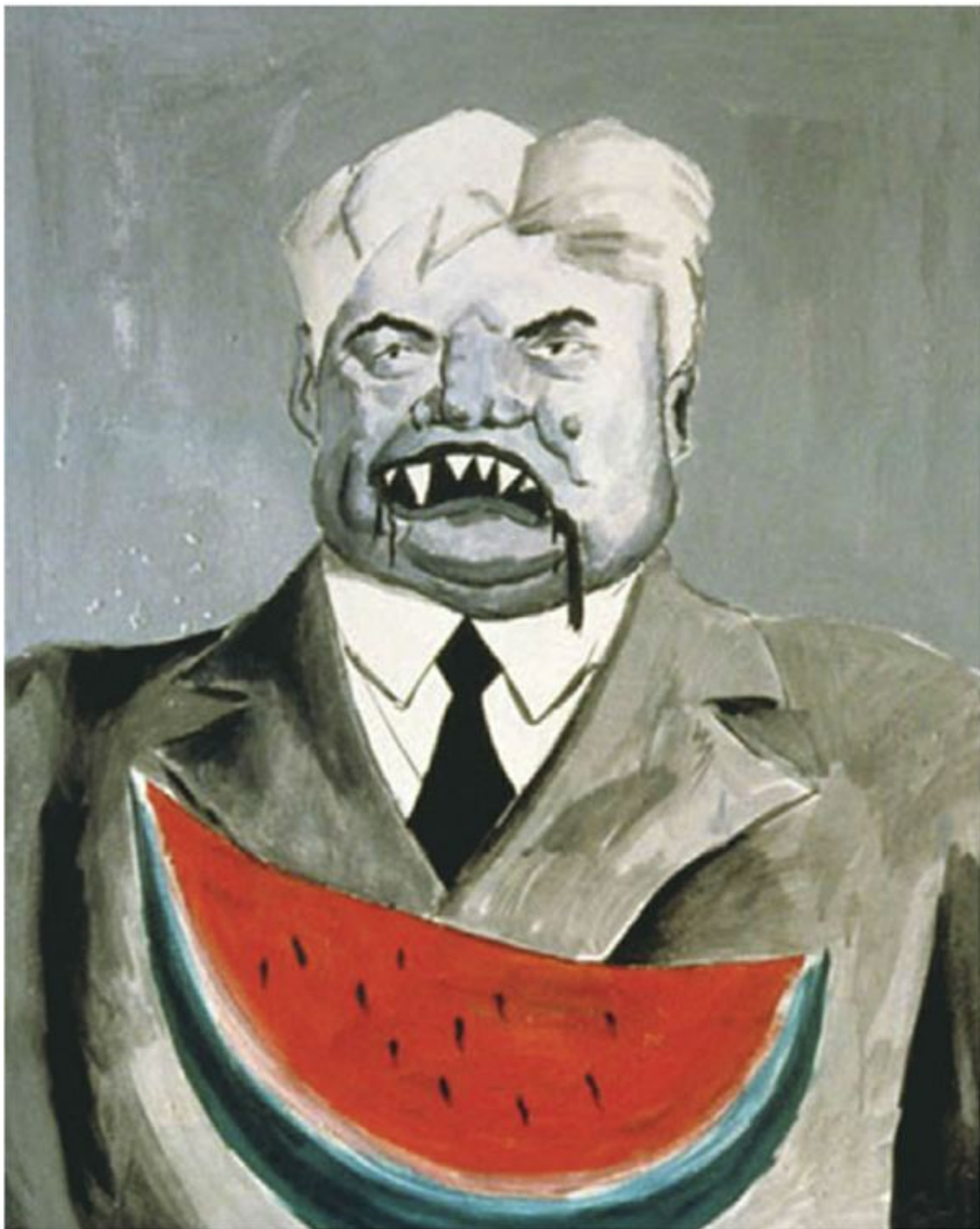
Вампир Илья Ильич. Из цикла «Пердо». 1987. Оргалит, темпера.