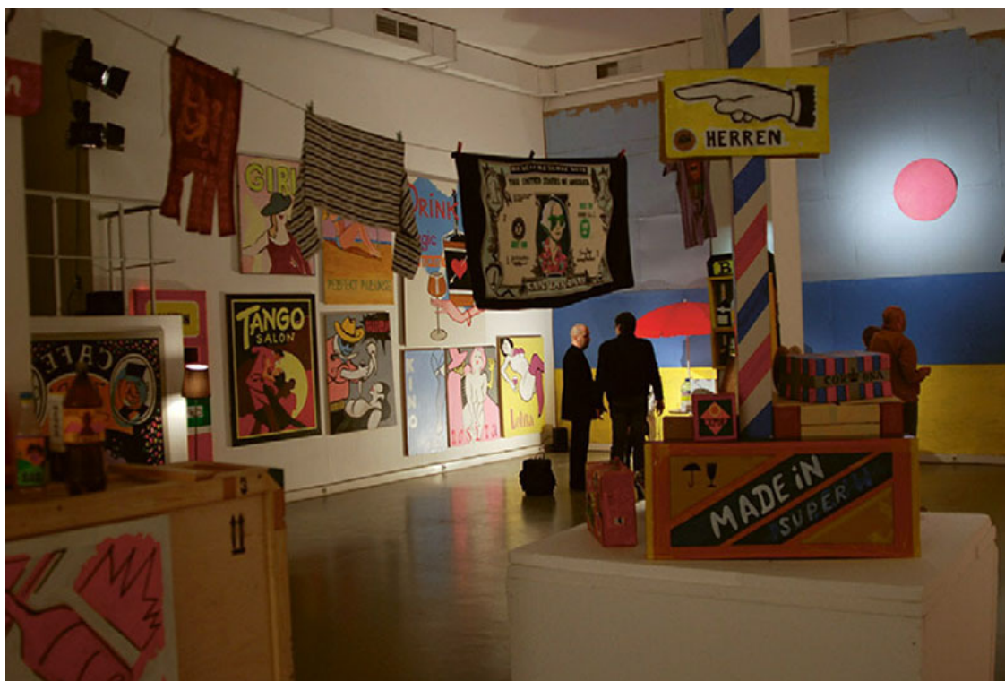
Вид экспозиции выставки «Нормальная цивилизация» в XL Галерее, Москва. 2009.