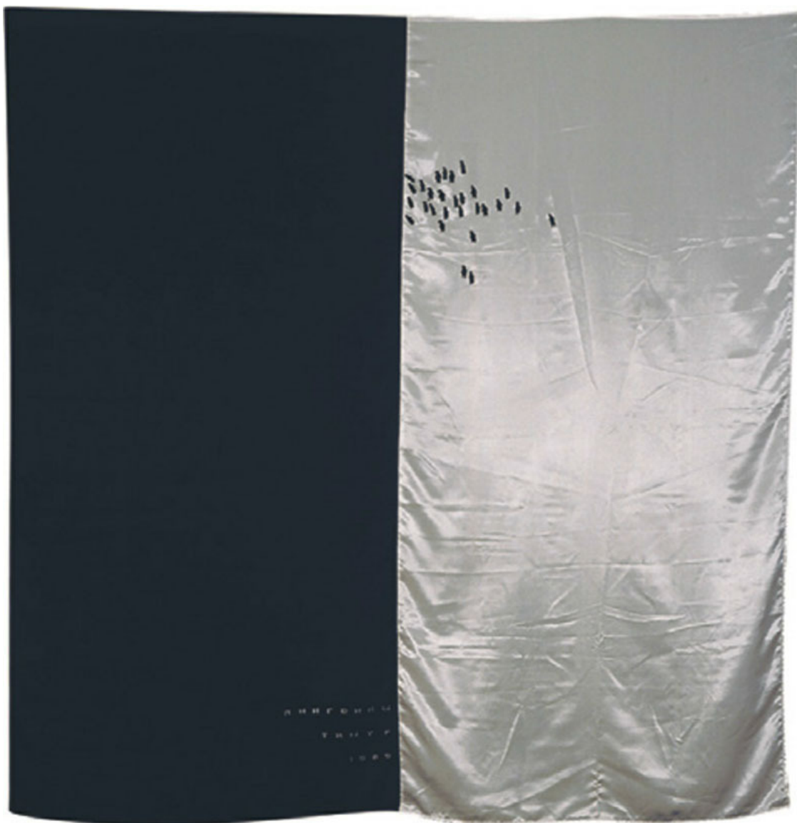
Пингвины. 1989. Ткань, акрил. Частное собрание