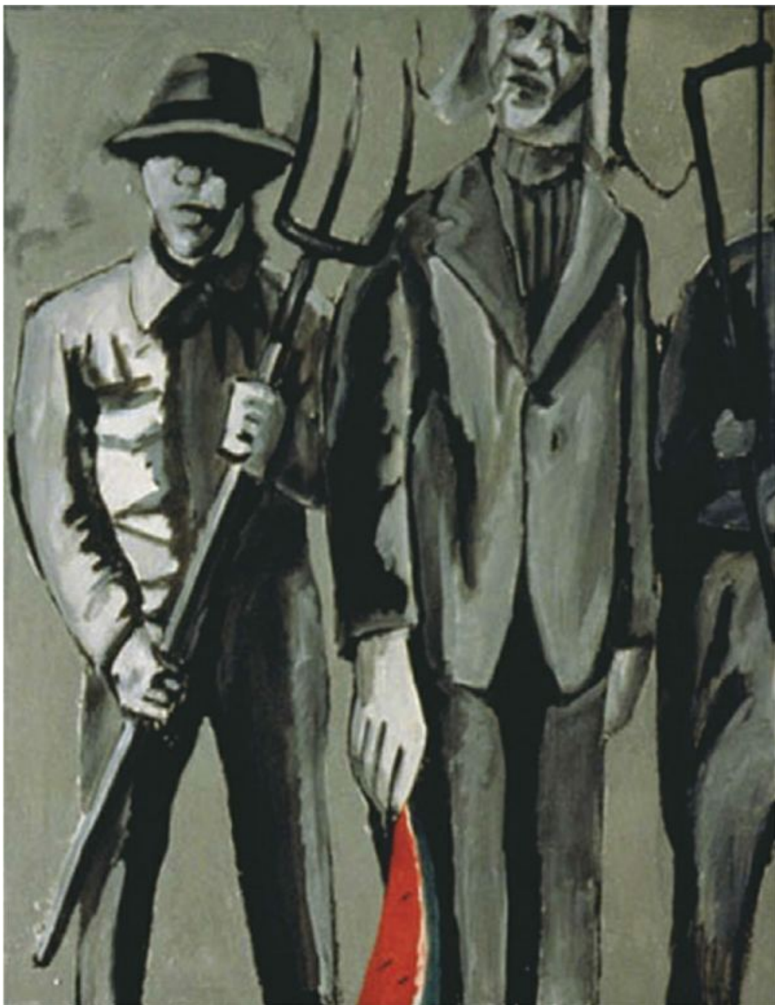
Из цикла «Пердо». 1987. Оргалит, темпера. Предоставлено XL Галереей, Москва