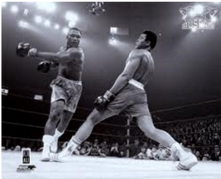
Мухаммед Али легко уходит от удара