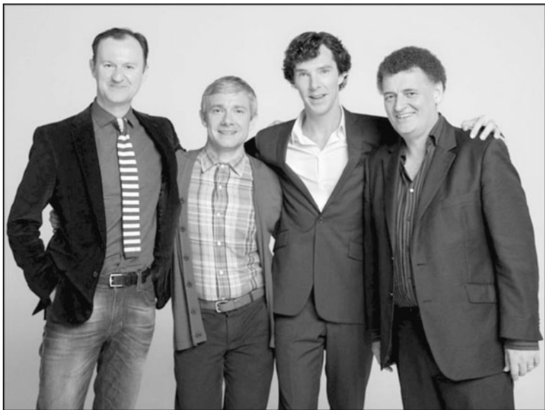
Марк Гэтисс, Мартин Фримен, Бенедикт Камбербэтч и

Сценаристы были загружены работой, поэтому идею решили оставить до лучших времен. Вернее, так решил Моффат, а вот Марк Гэтисс не мог ни о чем другом думать, кроме как о том, как правильно снять историю о знаменитом детективе.