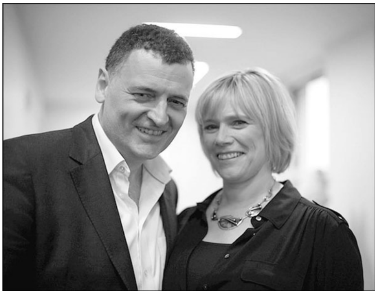
Стивен Моффат с женой Сью Вертью. «Сью никогда не

Стивен тогда отправился вместе со своей женой, кинопродюсером Сью Вертью в Монте-Карло. Целую неделю они наслаждались неожиданной свободой. За эти семь дней ему удалось заразить жену идеей о возрождении Шерлока Холмса. Если поначалу Сью смотрела на все эти бесконечные обсуждения сценария как на игры так и не выросших сорокалетних мальчишек, то теперь она не меньше Моффата и Гэтисса хотела заняться проектом.