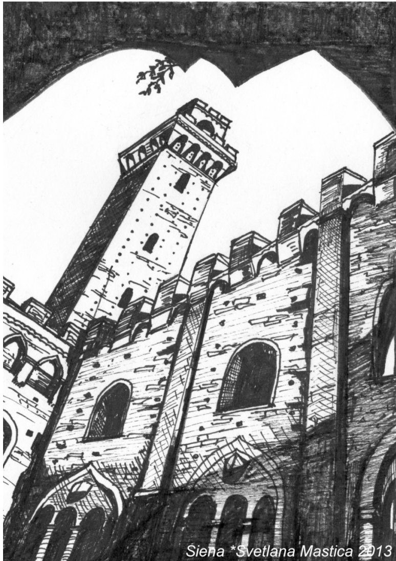
Siena *Svetlana Mastica 2013