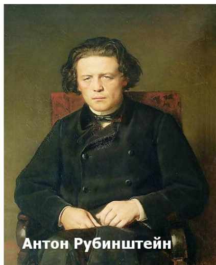
В. Перов. Портрет Антона Рубинштейна