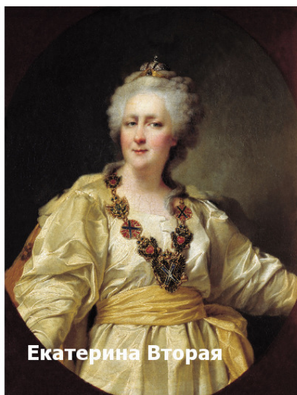
Д. Левицкий. Портрет Екатерины Второй

Прозрачность – так называлось, совершенно официально, здание, состоящее из шести этажей, шестиквартирное, каждая квартира занимала целый этаж. Сталь, бетон, затемненное стекло – почти как «Спокойствие», но с зеленоватым оттенком затемнение. Здание примыкало к восьмиэтажному отелю, построенному десятью годами ранее по стандартному проекту, без излишеств. В отеле наличествовал бар, и соединялся бар с вестибюлем Прозрачности дверью с компьютерным замком – для удобства ее, Прозрачности, обитателей. Вид с улицы – козырек над входом в отель и бар, вывеска в окне – «Каткин Бюст», над надписью улыбающееся девичье лицо, и не очень понятно, при чем тут бюст, никакого бюста на картинке нет, и что за Катка, уж не Екатерина ли Вторая. Но нет, Екатерину лицо на вывеске несколько не напоминало, и одноименных легенд кинематографа тоже.