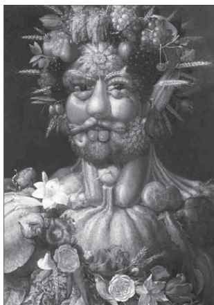
Джузеппе Арчимбольдо. Портрет Рудольфа II в образе бога садов Вертумна. 1590

«Не удивляйся: моя специальность – метаморфозы», – так говорит Вертумн в посвященной ему поэме И. Бродского. Без этого бога, ушедшего в неизвестность, «...метаморфозы, / теперь оставшиеся без присмотра, / продолжают по инерции». И поэт, который чувствовал себя собакой, оставшейся без пастуха, обращался к богу: «Вертумн ... Вертумн, вернись». Без бога метаморфоз культуры не может существовать.