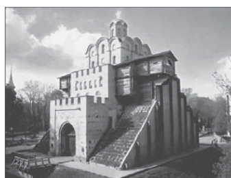
Золотые ворота в Киеве. Современный вид. Реконструкция. Фото

Показательна судьба античных богов и героев в мифологии и искусстве последующих веков, многочисленные воплощения в них реальных лиц в портретах «в виде» Минервы, Марса. Возможно, не просто совпадение, что именно Аполлон, «биография» которого отмечена функциональными превращениями и которому приписаны благодетельные и губительные свойства (те и другие присущи и природе, и культуре), стал покровителем всех искусств. Эта роль не досталась Янусу, хотя он двуликий и считался богом всякого начала, богом богов, вращающим ось мира. Сам Аполлон лишь как Мусагет оказался способным соответствовать полиморфному представлению о культуре, ему были приданы не только музы, но и красота – знак гармонии.