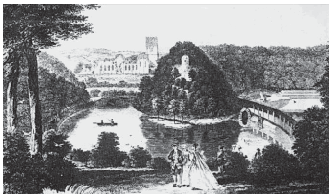
Стадлей Ройаль и парк аббатства Фоунтен. Гравюра Энтони Уоркера. 1758

Природа, так или иначе воспринятая, становится пространством культуры. В отличие от «садообразного пейзажа», каким природа предстает в своих наиболее гармоничных проявлениях, именно в культурном пространстве располагается созданная человеком садово-парковая «вторая натура», которую одному из авторов XVI в. было «непонятно, как и назвать». Сад как возделанный участок земли – это всегда пространство культуры 105 , что относится и к временам, не осознававшим специфичность культурной и эстетической деятельности (В полной мере это пришло лишь с Ренессансом. Именно тогда началось художественное моделирование ландшафта 106 .) Однако попадая в сферу культуры, сад не перестает при этом оставаться пространством природы – небо служит такой же его необходимой составляющей, как и земля. Декоративность небесных (в прямом смысле) естественных световых эффектов постоянно учитывалась создателями садов как в Версале, так и в английских парках. Природа сохраняет в саду свойство быть живой природой – сад всегда растет, это также принималось во внимание садоводами в их проектах. Сад живет и в природном времени, и в историческом.