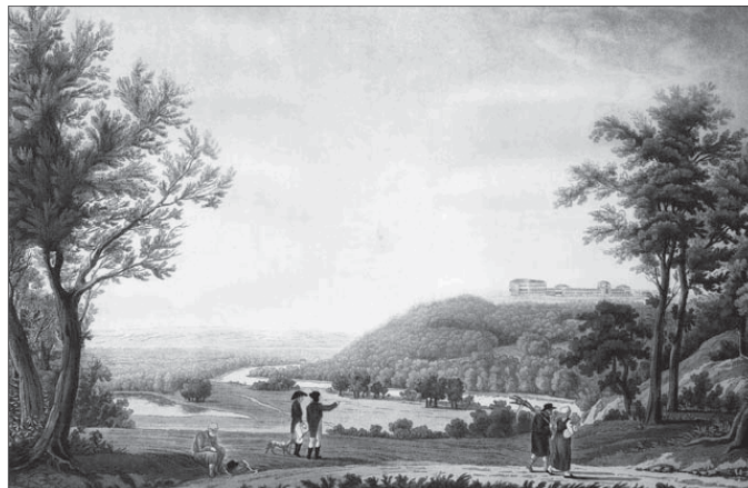
Ж. Месмер. Надеждино и окрестности

как и ко всякой физической теории, как бы хорошо обоснованной ее ни считали. Каждая из них сама есть миф и в каждой своей черте предусмотрена антропоморфически» 76 .