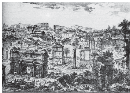
Джованни Баттиста Пиранези. Римский форум (Campi Vaccini). Гравюра. Около 1762

Благодаря свойствам своего непространственного сознания человек постоянно находится во множестве пространств и времен. По словам Б. Пастернака, человек «не поселенец какой-либо географической точки. Годы и столетия, вот что служит ему местностью, страной, пространством» 46 . Х.Л. Борхес писал об особом рода лабиринте, «который охватывал бы прошедшее, настоящее и грядущее и каким-то чудом вмещал всю Вселенную» 47 . Таким образом эта фигура получала не только пространственные, но и временные признаки, четвертое измерение.