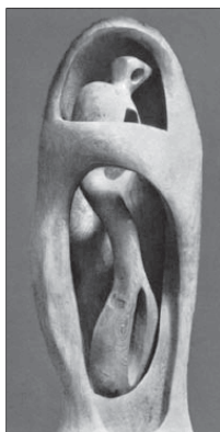
Генри Мур. Внешне-внутренняя форма. Деталь. 1952–1953

Исследовались разные типы пространства. Для Элиаде это прежде всего сакральное пространство, для Топорова – пространство мифопоэтическое. Его интересовала также связь природного и культурного начал, их пространственный макроконтэкст, в котором встреча духовно-физического и «великих» текстов культуры порождает духовные ситуации «высокого напряжения» 11 . Г.Д. Гачев увидел синкретичное пространство космо-психо-логоса , раскрывая его в национальных образах мира как единство местной природы, характера народа и его склада мышления 12 .