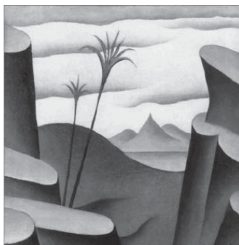
Ян Зрзавы. Библейский ландшафт. 1910

что «за века художественной истории Европы точка зрения сместилась – от ближнего видения к дальнему». В результате «сначала изображались предметы, потом – ощущения и, наконец, идеи», внимание перемещалось «с объекта на субъект, на самого художника, от внешней реальности, через субъективное, к интрасубъективному» 18 . Об этом ранее писал и Шпенглер: «Только „point de vue“ дает ключ к пониманию... странного человеческого способа подчинять природу символическому языку форм искусства» 19 . Флоренский назвал прямую перспективу лишь особой орфографией, «одной из конструкций», а обратную перспективу – средством создавать пространство символов, а не подобий («Обратная перспектива». 1922). Пространственные аспекты нашли место в иконологии А. Варбурга и Э. Гомбриха, которая обнаружила тенденцию к сближению с семиотикой. Понятие прямой перспективы Э. Панофский ввел в круг описанных Э. Кассирером символических форм, которые создаются мифом, философией, языком, наукой 20 . Особые пространственные значения раскрылись посредством понятия складка , разработанного Ж. Делёзом, в особенности, применительно к искусству барокко и через сравнения с барокко художественных явлений других эпох 21 .