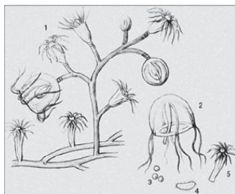
Метаморфозы в природе. Колония гидроида, отпочковывающая медуз

Культура, долгое время преимущественно противопоставлявшаяся природе, теперь все чаще рассматривается с точки зрения их общих свойств. К их числу, наряду с уже называвшимися в литературе, принадлежит и дар метаморфоза. Служащий в природе одним из способов ее воспроизводства, в культуре он приобрел универсальный характер, затрагивая и предметную, и ментальную сферу, что недоступно природе. В культуре можно найти аналогии той разновидности биологического развития, когда на определенном этапе происходит одноразовая и неожиданная для наблюдателя метаморфоза (в качестве художественного образа это пришло в сказку, где царевна-лягушка внезапно сбрасывает свою шкурку, подобно бабочке, освобождающейся от кокона). В культуре могут происходить также постепенные и даже многократные метаморфозы в пределах одного явления – каждый мастерский мазок кисти на холсте преображает его (это документализировал А.Ж. Клузо в фильме «Тайна Пикассо». 1956). В разных слоях семантически насыщенных текстов возможны несинхронные метаморфозы, какие-то слои могут выпасть из этого процесса, что произошло, в частности, с бродячими сюжетами.