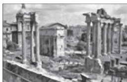
Римский форум. Фото

Подобно тому, как борхесовский создатель сада верил не «в единое абсолютное время... [а] в бесчисленность временных рядов, в растущую, головокружительную сеть расходящихся, сходящихся и параллельных времен», так и культура, обладая собственным пространством бытия, творит бесчисленное множество пространств-текстов, свидетельствующих о ней самой и мире.