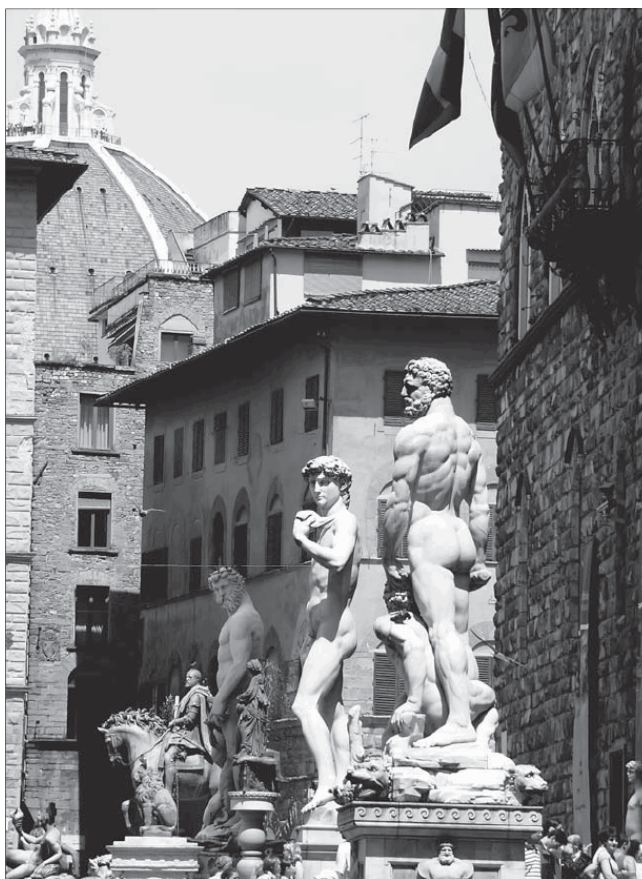
Площадь Синьории. Фото

Эпоха Просвещения способствовала постепенному включению в общеевропейскую культурную жизнь всех европейских народов (IV.1). «Галлизация» Европы, прежде всего языковая, отражала не просто экспансию французской культуры 70 . Французский язык оказался необходимым инструментом в европейских контактах, сменив ученую латынь, которая функционировала лишь в узком кругу «республики ученых» ( res publica literaria ). Универсализм культуры Просвещения, претендуя на мировой масштаб (космополитизм в тогдашнем понимании), способствовал прежде всего укреплению общеевропейских тенденций. Определенную роль сыграли различные формы освоения восточной культуры.