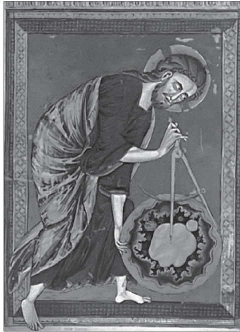
Сотворение мира. Миниатюра. Франция. Начало XIII в.