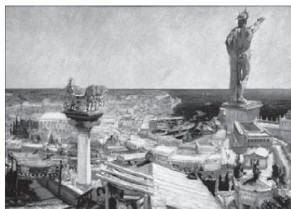
Франтишек Купка. Колосс Родосский. 1906

Осваивая пространство, человек постоянно наполнял его артефактами, знаками и значениями, осмыслял природные признаки. В одних случаях природа, будучи лишь вдохновителем, сохраняла собственное пространство, в других – оно переставало быть таковым, становясь «культурным», независимо от аксиологии происходивших в нем изменений.