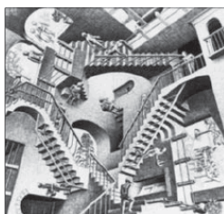
Мориц Эшер. Относительность. Литография. 1953

Текстуализация пространства: немного историографии. – Пространство бытия культуры. – Человек и пространство. – Семантизация пространства. Признак. Локусы «создающего текст мира». – Пространственное взаимоположение культур