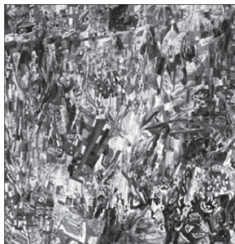
Павел Филонов. Формула весны. 1920

которой, в свою очередь, обнаружили механистическое начало. Г. Гельмгольц провозгласил, что «конечной целью естествознания является отыскание всех движений, лежащих в основе изменений и их двигателей, следовательно, сведение себя к механике» (1869). Поэты также оказались склонны к подобным представлениям. М. Метерлинк полагал, что цветы «исполнены гордого притязания захватить и покорить поверхность земного шара, умножая до бесконечности представляемую ими форму бытия... Поэтому большинство растений прибегает к хитростям, комбинациям, к устройству снарядов и силков, которые, в отношении механики, баллистики, воздухоплавания и наблюдений над насекомыми, часто превосходят изобретения и знания людей». Вместе с тем развитие индустрии он видел как воспроизведение эволюции растений («Разум цветов». 1907) 112 .