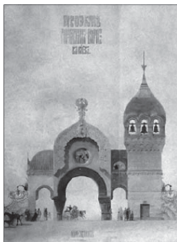
В.А. Гартман. Эскиз городских ворот в Киеве. Карандаш, акварель. 1870

Метаморфоз происходит во времени, поэтому в пространственных искусствах он связан по преимуществу с самим процессом создания, а в дальнейшем и бытования их произведений. В музыке же – наиболее «чистом» временном искусстве – на метаморфозе построены такие формы, как транскрипция, парафраз, вариация, так называемая сонатная форма (или сонатное аллегро), которая определила драматургию сонаты и симфонии. Принцип этих жанров – общность тематизма, в разной степени и по-разному выраженного в каждом из них. Метаморфоз лежит в основе исполнительского искусства. Стремление музыкантов раскрыть авторский замысел, строго следовать «предписанному» композитором тексту дает результаты тем более удаленные друг от друга, чем ярче индивидуальность исполнителей, что ведет к наиболее глубокому переосознанию текста, не нарушая его идентичности.