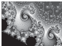
Бенуа Мандельброт. Принцип фрактала

ход. Особой целостностью предстали Балканы 27 . Вместе с тем они были показаны как часть «средиземноморского макроконтеста», скрепленного в истоках судьбоносным путешествием Энея 28 . Круг исследований оказался расширен за счет обращения к евразийскому пространству, к проблеме пространства в контексте славянских культур 29 . Движению в пространстве, раскрываемом через такие атрибуты, как путь, дорога, любого типа странствие, посвящены этнолингвистические и фольклорные славистические исследования, в качестве движения в пространстве рассматривались художественные связи 30 . Пространство культуры было соотносено с виртуальным пространством 31 . Историко-культурные аспекты проблемы пространства выступили в активно развивающейся «новой географии», имеющей много разветвлений, оперирующей понятием географического образа ( geographical image, vision ) 32 .