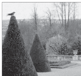
Сен-Клу. Терраса сада. Фото.

Человек и природа. – Что есть природа! – Между естественным и искусственным. Попытки сближения