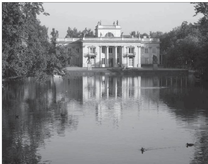
Доменико Мерлини, Ян Христиан Камзетцер. Лазенки. Дворец на Острове. 1772–1793

Природа, так или иначе воспринятая, становится пространством культуры. В отличие от «садообразного пейзажа», каким природа предстает в своих наиболее гармоничных проявлениях, именно в культурном пространстве располагается созданная человеком садово-парковая «вторая натура», которую одному из авторов XVI в. было «непонятно, как и назвать». Сад как возделанный участок земли – это всегда пространство культуры 105 , что относится и к временам, не осознававшим специфичность культурной и эстетической деятельности (В полной мере это пришло лишь с Ренессансом. Именно тогда началось художественное моделирование ландшафта 106 .) Однако попадая в сферу культуры, сад не перестает при этом оставаться пространством природы – небо служит такой же его необходимой составляющей, как и земля. Декоративность небесных (в прямом смысле) естественных световых эффектов постоянно учитывалась создателями садов как в Версале, так и в английских парках. Природа сохраняет в саду свойство быть живой природой – сад всегда растет, это также принималось во внимание садоводами в их проектах. Сад живет и в природном времени, и в историческом.