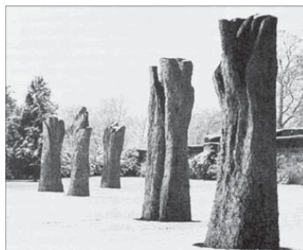
Магдалена Абаканович. Рукоподобные деревья. Бронза. 1992–1993

строения органов растений и изменением внешнего вида и образа жизни животных. Термин метаморфоза (ж. род, ед. ч.) введен в этом словаре дважды – первый раз без истолкования, лишь с обозначением специальный , и во второй – в конкретном смысле: «коренное изменение кого-, чего-л., превращение». В широком плане оба термина применимы для обозначения смысловых, структурных и образных превращений, происходящих в пространстве культуры. Ее метаморфозы начинаются с того, что все, чего она коснется, становится культурой, даже будучи только отрефлексировано.