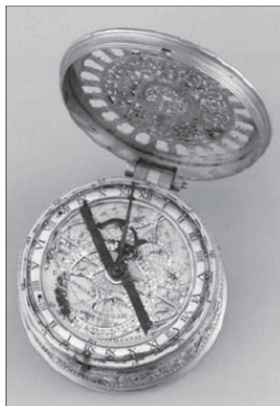
Карманные часы с астрольбией. 1570

тура не утратила свою связь с матерью-природой. Поэтому садоводы Века философов хотели искусственно воспроизводить естественную природу.