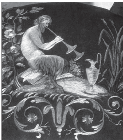
Андрей Воронихин. Фавн. Обивка стула. Павловск. Начало XIX в.

© Издательство «Индрик», оформление, 2009