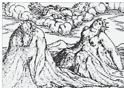
Овидий. Метаморфозы. Иллюстрация к изданию 1585 г. Венеция

В результате мысль о природе пришла от сакрализации естественного ландшафта Святой земли к почитанию отечественной природы даже в ее самых скромных формах. Сад послужил тем эстетизированным и насыщенным разного рода ассоциациями пространством, которое опосредовало этот переход, сохранив дух сакральности и открыв красоту естественного ландшафта, а в дальнейшем родной по ментальной принадлежности природы. Садовый материал позволяет проследить и другие метаморфозы, в том числе связанные с мифологизированными топосами не только Рая и Святой земли, но и Аркадии, обратить внимание на семантические метаморфозы признаков (в данном случае естественный – искусственный ). Метаморфозы не позволяют оппозициям жестко структурировать мир, о чем, в частности, свидетельствует анализируемая далее оппозиция сакральное/мирское в истории сада. Садовое искусство дает возможность наблюдать метаморфозы пространства, которые не являются лишь «садовыми», а воплощают отношение различных эпох к пространству в целом, что показано относительно Просвещения, романтизма и бидермейера.