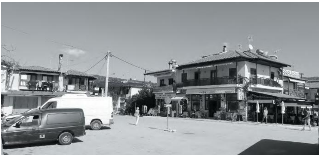
Уранополис – город у границы Афона. Ворота Св. Горы