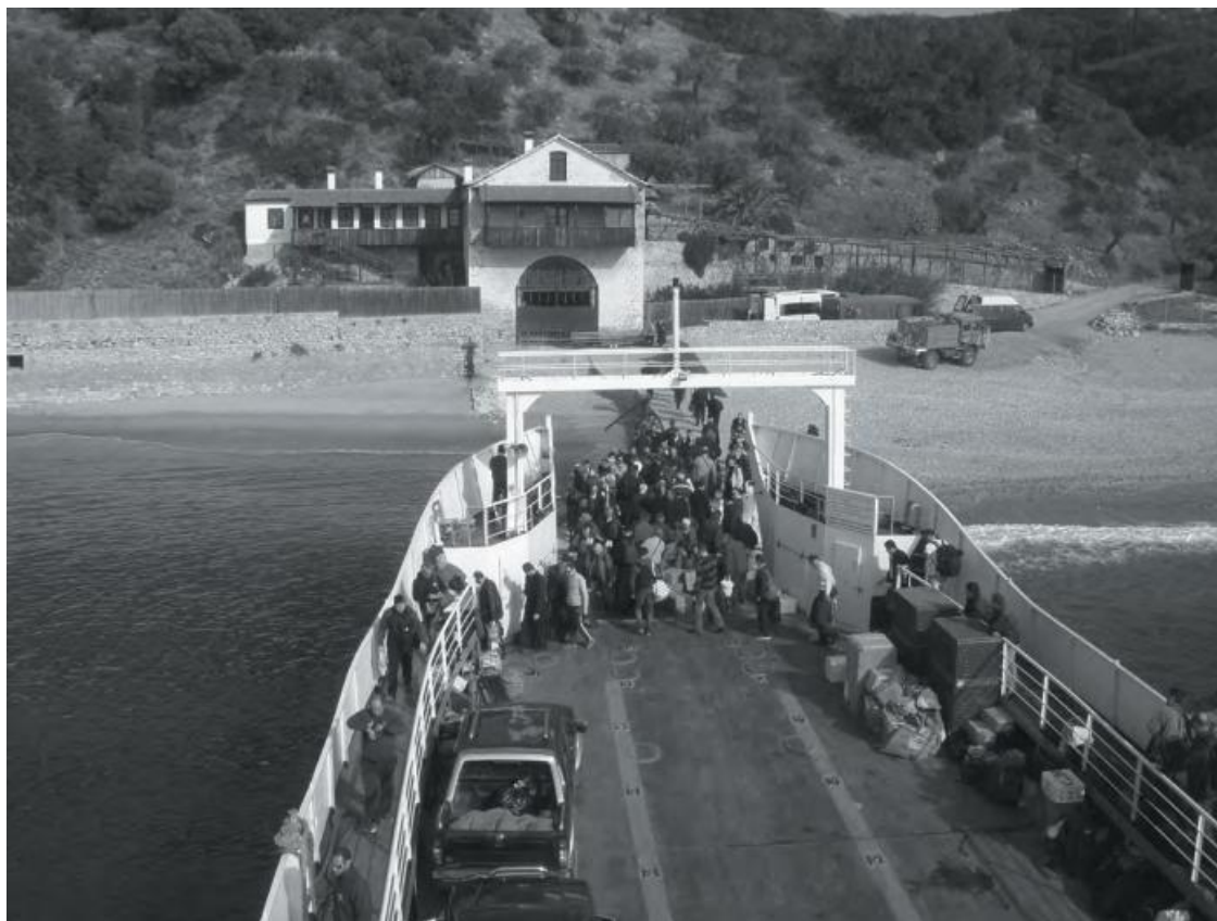
Паром у причала сербского монастыря Хиландар

тую Гору. В магазинчике на главной улице Уранополиса, где мы покупали посохи, нам настоятельно советовали купить и плащи, но мы, как потом выяснилось, опрометчиво, отказались.