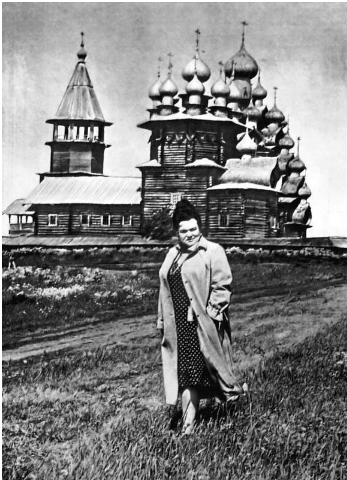
Русская старина питала ее творчество. Кизи. 1985 г.