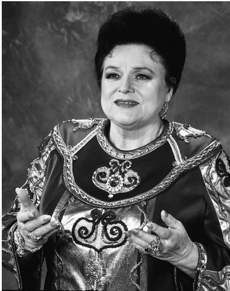
Людмила Георгиевна Зыкина – Королева русской