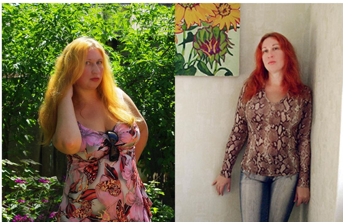
110 кг до низкоуглеводной диеты

Я выбрала для себя низкоуглеводную диету и домашнее приготовление, потому что я могу контролировать состав ингредиентов в блюде. Конечно, такое приготовление оказалось по времени более долгим, чем покупка готовых блюд, но мое здоровье стало постепенно выправляться. Через пару лет я похудела на 20 килограмм и это для меня было хорошим знаком. Сейчас мой вес составляет 75 кг. и я контролирую свой сахар в крови. И все это произошло благодаря тому, что я сама готовлю еду, а не покупаю из магазина продукты с неизвестным составом.