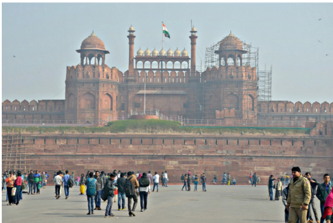
Красный форт в Дели

Форт поражает своими размерами, ажурной красотой башенок, арок, галерей. К счастью в нём ведутся восстановительные и реставрационные работы.