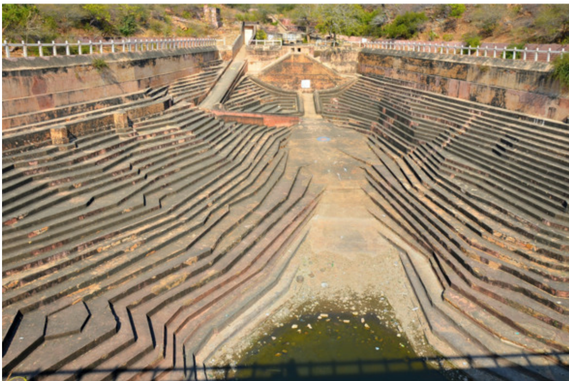
Колодец в Нахаргаре

Замечу, это было первое место, что заинтересовало меня по-настоящему.