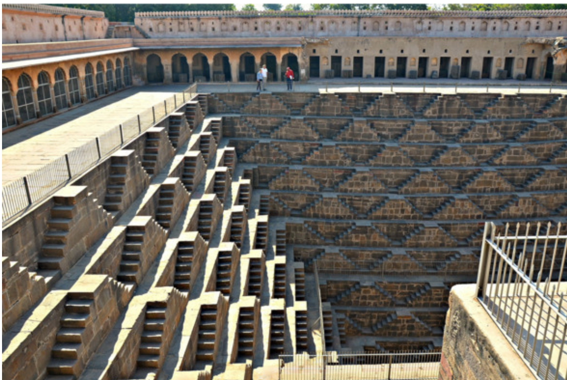
Колодец Чанг Баоли

Вход к этому шедевр свободный, что меня удивило. Он потрясает своим масштабом и дизайном. За 30 минут я не успела исследовать весь объект и осталась досмотреть, а мой водитель не обиделся. После затяжной экскурсии он без скандала отвёз меня на автостанцию к транспорту в Джайпур. А это, надо сказать, неслыханный для Индии случай, чтобы с вас не потребовали лишних денег за неустойку.