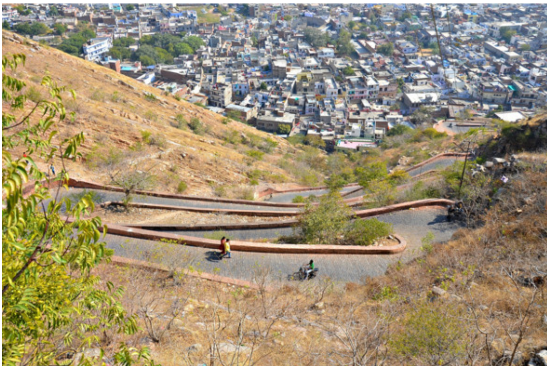
Дорога в гору

Жарища! У меня с собой кило мандаринов и маленькая бутылка с водой. У каждого витка дорожного серпантина усаживалась в тенёчек на бордюр и съедала цитрус.