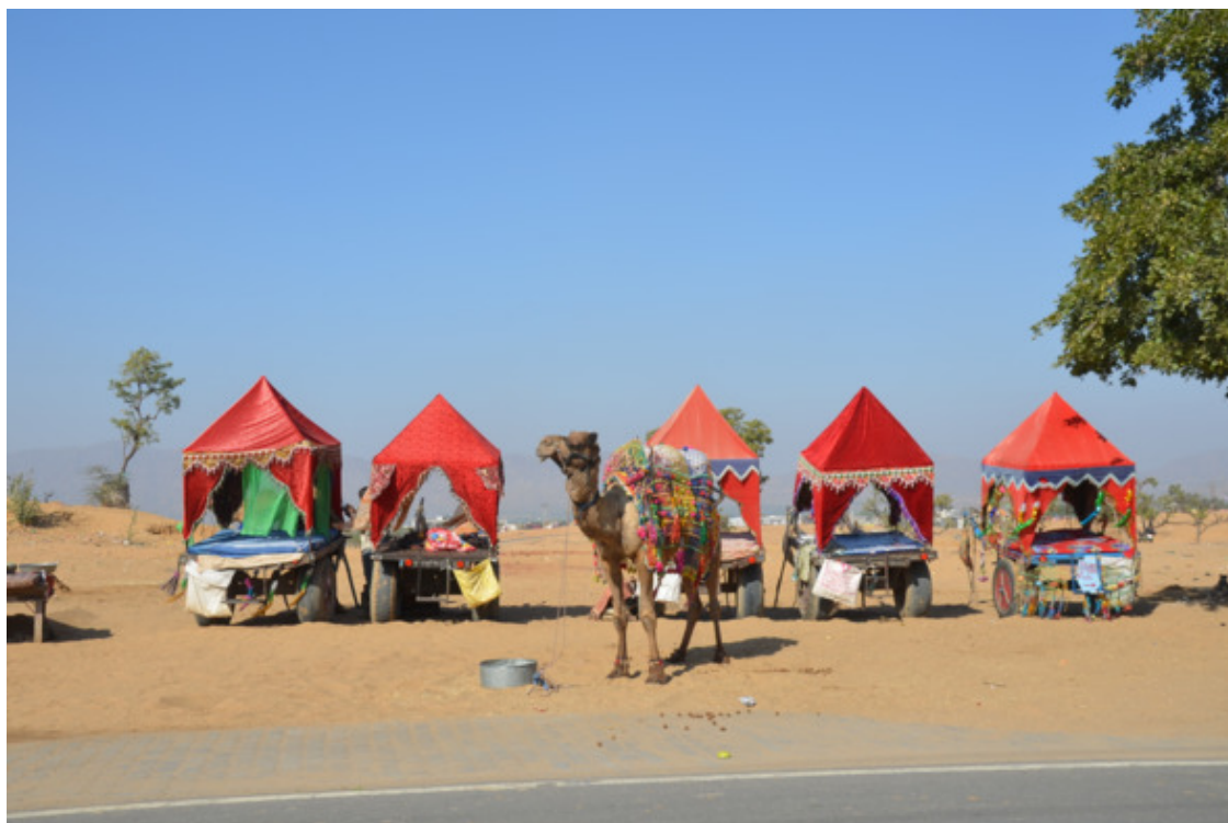
В ожидании заработка

Думаете, мне это удалось? Ничего подобного. Меня то и дело нагоняли пёстрые кареты. Попоны у двугорбых плетены с выдумкой, ярко вышиты, с бубенчиками понизу. Они выгодно и пышно прикрывали худые верблюжьи бока.