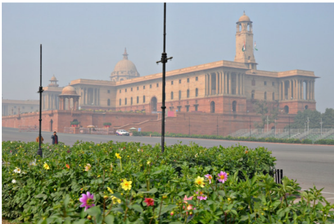
Смог в Дели

Удивило то, что смог над Дели такой, от которого тяжело дышать. Вчера, находясь в культурном шоке, не обратила на него внимание, а сейчас думала, задохнусь.