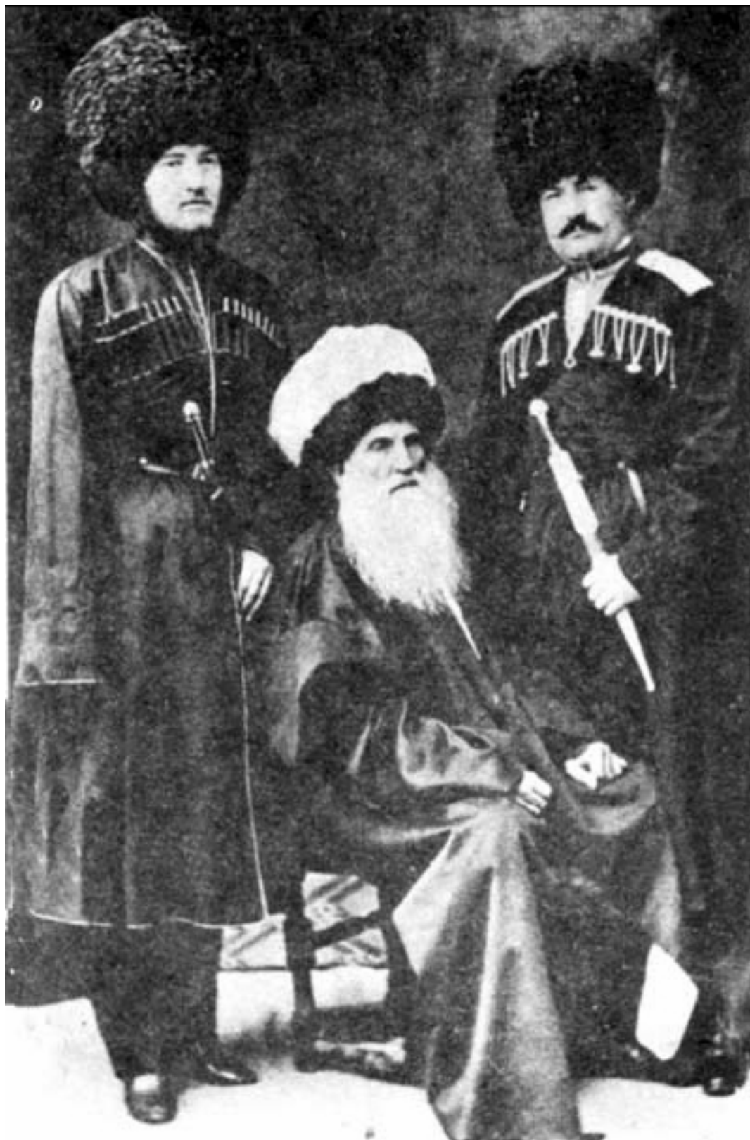
Шамиль с сыновьями Кази-Мухаммадом и Мухаммадом-Шефи