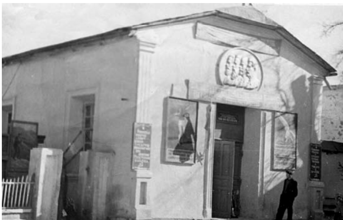
Польский костел в Темир-Хан-Шуре (1854)