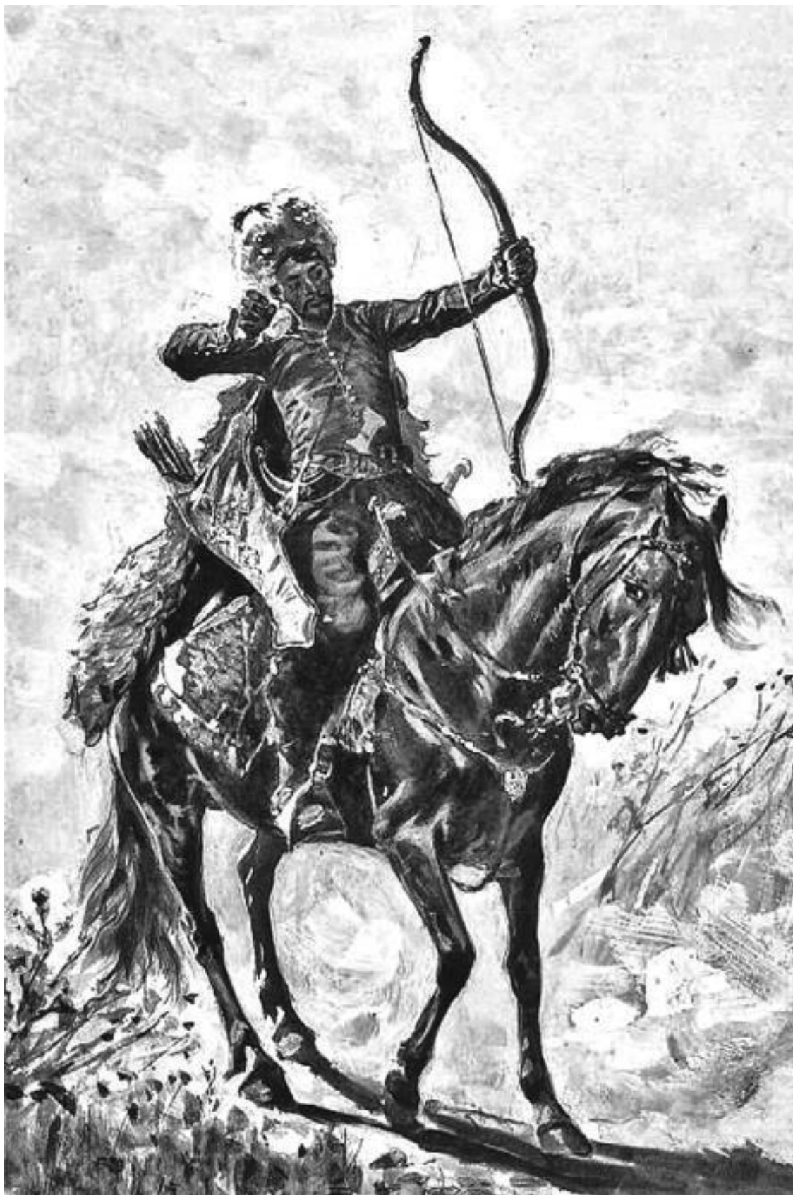
Крымско-татарский лучник. Рисунок В. Павличака, XIX в.

Хан вышел к Москве одновременно с воеводами и обосновался в Коломенском, его войско разграбило незащищенные слободы, а затем подожгло предместья Москвы.