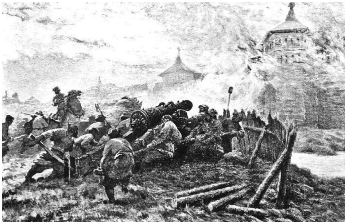
Осада Казани в 1552 году. Художник В. С. Бодров

На узких и кривых улицах Казани произошла кровавая сеча, столица ханства пала.