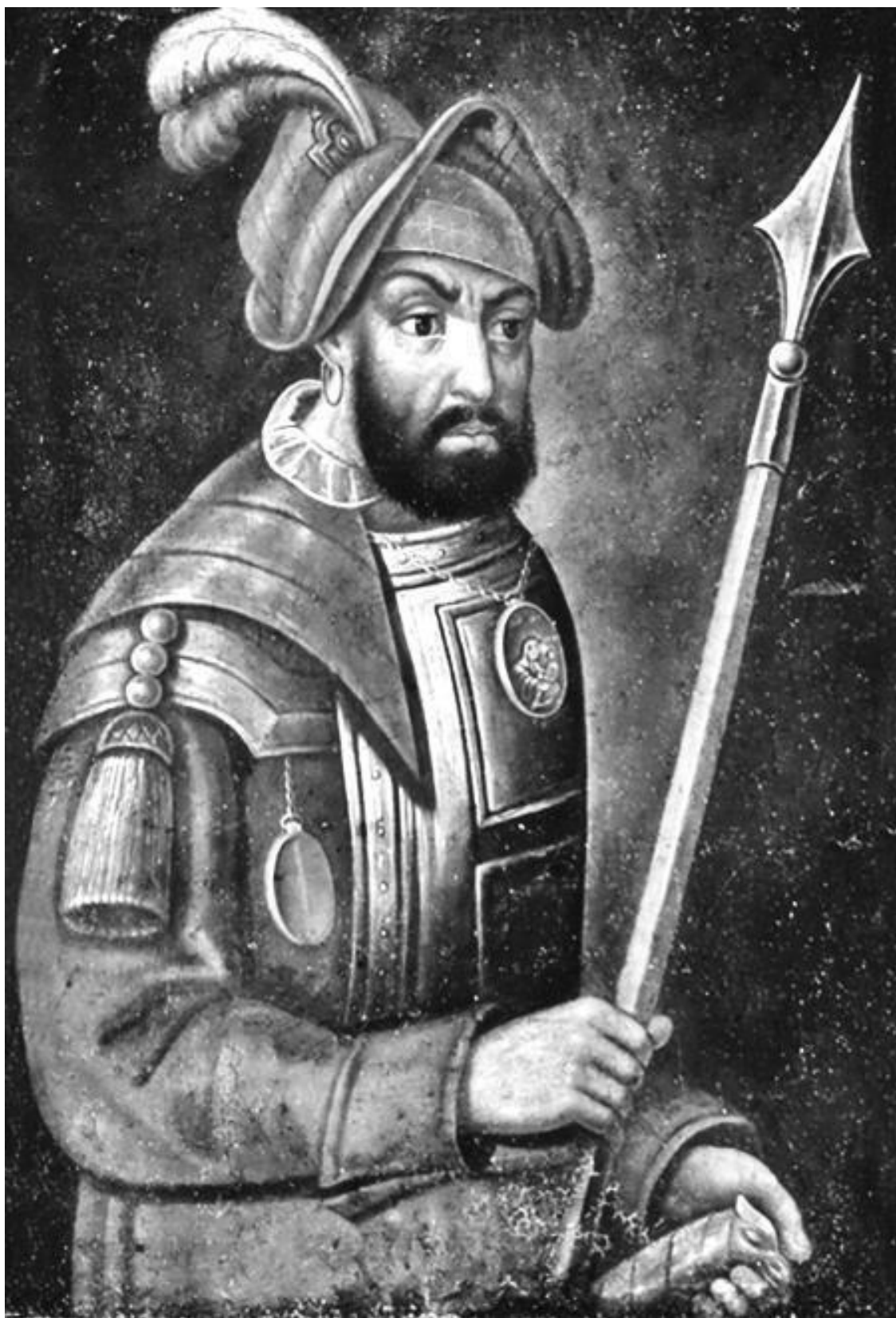
Портрет Ермака. Неизвестный художник, XVIII в.

Ермак получил весьма красноречивое прозвище – Токмак. В России были разные говоры, оттого слово «токмачить» имело неодинаковый смысл. Одни под словом «токмачить» подразумевали «толочь», а словом «токмач» обозначали увесистый пест либо «бабу» для трамбовки