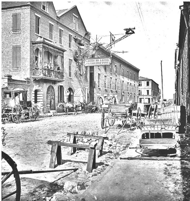
Чарлстон, Южная Каролина, США, 1865 год

Негры не составляют настоящего повода к войне. Если б дело шло об одних неграх, то с эмансипацией их дело должно бы и кончиться. Эмансипация их неизбежна для Южных штатов; но если бы и совершилась эта эмансипация, то Се-