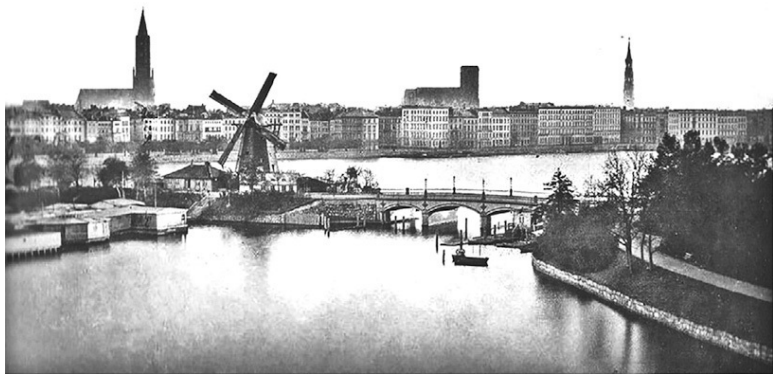
Гамбург около 1860 года, Ломбардский мост

зации, а иногда ясли, в которых рождается спаситель.