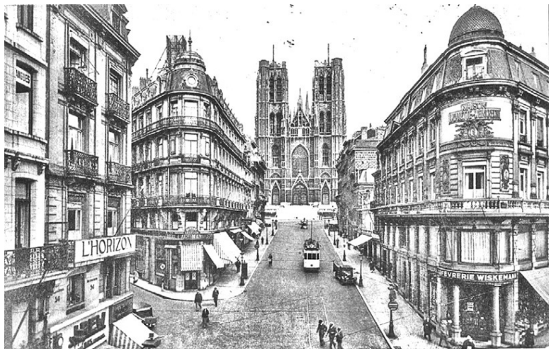
Брюссель. Начало XX века